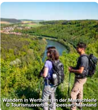
Wandern in Wertheim an der Mainschleife

Industriering 7, 63868 Großwallstadt, Tel.: 06022 261020, info@spessart-mainland.de, www.spessart-mainland.de