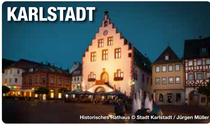
Historisches Rathaus

Hinter einer der schönsten Ortssilhouetten entlang des Mains öffnet sich dem Besucher eine fränkische Stadt von besonderem Reiz. Dabei, alles überragend, die Ruine der Karlsburg jenseits des Mains, von der man einen wunderschönen Ausblick auf Karlstadt und die einzigartige Naturlandschaft der Region hat. Die Altstadt von Karlstadt zieht Besucher und Fachleute gleichermaßen in ihren Bann. Kein Wunder, denn nahezu unverändert hat sich der Mustergrundriss der stauferzeitlichen Stadt erhalten, deren Glanzpunkte die romanisch-gotische Stadtpfarrkirche, das Historische Rathaus, die Tore und Türme der Stadtbefestigung sowie die Bürgerhäuser mit ihren oftmals aufwändigen Fachwerkfassaden bilden. TreffpunktDeutschland.de/karlstadt