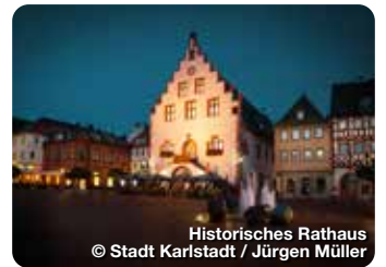
Historisches Rathaus

Carlo Dernbach entwarf 12 Karikaturen über den fränkischen Wein und Himmelstadt. Diese wurden mit Gedichten und Sprüchen rund um dieses Thema ergänzt. Weinbergskapelle „Maria an der Kelter“, Himmelstadt