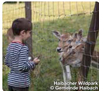
Haibacher Wildpark

Als Nahtstelle zwischen Stadt und Land treffen hier das urbane Leben und die Beschaulichkeit einer abwechslungsreichen, ursprünglichen Natur aufeinander. Schöne Spazier- und Wanderwege, gemütliche Einkehrmöglichkeiten und eine abwechslungsreiche, ursprüngliche Natur mit dichten Waldbeständen, klaren Bächen und herrlichen Ausblicken über den Spessart erwarten den Besucher. Auch für Fahrradbegeisterte, ob sportlich mit dem Mountainbike über die Spessarthöhen oder eher geruhsam in den Talauen, ist Bessenbach ein Erlebnis. Sehenswürdigkeiten, wie der Kirchberg in Oberbessenbach mit der mächtigen Pfarrkirche St. Stephanus und der mittelalterlichen Ottilienkirche, erinnern genau wie die Bildstöcke und Feldkreuze an vergangene Zeiten und laden zur Rast ein. TreffpunktDeutschland.de/bessenbach