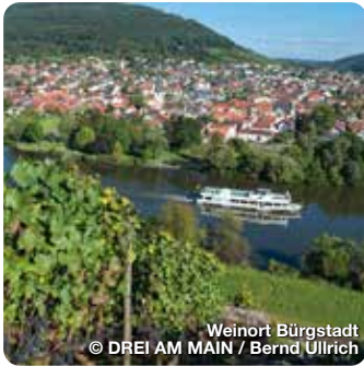
Weinort Bürgstadt