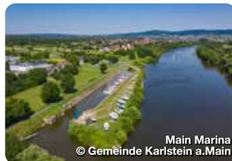
Main Marina

Heigenbrücken liegt inmitten ausgedehnter Wälder. Das milde Klima der Spessarthöhen, die gesunde Luft und die märchenhafte Landschaft bieten Ruhe und Erholung. Hier finden Sie: über 100 km gut markierte Wanderwege mit Lehr- und Lernpfaden sowie Nordic-Walking-Parcours, Wildgehege mit Wasserlandschaft, Kletterwald, Freizeitanlage mit Wasserspielplatz und Kiosk, Naturschwimmbad, Sport-Reha-Zentrum und vieles mehr. Gepflegte Hotels, Gaststätten, Pensionen und Privatquartiere bieten herzliche Gastlichkeit. Sie erreichen Heigenbrücken in ca. 12 km über die Autobahn A3 (Anschlussstelle 63 Weibersbrunn) oder mit der Bahn auf der Strecke Frankfurt - Würzburg. TreffpunktDeutschland.de/heigenbruecken