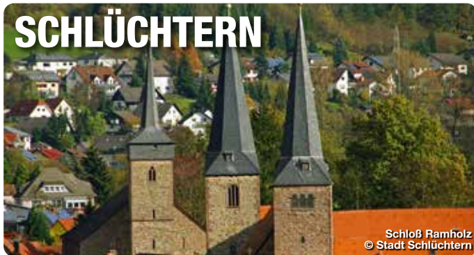
Schloß Ramholz

Die Stadt Schlüchtern befindet sich im Bergwinkel, da wo die Ausläufer von Rhön, Vogelsberg und Spessart zusammentreffen. Man findet dort satte grüne Wiesen, schattige Wälder und märchenhafte Burgen und Schlösser. Von hieraus gibt es viele Möglichkeiten, den hessischen Spessart zu erkunden. Wanderer und Radfahrer kommen voll auf ihre Kosten. Es gibt viel zu Erleben beim Adventure Minigolf und zahlreichen kulturellen Angeboten. Die Highlights des Jahres sind der Helle Markt im Mai und der Kalte Markt im November. Zudem trägt Schlüchtern seit 1966 das Prädikat „Luftkurort“. Den Strukturwandel in der Stadtmitte sieht man besonders gut im umgebauten Bergwinkelmuseum, dem neuen Kultur- und Begegnungszentrum und dem neugestalteten Stadtplatz am Rathaus. TreffpunktDeutschland.de/schluechtern