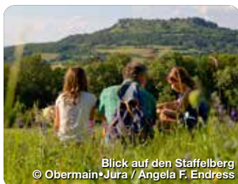
Blick auf den Staffelberg

Pretzfelder Straße 15, 90425 Nürnberg, Tel.: 0911 941510, info@frankentourismus.de, www.frankentourismus.de