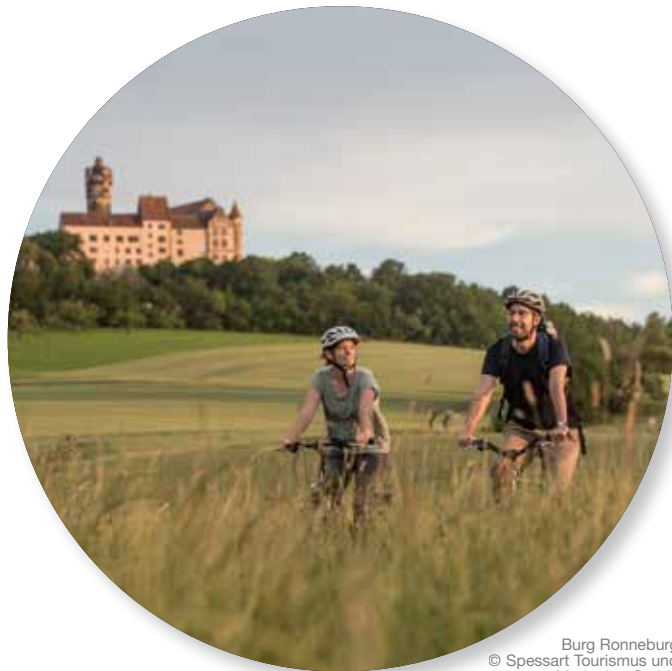
Burg Ronneburg

Spessart Tourismus und Marketing GmbH Holzgasse 1, 63571 Gelnhausen, Tel.: 6051 887720 info@spessart-tourismus.de, www.spessart-tourismus.de