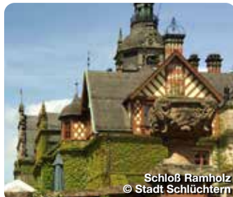
Schloß Ramholz