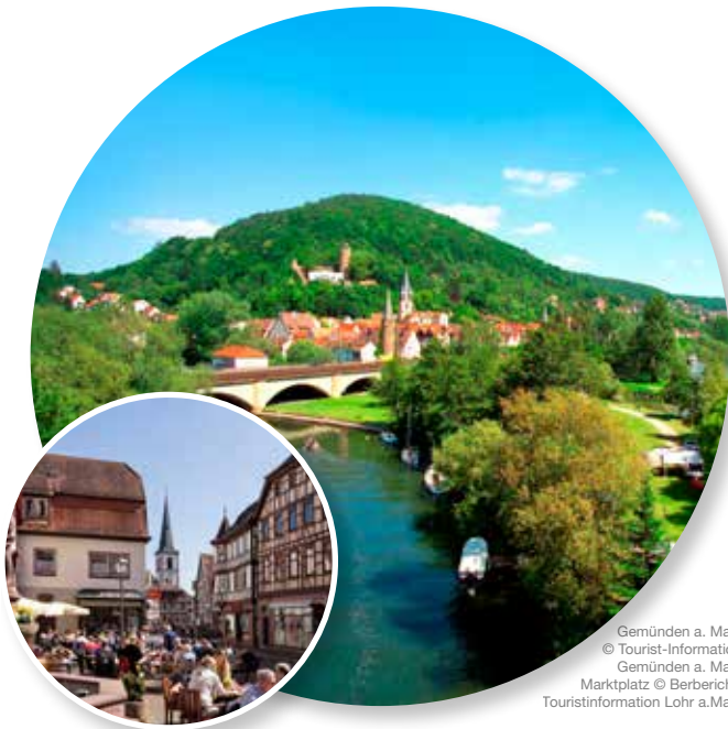
Gemünden a. Main Marktplatz