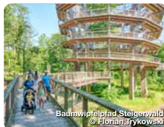
Baumwipfelpfad Steigerwald