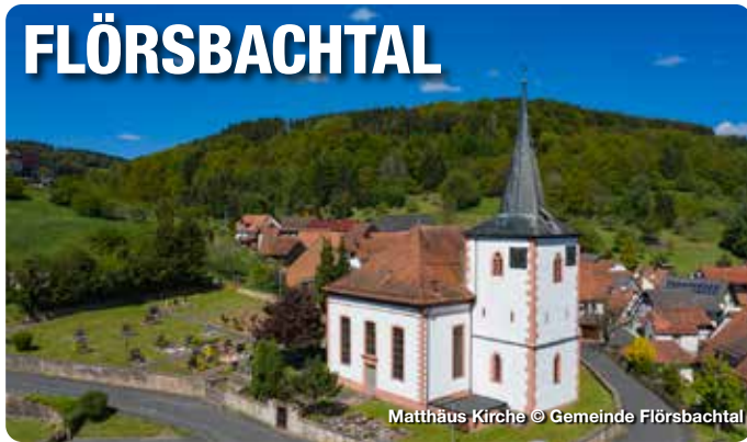
Matthäus Kirche

Am nördlichen Rand des Spessarts, einem der größten zusammenhängenden Waldgebiete in Deutschland, im Städtedreieck Frankfurt, Fulda und Würzburg liegt die Gemeinde Flörsbachtal. Die idyllisch gelegenen vier kleinen Dörfer Lohrhaupten (anerkannter Erholungsort), Kempfenbrunn, Flörsbach und der Weiler Mosborn werben seit Jahren mit dem Slogan „Flörsbachtal – wo der Spessart am schönsten ist“ und haben einiges zu bieten: Ein beheizbares Familienbad mit großer Wasserrutsche, drei Kneipp-Anlagen, ein weitläufiges Wegenetz für Wanderer und Mountainbiker durch herrliche Waldgebiete, drei zertifizierte Kulturwege, „Park der Generationen“ und vieles mehr.