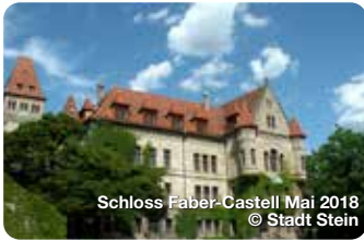
Schloss Faber-Castell Mai 2018