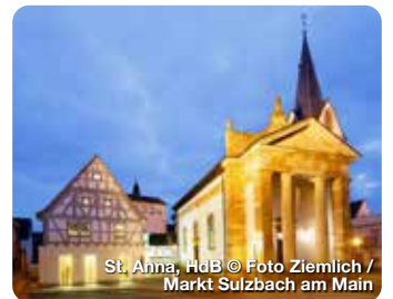
St. Anna, HdB