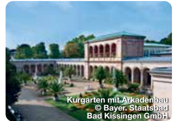
Kurgarten mit Arkadenbau