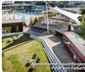
Altmühltherme Treuchtlingen

Quelle purer Lebenslust. Baden und saunieren im wohligen warmen, 18.000 Jahre alten, zertifizierten und staatlich anerkannten Heilwasser nach balneologischen Grundsätzen. Bürgermeister-Döbler-Allee 12, Treuchtlingen