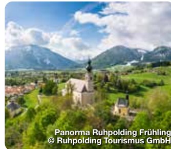
Panorama Ruhpolding Frühling

Güterbahnstraße 9 • 91052 Erlangen • +49 (0)9131 68 19 80 • frontdesk@hi-express-erlangen.de