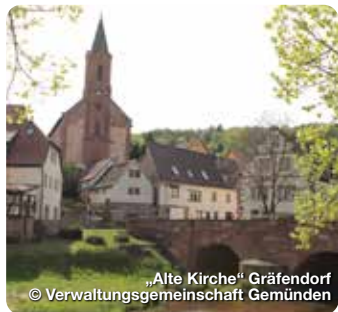
„Alte Kirche“ Gräfenfurt