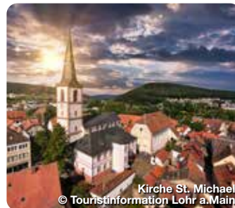
Kirche St. Michael

Karlstadt hat eine der schönsten Ortssilhouetten entlang des Mains. Die behutsame, aber eindrucksvolle Erneuerung, der „am Reißbrett“ geplanten, Altstadt zieht Besucher in ihren Bann. TreffpunktDeutschland.de/karlstadt