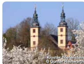
Kloster Triefenstein

Hier dreht sich vieles um den Wein. Seit mehr als 1200 Jahren werden in Retzstadt Trauben geerntet und unter der Bezeichnung „Retzstadter Langenberg“ ausgebaut. TreffpunktDeutschland.de/retzstadt