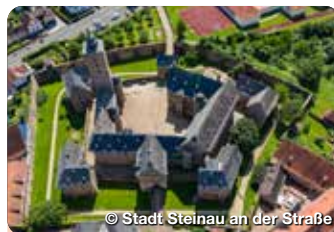
© Stadt Steinau an der Straße

TreffpunktDeutschland.de/steinau-an-der-strasse