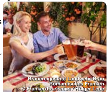
Brauereigasthof Landwehr-Bräu Romantisches Franken

Ob beim Wandern, nach der Radtour oder beim Stadtbummel: Den Durst stillt in Franken ein heimisches Bier. Nirgendwo sonst gibt es eine so große Dichte an Brauereien wie hier. Die zahlreichen Privatbrauereien, Gasthausbrauereien, Kommunbrauereien und Craftbrauer sorgen für eine süffige Vielfalt an unterschiedlichen Biersorten. Die dafür benötigten Zutaten sind ebenso einfach wie regional: Aromahopfen und Braugerste wachsen in Franken direkt vor Ort, das Wasser sprudelt frisch aus den Brunnen der Brauereien. Das fränkische Bier bietet Anlass für viele Reiseerlebnisse: Dazu gehören etwa Braukurse, Biervorkostungen oder sogar Stadtführungen im Zeichen des Bieres. Außerdem lohnt sich ein Besuch in den zahlreichen Bier- und Brauereimuseen. Darüber hinaus verfeinern die fränkischen Brauerzeugnisse viele kulinarische Genüsse, die jetzt im Herbst Hochkonjunktur haben – von der wärmenden Biersuppe über das deftige Schäufele an Dunkelbiersoße bis zum aromatischen Glühbier. www.franken-bierland.de