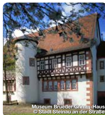
Museum Brüder Grimm-Haus