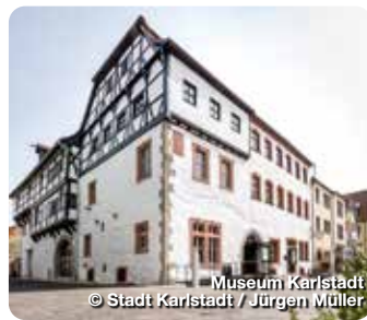
Museum Karlstadt