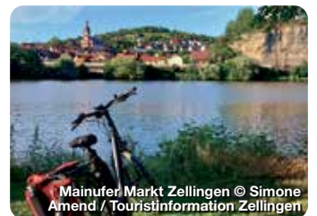
Mainufer Markt Zellingen

Mitten in Deutschland, und ganz nah am Himmelreich, liegt der Markt Triefenstein idyllisch mit seinen vier Ortsteilen Hornburg am Main, Lengfurt, Trennfeld und Rettersheim. TreffpunktDeutschland.de/triefenstein