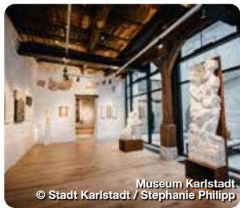
Museum Karlstadt

Hinter einer der schönsten Ortssilhouetten entlang des Mains öffnet sich dem Besucher eine fränkische Stadt von besonderem Reiz. Dabei, alles überragend, die Ruine der Karlsburg jenseits des Mains, von der man einen wunderschönen Ausblick auf Karlstadt und die einzigartige Naturlandschaft der Region hat. Die Altstadt von Karlstadt zieht Besucher und Fachleute gleichermaßen in ihren Bann. Kein Wunder, denn nahezu unverändert hat sich der Mustergrundriss der stauferzeitlichen Stadt erhalten, deren Glanzpunkte die romanisch-gotische Stadtpfarrkirche, das Historische Rathaus, die Tore und Türme der Stadtbefestigung sowie die Bürgerhäuser mit ihren oftmals aufwändigen Fachwerkfassaden bilden. TreffpunktDeutschland.de/karlstadt