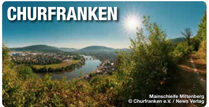
Mainschleife Miltenberg

Zwischen Spessart und Odenwald, zwischen Main und Wein – dort wo die Lebensfreude ihr Zuhause hat, eröffnen sich in Churfranken jede Menge Möglichkeiten, um Glücksmomente zu schaffen. 25 reizvolle Ortschaften halten vieles bereit, was Sie schon längst mal wieder genießen wollten. Gepflegte Fahrradwege, atemberaubende Mountainbike-Trails sowie Wanderwege mit fantastischen Ausblicken auf Wiesen oder Weinberge laden Sie dazu ein, ihren Körper und die Natur intensiv zu spüren. Neben aktivem Genuss bietet die Region eine einzigartige Trink- und Esskultur, die in ihrer Vielfalt stets auf Regionalität und Herzlichkeit beruht und zum Schlemmen und Genießen in den unterschiedlichsten Lokalitäten verführt. Die Landschaft Churfrankens ist gekennzeichnet durch die steilen Weinberge, die sich entlang des Flusses an die Hänge schmiegen.