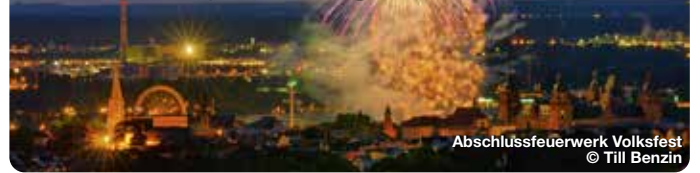
Abschlussfeuerwerk Volksfest

Mit 500.000 Besuchern gilt das direkt am Mainufer gelegene Volksfest in Aschaffenburg vor der Kulisse des Schloss Johannisburg als das größte im südöstlichen Rhein-Main Gebiet. Vorrangiges Ziel ist es, alljährlich ein attraktives und ausgewogenes Angebot an Fahrgeschäften, unterhaltenden Vorstellungen und Kulinarik zu präsentieren.