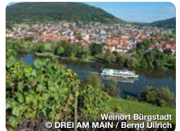
Weinort Bürgstadt