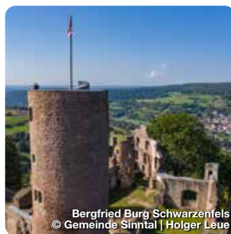
Bergfried Burg Schwarzenfels

Das ehemalige Amtshaus, seit 1998 Brüder Grimm-Haus Steinau, war von 1791-1796 der Wohnsitz der Familie Grimm. Das Museum widmet sich dem Leben, dem Werk und der Wirkung der Brüder Grimm. Brüder Grimm-Straße 70, Steinau an der Straße