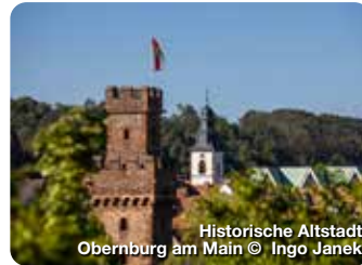
Historische Altstadt Obernburg am Main

TreffpunktDeutschland.de/klingenberg-am-main