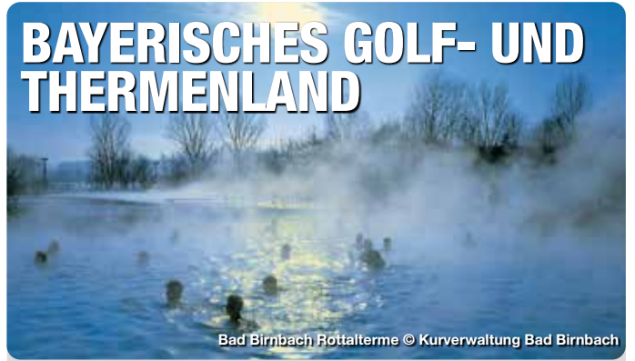
Bad Birnbach Rottalterme

In den Heil- und Thermalbädern Bad Füssing, Bad Griesbach, Bad Birnbach, Bad Gögging und Bad Abbach findet man die richtige Balance zwischen Gesundheit, Entspannung und ganzheitlichem Vital- und Aktivurlaub. Das niederbayerische Umland zeichnet sich durch die höchste Golfplatzdichte Deutschlands aus, mit der Gemeinde Bad Griesbach als dem größten zusammenhängenden Golf-Resort Europas. Die abwechslungsreiche Region bietet als ideale Ergänzung dazu geschichtsträchtige Einblicke in das Herz alter Dom- und Herzogstädte wie Passau, Landshut, Straubing, Dingolfing und Landau. Sie verbinden überliefertes Kulturgut mühelos mit zeitgenössischer Lebensart. TreffpunktDeutschland.de/bayerisches-golf-thermenland