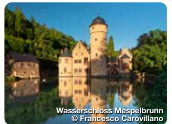
Wasserschloss Mespelbrunn

Der Kahler Sandhas' ist das Wahrzeichen der Gemeinde. Es wurde 1952 als Denkmal gestaltet. Der ursprüngliche Sinn des Namens wandelte sich im Laufe der Zeit. Im Oktober 1951 wurde der Sandhase das erste Mal als Wappentier vorgestellt. Kahl am Main