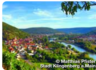
© Matthias Pfister Stadt Klingenberg a.Main