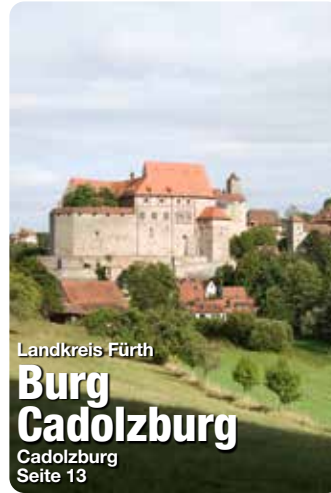
Landkreis Fürth Burg Cadolzburg Cadolzburg Seite 13