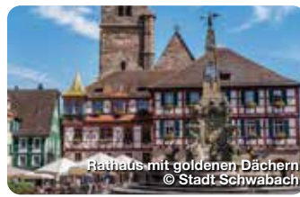
Rathaus mit goldenen Dächern

Das Stadtmuseum Schwabach zählt zu den großen und modernen Museen in Bayern. Einen Höhepunkt bildet die Live-Vorführung der Goldschläger in der sogenannten Goldbox. Museumsstraße 1, Schwabach