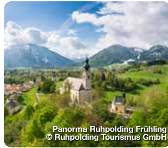
Panorama Ruhpolding Frühling

Das Erlebnis- & Wellnessbad mit großer Saunalandschaft bietet Spaß und Vergnügen für Wasserratten jeden Alters. Branderstraße 1, Ruhpolding