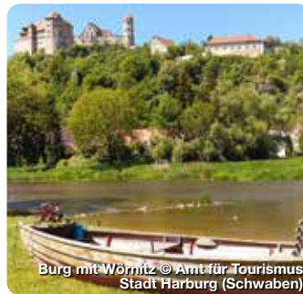
Burg mit Wörnitz