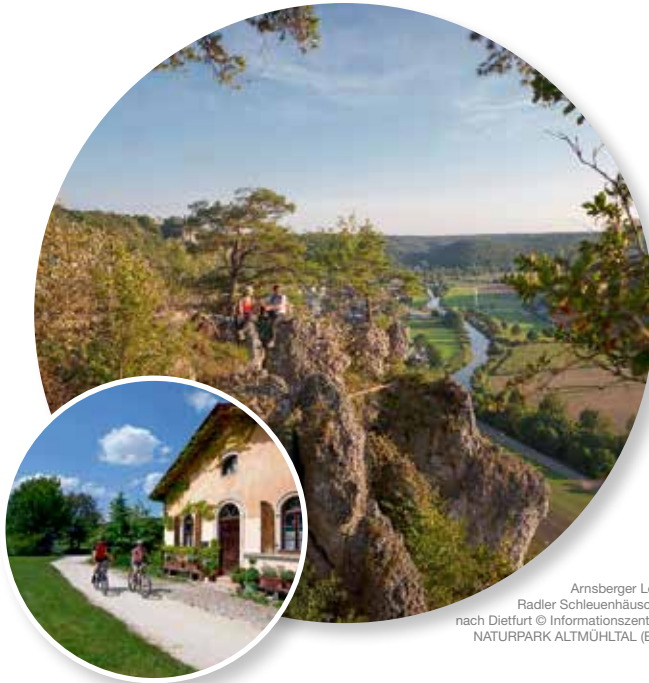
Arnsberger Leite. Radler Schleuenhäuschen nach Dietfurt