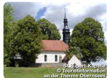
St. Rupert-Kapelle

Längst gilt die Thermo als mehrfach ausgezeichnete „Perle“ der Fränkischen Schweiz. Das mineralhaltige Thermalwasser kommt aus Urtiefen des Juragesteins. Das Wasser belebt und entspannt zugleich. An der Thermo 1, Mistelgau-Obersees