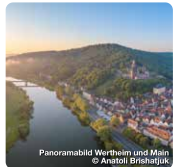
Panoramabild Wertheim und Main

Werbach liegt in einer der landschaftlich reizvollsten Gegenden des „Lieblichen Taubertals“. Sehenswert sind die Burg Gamburg (12. Jhdt.), das Buscher-Museum Gamburg, das Denkmal und Museum des Pfeiferhannes. TreffpunktDeutschland.de/werbach