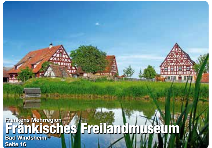
Frankens Mehrregion Fränkisches Freilandmuseum Bad Windsheim Seite 16