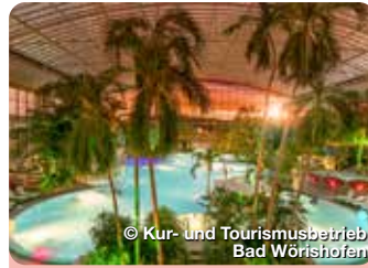
© Kur- und Tourismusbetrieb Bad Wörishofen

Mit zahlreichen Freizeitmöglichkeiten und herzlicher Gastlichkeit empfängt das Kneipp-Original Bad Wörishofen im Allgäu, rund 70 Kilometer westlich von München gelegen, seine Gäste. TreffpunktDeutschland.de/bad-woerishofen