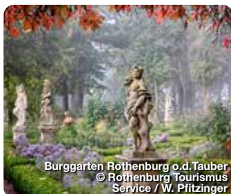
Burggarten Rothenburg o.d.Tauber

Am Kirchberg 4, 91598 Colmburg, Tel.: 0980 94141, info@romantisches-franken.de, www.romantisches-franken.de