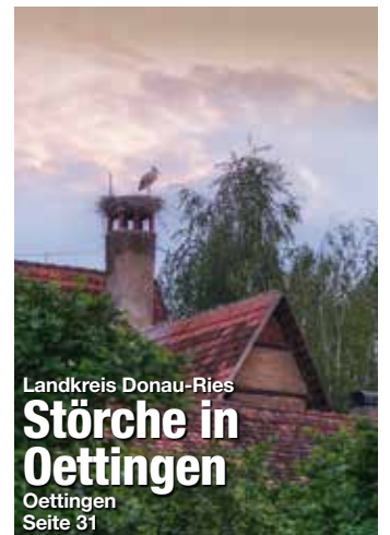
Landkreis Donau-Ries Störche in Oettingen Oettingen Seite 31