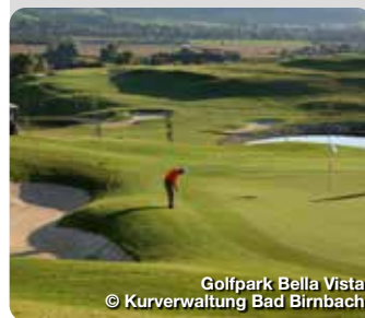
Golfpark Bella Vista

Als staatlich anerkannter Erholungsort mit Heilquellen-Kurbetrieb steht Treuchtlingen für Gesundheit, Wohlbefinden und natürliche Entschleunigung. TreffpunktDeutschland.de/treuchtlingen