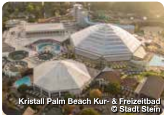
Kristall Palm Beach Kur- & Freizeitbad