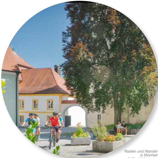
Radeln und Wandern in Monheim