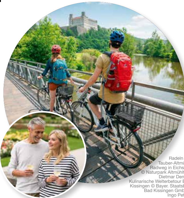
Radeln am Tauber-Altühlt-Radweg in Eichstätt Kulinarische Weiterbetour Bad Kissingen