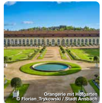
Orangerie mit Hofgarten

Die neugotische Kirche wurde im 19. Jahrhundert erbaut und beeindruckt Besucher mit ihrer imposanten Fassade, hohen Türmen und kunstvollen Verzierungen. Promenade 33, Ansbach