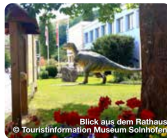
Blick aus dem Rathaus

Das Solnhofener Bürgermeister-Müller-Museum gehört zu seinen originalen Archaeopteryx-Exemplaren und seiner spektakulären Fossilien-Show zu den Schatzkammern Europas. Dieser in Mittelfranken einzigartige Anziehungspunkt ist im neuen „Geo-Zentrum Solnhofen“ mit drei wichtigen Außenstellen im Gelände verknüpft. Die Außenbereiche mit dem Hobbysteinbruch und den beiden bedeutenden bayerischen Geotopen „Zwölf-Apostel-Felsen“ und „Urvogelfundstelle Langenthalheim“ führen zurück in eine etwa 150 Millionen Jahre alte Erdgeschichte zum Anfassener Bahnhofstr. 8, Solnhofen