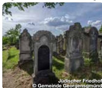
Jüdischer Friedhof

Inmitten einer leicht hügeligen und waldreichen Landschaft, umgeben von Hopfenfeldern, eingebettet zwischen Brombachsee und Rothsee – so präsentiert sich Georgensgmünd seinen Besuchern. Eine Vielzahl von Wanderwegen lädt Naturliebhaber zu abwechslungsreichen Exkursionen in die Umgebung ein. Doch auch der Kernort der Rezatgemeinde ist einen Besuch wert... Das heute noch erhaltene Ensemble aus Ehemaliger Synagoge, Jüdischem Friedhof und Taharahaush gilt in dieser Zusammenstellung als einmalig und präsentiert seinen Gästen ganz besondere Einblicke in die Geschichte des fränkischen Landjudentums. Auch Kunst spielt in Georgensgmünd eine große Rolle. Mehr als 40 Skulpturen und Künstlerbrunnen warten im Gemeindegebiet auf ihre Entdeckung. TreffpunktDeutschland.de/georgensgmued