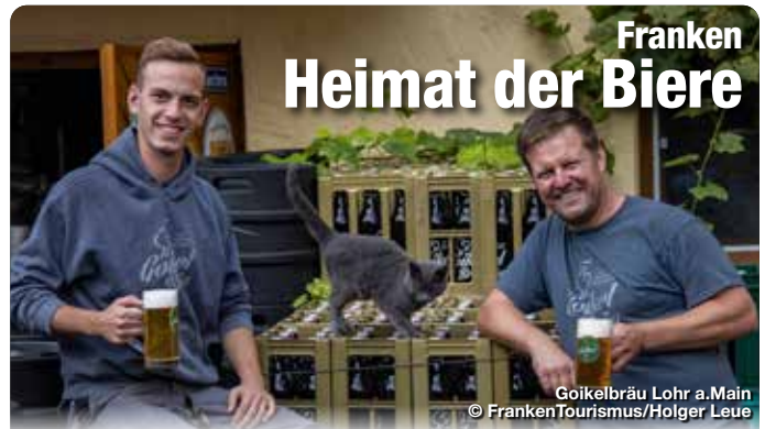
Goikelbräu Lohr a.Main