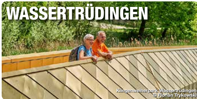
Klingenweiherpark Wassertrüdingen

Das Barockschloss der Fürsten ist Wahrzeichen der Stadt Schillingsfürst. Die Museumsräume und Parkanlagen weisen auf die Glanzzeiten einer kleinen fürstlichen Residenz hin. Am Wall 14, Schillingsfürst