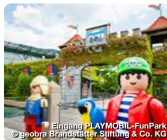
Eingang PLAYMOBIL-FunPark