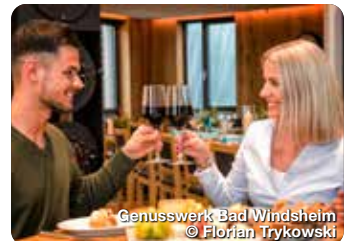
Genusswerk Bad Windsheim