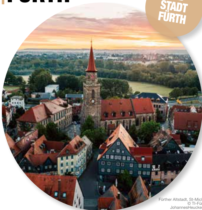
Fürther Altstadt, St-Michael