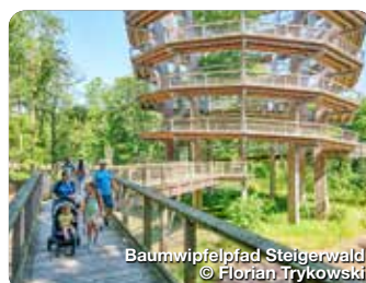
Baumwipfelpfad Steigerwald