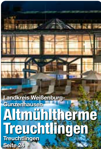
Landkreis Weißenburg-Gunzenhausen Altmühltherme Treuchtlingen Treuchtlingen Seite 24