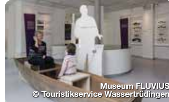
Museum FLUVIUS