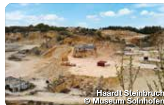
Haardt Steinbruch

Das Treuchtlinger Volksfest ist eines der bekanntesten und beliebtesten Heimatfeste im Naturpark Altmühltal. Zu den Höhepunkten am 2. Volksfestsonntag zählt traditionell der große Festzug, den die Vereine gemeinsam ideenreich gestalten.