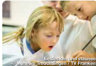
Entdecken und staunen