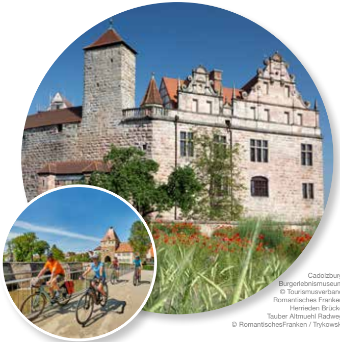
Cadolzburg Burgerlebnismuseum Herrieden Brücke Tauber Altmuehl Radweg