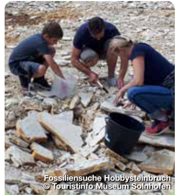
Fossilien-suche Hobbysteinbruch