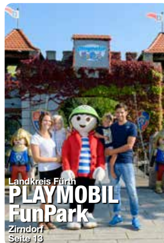
Landkreis Fürth PLAYMOBIL FunPark Zirndorf Seite 13

Jetzt QR-Code scannen, ePaper herunterladen und noch mehr Seiten als hier online entdecken!