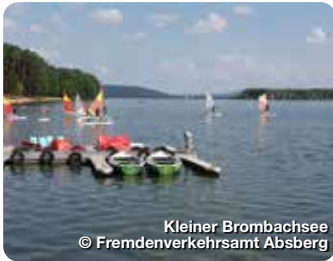
Kleiner Brombachsee