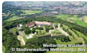
Weissenburg Würzburg

TreffpunktDeutschland.de/weissenburg-in-bayern