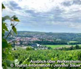
Ausblick über Weikersheim