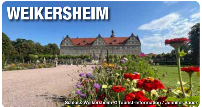
Schloss Weikersheim

Eingebettet in Weinberge liegt Weikersheim mit einem der bedeutendsten Renaissance-Schlösser Deutschlands und seinem prächtigen barocken Schlossgarten inmitten des Lieblichen Taubertals. Für Radfahrer und Wanderer ist die Stadt mit ihrem bestens ausgebauten Radwegenetz und Wanderwegen ein idealer Ausgangspunkt. Aber auch Kunst und Kultur kommen nicht zu kurz: In dem Konzerthaus TauberPhilharmonie wird ein hochkarätiges Programm angeboten. Skulpturen- und Foto. SCHAU geben den Besuchern die Möglichkeit Kunst im öffentlichen Raum im historischen Ambiente zu betrachten. Lebendige Geschichte und der fürstliche Charme von einst sind auch heute noch spürbar. Ideal für eine Auszeit aus dem Alltag.