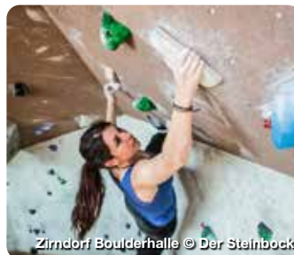
Zirndorf Boulderhalle

Naturlandschaft und Stadtfair – Landkreis Fürth entdecken. Im fränkischen Landkreis Fürth, beim Städtedreieck Nürnberg, Fürth und Erlangen gelegen, gibt es viele Erlebnisse zu entdecken. Auf den zahlreichen Rad- und Wanderwegen durch das bezaubernde Bibertal oder den verträumten Zenngrund lässt sich der Landkreis entdecken. Bei Schlechtwetter können sich Besucherinnen und Besucher den Indoor-Aktivitäten zuwenden. Genieß den Tag mit einem Spaziergang durch die historischen Räume des Faber-Castell Schlosses, mit Erholung in der Palm Beach Saunawelt oder mit einem Abend in den urigen Restaurants der Region. TreffpunktDeutschland.de/fuerth-landkreis