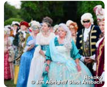
Rokoko © Jim Albright / Stadt Ansbach