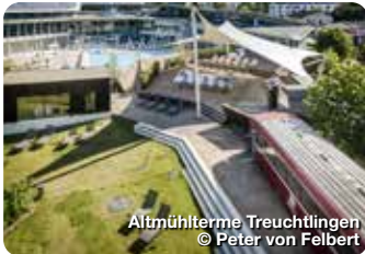
Altmühltherme Treuchtlingen