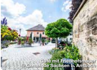
Café mit Friedhofsmauer