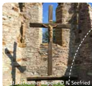
St. Katharinenkapelle