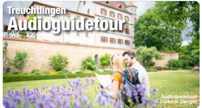
Audioguidetour © Dietmar Denger

Entdecken Sie Treuchtlingen auf eine einzigartig informative und faszinierende Art mit unserem neuen Audioguide! In 23 kurzweilig kommentierten Stationen lernen Sie die Stadt und ihre reiche Geschichte kennen. Die Stationen sind völlig unabhängig voneinander, sodass Sie Ihre Entdeckungstour ganz nach Ihren Interessen individuell gestalten können. Unsere sorgfältig konzipierten Thementouren, wie die Mittelalter-, Kelten-, Römer-, Kirchen- oder Eisenbahntour, bieten Ihnen ausgewählte Einblicke in die Besonderheiten der Stadt. Der Audioguide überzeugt durch seine einfache Be-