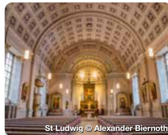
St. Ludwig