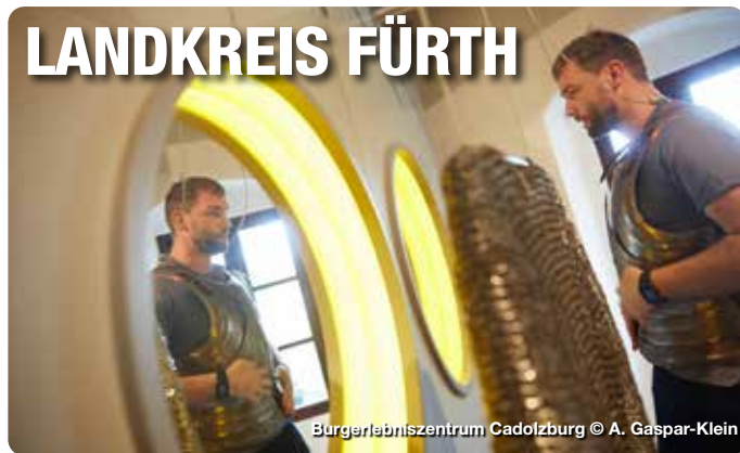
Bürgerleibniszentrum Cadolzburg

Naturlandschaft und Stadtfair – Landkreis Fürth entdecken. Im fränkischen Landkreis Fürth, beim Städtedreieck Nürnberg, Fürth und Erlangen gelegen, gibt es viele Erlebnisse zu entdecken. Auf den zahlreichen Rad- und Wanderwegen durch das bezaubernde Bibertal oder den verträumten Zenngrund lässt sich der Landkreis entdecken. Bei Schlechtwetter können sich Besucherinnen und Besucher den Indoor-Aktivitäten zuwenden. Genieß den Tag mit einem Spaziergang durch die historischen Räume des Faber-Castell Schlosses, mit Erholung in der Palm Beach Saunawelt oder mit einem Abend in den urigen Restaurants der Region. TreffpunktDeutschland.de/fuerth-landkreis