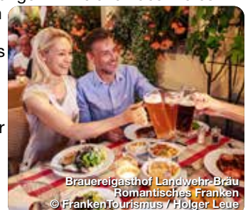
Brauereigasthof Landwehr-Bräu Romantisches Franken

Ob beim Wandern, nach der Radtour oder beim Stadtbummel: Den Durst stillt in Franken ein heimisches Bier. Nirgendwo sonst gibt es eine so große Dichte an Brauereien wie hier. Die zahlreichen Privatbrauereien, Gasthausbrauereien, Kommunbrauereien und Craftbrauer sorgen für eine süffige Vielfalt an unterschiedlichen Biersorten. Die dafür benötigten Zutaten sind ebenso einfach wie regional: Aromahopfen und Braugerste wachsen in Franken direkt vor Ort, das Wasser sprudelt frisch aus den Brunnen der Brauereien. Das fränkische Bier bietet Anlass für viele Reiseerlebnisse: Dazu gehören etwa Braukurse, Biervorkostungen oder sogar Stadtführungen im Zeichen des Bieres. Außerdem lohnt sich ein Besuch in den zahlreichen Bier- und Brauereimuseen. Darüber hinaus verfeinern die fränkischen Brauerzeugnisse viele kulinarische Genüsse, die jetzt im Herbst Hochkonjunktur haben – von der wärmenden Biersuppe über das deftige Schäufele an Dunkelbiersoße bis zum aromatischen Glühbier. www.franken-bierland.de