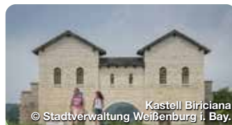
Kastell Biriciana