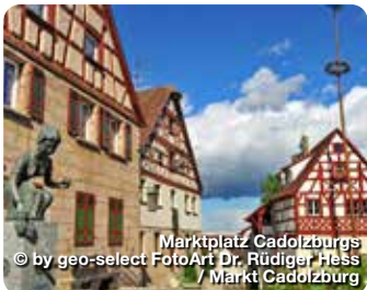
Marktplatz Cadolzburg