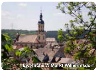
Ev. Kirche