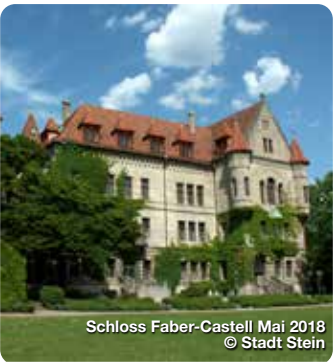
Schloss Faber-Castell Mai 2018