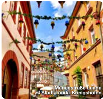
Marienstraße Lauda