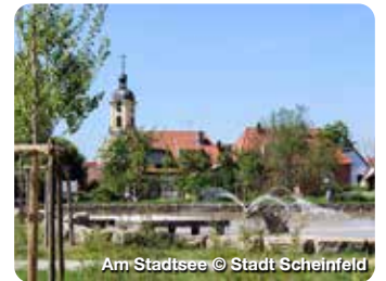
Am Stadisee

Die Lage im Herzen des Naturparks Steigerwald verspricht viel Natur, Idylle, Ruhe und eine herrliche Landschaft. Sie lässt sich am besten per pedes oder mit dem Rad erkunden. TreffpunktDeutschland.de/oberscheinfeld