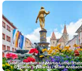
Georgsbrunnen auf Martin-Luther-Platz

Das Wandeln durch Kultur und Geschichte sowie der Genuss kulinarischer Spezialitäten lassen sich in Ansbach hervorragend mit Rad- oder Wandertouren in einer großartigen Naturkulisse verbinden. Versteckte Schätze, wie der Hofgarten mit seinen saisonal bepflanzten bunten Blumenrabatten, Springbrunnen-Geplätscher, schattige Baumalleen sowie der duftende Leonhart-Fuchs-Kräutergarten und der mittelalterliche Behringershof laden, inmitten der Stadt als Orte der Ruhe und Entspannung, ein. Faszinierende Landschaften, einmalige Naturschätze und malerische Ortschaften prägen die Gegend rund um Ansbach. TreffpunktDeutschland.de/ansbach