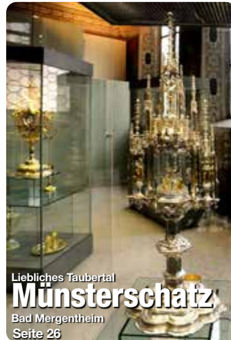
Liebliches Taubertal Münsterschatz Bad Mergentheim Seite 26