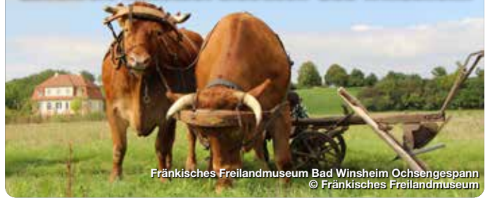
Fränkisches Freilandmuseum Bad Windsheim Ochsengepann

Landkreis Neustadt a.d.Aisch-Bad Windsheim