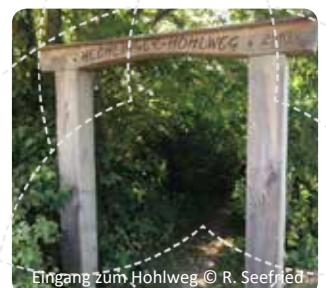
Eingang zum Hohlweg