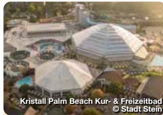
Kristall Palm Beach Kur- & Freizeitbad

Wer an Stein denkt, dem fällt wohl zuerst Faber-Castell ein oder die B14 oder beides. Dabei hat die Stadt, die zwar am südwestlichen Rand Nürnbergs am linken Ufer der Rednitz liegt, aber zum Landkreis Fürth gehört, viel, viel mehr zu bieten. TreffpunktDeutschland.de/rosstal