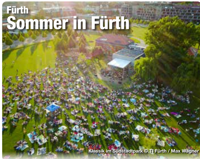
Klassik im Südstadtpark

Wer noch nie oder längere Zeit nicht in Fürth war, wird beim Besuch der Kleeblattstadt ganz schön staunen! An vielen Ecken hat sich das Stadtbild hin zum Positiven entwickelt und lädt mit tollen Plätzen, neuen Geschäften und dem wunderschönen Fürther Markt zum Verweilen ein. Am besten lässt sich die Kleeblattstadt bei einem geführten Stadtspaziergang oder mit einer Lauschtour per App erkunden. Die malerischen Gassen der Altstadt machen Lust auf einen Bummel, vom Rathausurm genießt man bei einer Führung einen grandiosen Ausblick und im Stadtpark entspannt man inmitten von viel Grün. Wussten Sie, dass Fürth auch das „Fränkische Jerusalem“ genannt wurde? Das Jüdische Museum Franken und der Alte Jüdische Friedhof zeugen von diesem Teil der Fürther Stadtgeschichte. Egal ob kulinarisch modern oder fränkisch traditionell – Fürth hat zahlreiche Genussorte vom Grünen Brauhaus in der Comödie Fürth über das stylische Stadtparkcafé bis hin zu Fine Dining in Tim’s Kitchen zu bieten. Zum Glück gibt’s Fürth! TreffpunktDeutschland.de/fuerth