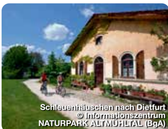
Schleuenhäuschen nach Dietfurt

Notre Dame 1, 85072 Eichstätt, 08421 98760 info@naturpark-altmuehltal.de, www.naturpark-altmuehltal.de