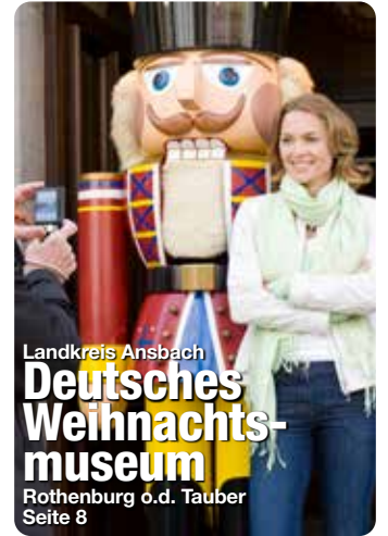
Landkreis Ansbach Deutsches Weihnachtsmuseum Rothenburg o.d. Tauber Seite 8