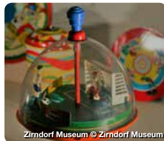
Zirndorf Museum