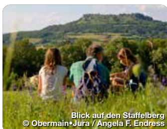
Blick auf den Staffelberg

Pretzfelder Straße 15, 90425 Nürnberg, Tel.: 0911 941510, info@frankentourismus.de, www.frankentourismus.de