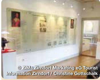
© Zima Zirndorf Marketing eG Tourist Information Zirndorf / Christine Gottschalk