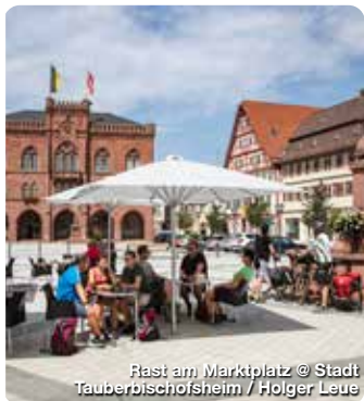
Rast am Marktplatz

Mitten im Herzen des Lieblichen Taubertals an der Romantischen Straße liegt Lauda-Königshofen und bietet für jeden Urlauber genau das Richtige. Die zwölf Stadtteile bestechen durch ein abwechslungsreiches Freizeitangebot mit historischen Sehenswürdigkeiten, familiengeführten Weingütern und zertifizierten Weinhotels, zahlreichen Kulturveranstaltungen und einem gut ausgebauten Rad- und Wanderwegenetz. Taubertäler Gastfreundschaft, edle Weine im bauchigen Bocksbeutel und eine sprichwörtlich liebliche Landschaft – das sind Trümpfe, die stechen. Lauda-Königshofen nennt sich mit berechtigtem Stolz „Weinstadt“ – mit badischem Wein und fränkischer Tradition. TreffpunktDeutschland.de/lauda-koenigshofen