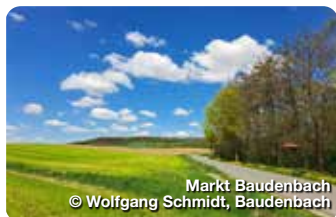
Markt Baudenbach

Uffenheimer Freibad bietet Spaß und Erholung für die ganze Familie! Das Erlebnisbad ist mit einigen Attraktionen ausgestattet: beheizbar, 50-m-Rutsche, Schwallduische und Wasserpilz, Whirl-Liege und Luftblubber, u.v.m. Sportstraße 1, Uffenheim