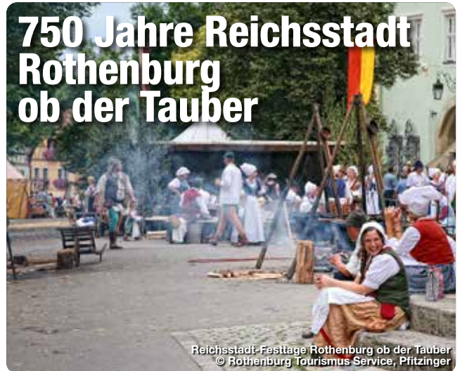
Reichsstadt-Festtage Rothenburg ob der Tauber

Reichsstädte gab es viele im Heiligen Römischen Reich Deutscher Nation: Nürnberg, Regensburg, Basel, Aachen, Utrecht, Hamburg, Zürich oder Straßburg sind prominente Beispiele. Doch in kaum einer anderen Stadt wird die einstige reichsstädtische Unabhängigkeit so gelebt wie in Rothenburg ob der Tauber. Erst 1802 endete dieser souveräne Status im Alten Reich und die Stadt Rothenburg fiel ans Kurfürstentum Bayern.