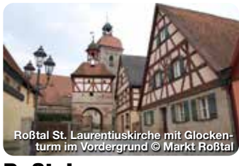
Roßtal St. Laurentiuskirche mit Glockenturm im Vordergrund © Markt Roßtal

Ehem. Augustiner Chorherrenstift Das Kloster wurde 1409 von den Burggrafen von Nürnberg Johann III. und Friedrich VI. gestiftet. Zerstörung im Jahre 1460. Wiederaufbau bis 1468. Prinzregentenplatz 2, Langenzenn