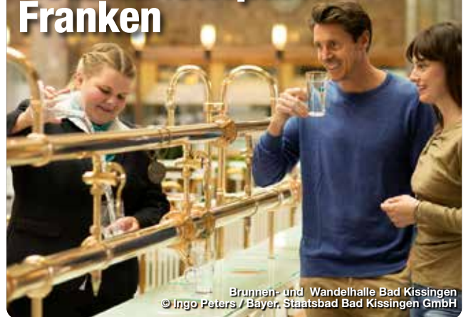
Brunnen- und Wandelhalle Bad Kissingen

Ganz gleich, auf welche Art man Franken für sich entdeckt: Die entspannenden Momente kommen nicht zu kurz. Dafür sorgen die 19 Heilbäder und Kurorte im „Gesundheitspark Franken“. Sie sind – dank innovativer Konzepte und Heilschätzen aus der Natur – wahre Gesundheits- und Wohlfühl-Experten. Zu ihrem Angebot gehören moderne Thermen,