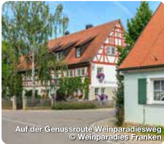
Auf der Genussroute Weinparadiesweg