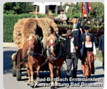
Bad Birnbach Erntedankfest