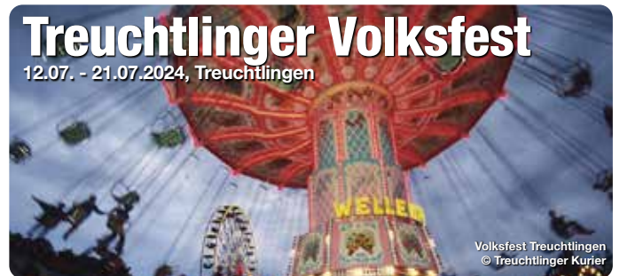
Volksfest Treuchtlingen

Das Treuchtlinger Volksfest ist eines der bekanntesten und beliebtesten Heimatfeste im Naturpark Altmühltal. Zu den Höhepunkten am 2. Volksfestsonntag zählt traditionell der große Festzug, den die Vereine gemeinsam ideenreich gestalten.