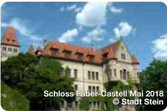
Schloss Faber-Castell Mai 2018

Als eine der ältesten Städte Frankens hat sich Forchheim mit seinen vielen Fachwerkhäusern und der Festungsanlage ein historisches Erscheinungsbild vom Mittelalter bis zum Barock bewahrt. TreffpunktDeutschland.de/forchheim