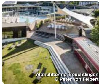
Altmühltherme Treuchtlingen

Quelle purer Lebenslust. Baden und saunieren im wohligen warmen, 18.000 Jahre alten, zertifizierten und staatlich anerkannten Heilwasser nach balneologischen Grundsätzen. Bürgermeister-Döbler-Allee 12, Treuchtlingen