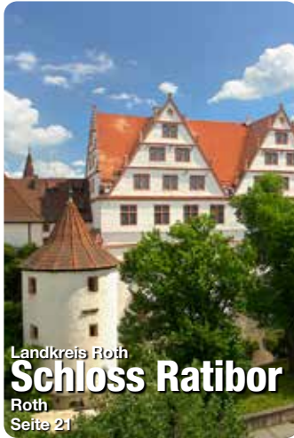
Landkreis Roth Schloss Ratibor Roth Seite 21

Auf diese Frage versuchen wir Ihnen in diesem Reisemagazin WILLKOMMEN IN DER REGION ANSBACH eine Antwort zu geben. Zuerst stellen wir Ihnen den Hotspot-Ort Ansbach und den dazugehörigen Landkreis vor. Danach folgen die angrenzenden Landkreise mit ihren Orten, Sehenswürdigkeiten und Event-Highlights. Abschließend gibt es noch Tipps für Ihren nächsten Urlaub.