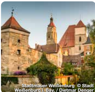
Stadtmauer Weissenburg

Quelle purer Lebenslust. Baden und saunieren im wohligen warmen, 18.000 Jahre alten, zertifizierten und staatlich anerkannten Heilwasser nach balneologischen Grundsätzen. Bürgermeister-Döbler-Allee 12, Treuchtlingen