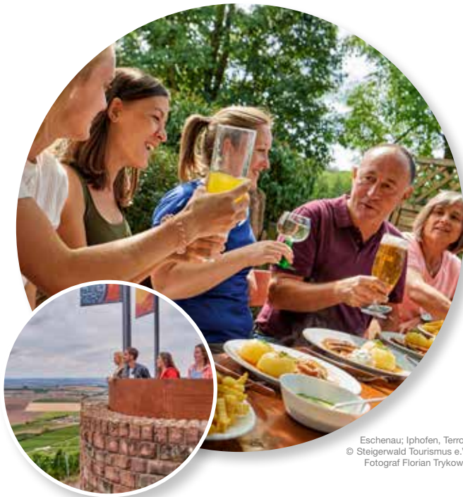
Eschenau; Iphofen, Terroir f