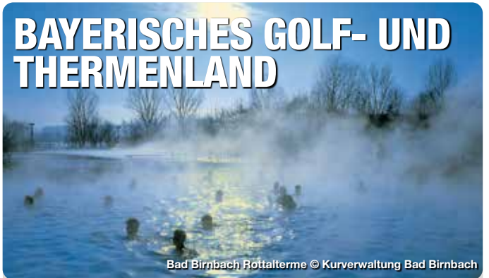
Bad Birnbach Rottaltherme

Das Kur- & Freizeitbad bietet eine Vielzahl von nassen Freizeitmöglichkeiten. Spaß und Action gibt es im Erlebnisbad und der Rutschenwelt. Entspannung und Erholung im Sauna und Wellnessbereich. Albertus-Magnus-Straße 29, Stein