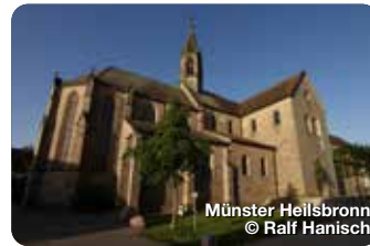
Münster Heilsbronn © Ralf Hanisch