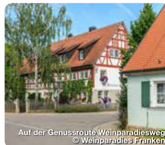
Auf der Genussroute Weinparadiesweg

Es grüßt Sie eine geschichtsträchtige Gemeinde im Naturpark Frankenhöhe mit 210 km markierten Wanderwegen in waldreicher Umgebung. TreffpunktDeutschland.de/markt-erlbach