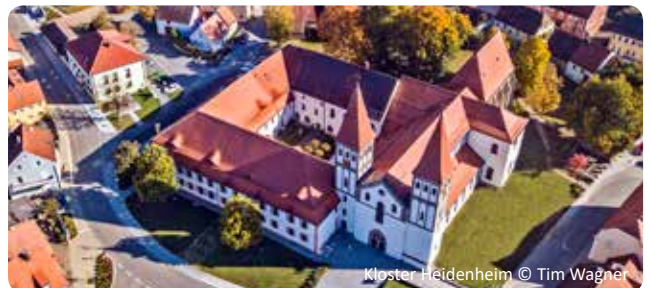
Kloster Heidenheim