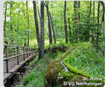
St. Rinne