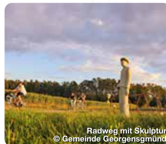
Radweg mit Skulptur