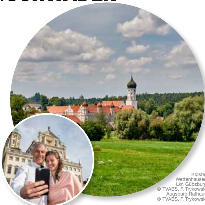
Kloster Wettenhausen Lkr. Güzburg © TVABS, F. Trykowski Augsburg Rathaus © TVABS, F. Trykowski