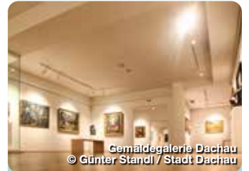
Gemäldegalerie Dachau