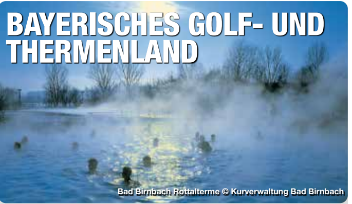
Bad Birnbach Röttalterme

Die Therme empfängt Badegäste in der Wasservelt mit einer großen zusammenhängenden Wasserfläche mit vielen Attraktionen, einer Poolbar, Außenbecken und Sonnenliegewiese. Die Saunalandschaft mit neun Erlebnis- und Themensaunen, einer Schneekammer, Saunagarten mit Thermalwasser-Außenbecken und Ruhebereichen lädt zum Schwitzen und Entspannen ein. Einzigartig ist das Herz des Siebenquell: die GesundZeitReise. Hier spüren Gäste in sieben wunderschönen Badelandschaften alter Kulturen die gesundheitsfördernde Wirkung verschiedener Mineralien. Verwöhn- oder Gesundheitsanwendungen im Medical SPA versprechen eine Extraportion Wellness. Thermalallee 1, Weissenstadt