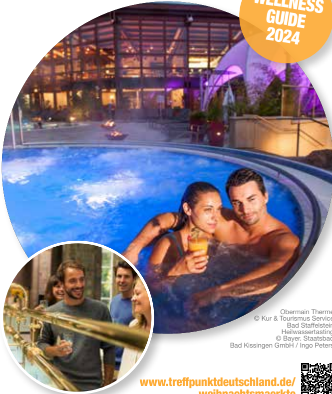
Obermain Therme Heilwassertasting

www.treffpunktdeutschland.de/ weihnachtsmaerkte