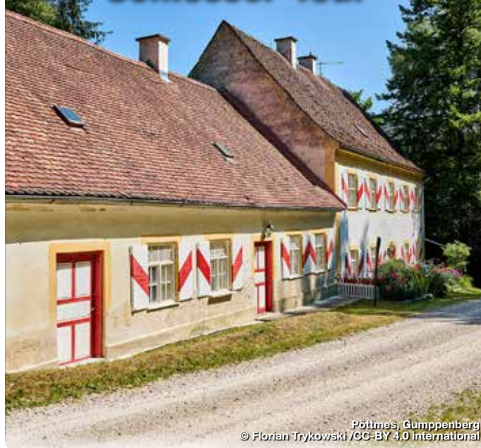
Pöttmes, Gumpenberg

Entlang der Rundwanderung um und durch Pöttmes liegen drei Schlösser, von denen heute nur noch das Schloss in Pöttmes selbst und das Schloss Schorn erhalten sind. Die „Drei Schlösser-Tour“ führt durch eine Allee hinauf zum Gumpenberg. Die hügelige Landschaft am Rande des Donaumooses bietet immer wieder herrliche Ausblicke. Der Wanderweg führt anschließend ein Stück durch den Laubwald und am Schorner Weiher vorbei zurück nach Pöttmes. Der westliche Torturm in Pöttmes, der durchgängig mit einem Weißstorchennest belegt ist, ist ein weiteres Highlight der Wanderung.