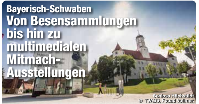
Schloss Höchstädt © TVABS, Fouad Vollmer.

Interessante Geschichte, außergewöhnliche Sammlerstücke und beeindruckende Naturwunder – in Bayerisch-Schwaben spiegelt sich die Vielfalt der Region im Angebot abwechslungsreicher, interaktiver und besonderer Museen wider. So erfahren Besucher Wissenswertes und Erstaunliches über Land und Leute aus vergangenen Zeiten und der Gegenwart. Die kuriose Besenwelt in Günzburg zeigt etwa eine außergewöhnliche Privatsammlung mit über 400 handgemachten Besen in verschiedensten Formen, Farben und Materialien aus aller Welt. Im einzigen Ballonmuseum Europas in Gersthofen erfahren Interessierte auf drei Ebenen an interaktiven Stationen die Geschichte der Ballonfahrt und bekommen im begehbaren Korb schon einmal ein Gefühl für dieses besondere Fortbewegungsmittel. Im RiesKraterMuseum in Nördlingen gehen Gäste auf multimediale Weise dem Meteoriteneinschlag vor 14,5 Millionen Jahren auf den Grund und besichtigen ein echtes Stück Mondgestein. Das Edwin Scharff Kindermuseum in Neu-Ulm hingegen begeistert Groß & Klein mit jährlich wechselnden Themen zu unterschiedlichen Wissensgebieten vom Thema „Körper“ bis hin zur Globalisierung. Verschiedene Themenwelten wie beispielsweise das Fugger und Welsler Erlebnismuseum oder das Staatliche Textil- und Industriemuseum Augsburg (tim) nehmen Interessierte mit in die spannende Geschichte der Region. TreffpunktDeutschland.de/bayerisch-schwaben