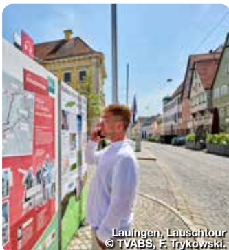
Lauingen, Lauschtour © TVABS, F. Trykowski.

Schießgrabenstr. 14, 86150 Augsburg, Tel.: 0821 45040110, info@tvabs.de, www.bayerisch-schwaben.de