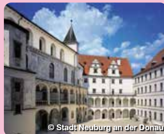
© Stadt Neuburg an der Donau