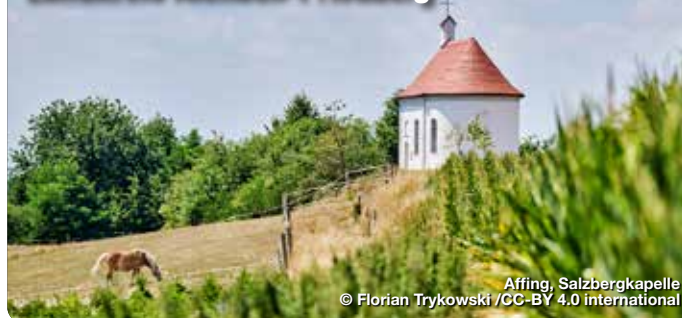
Affing, Salzbergkapelle

Der Wiege Altbayerns. Das „Wittelsbacher Land“, so nennt sich der Landkreis Aichach-Friedberg, verdankt seinen Namensgeber eine reichhaltige Geschichte. Die 1209 zerstörte „Burg Wittelsbach“ ist der ehemalige Stammsitz der Wittelsbacher – und auch wenn heute von der ehemaligen Burg nur noch Mauerreste übrig sind, so verweisen doch viele andere Sehenswürdigkeiten auf dieses Herrschergeschlecht. Die beiden charmanten Herzogstädte Aichach und Friedberg, prachtvolle Schlösser oder barocke Wallfahrtskirchen laden Dich herzlich zu einem Besuch ein. Zugleich bietet die malerische Landschaft die perfekte Umgebung für eine Freizeitaktivitäten wie etwa Wandern, Radfahren oder Familienausflüge. TreffpunktDeutschland.de/wittelsbacher-land