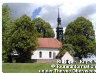
St. Rupert-Kapelle

Längst gilt die Therme als mehrfach ausgezeichnete „Perle“ der Fränkischen Schweiz. Das mineralhaltige Thermalwasser kommt aus Urtiefen des Juragesteins. Das Wasser belebt und entspannt zugleich. An der Therme 1, Mistelgau-Obersees