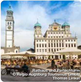
Rathaus und Perlachturm