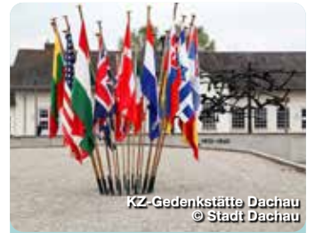
KZ-Gedenkstätte Dachau