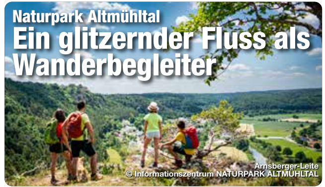
Arnsberger Leite

Den Qualitätswanderweg „Altmühltal-Panoramaweg“ im eigenen Tempo entdecken. Aus dem lichten Wald heraus führt der weiche Pfad auf die nach Kräutern duftende Wacholderheide. Von einem freiliegenden Felsen aus bietet sich ein Panoramablick über das Tal mit dem glitzernden Fluss. Eine sanfte Brise streichelt die Haut und trägt das Blöken einer Schafferde mit sich, die ein Stück entfernt zwischen den Wacholderbüschen grast. In der Ferne versprechen die Dächer und Kirchturmspitzen eines historischen Städtchens die Gelegenheit zu einer Einkehr: Eine Wanderung