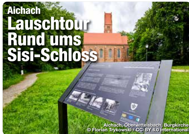
Aichach, Oberwittelsbach, Burgkirche

Wandern mit Audio-Guide - Sprecher aus der Region erzählen auf dieser Lauschtour, Wissenswertes über Sisi und den Clan der Wittelsbacher! Die Tour führt rund um das Wasserschloss Unterwittelsbach, in dem „Sisi“, die spätere Kaiserin von Österreich, Teile ihrer Kindheit verbracht haben soll. Das Schloss und die sehenswerte neugotisch-orientalische Schlosskapelle sind umgeben von einem traumhaften Park mit Weibern und alten Bäumen. Auch, die Burg Wittelsbach, der ehemalige Stammsitz