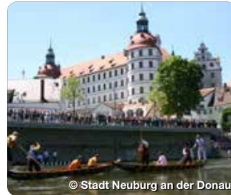
© Stadt Neuburg an der Donau

Links neben der Hofkirche befindet sich das architektonisch interessante Rathaus (1603/09) mit seiner mächtigen zweiläufigen Freitreppe. Als Vorbild diente der Senatspalast auf dem Capitol in Rom. Karlsplatz, Neuburg a.d.D.