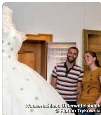
Wasserschloss Unterwittelsbach

Die Lauschtour kann via App kostenlos auf's eigene Smartphone geladen werden. Dort ist übrigens auch noch eine weitere Tour, „Stadtrundgang in Friedberg“, zu finden. Wer die Geschichte der Wittelsbacher lieber „erfahren“ möchte, kann dies mit der „Sisi-Tour“ im wortwörtlichen Sinne.