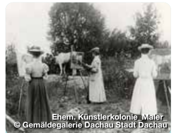
Ehem. Künstlerkolonie Maler.