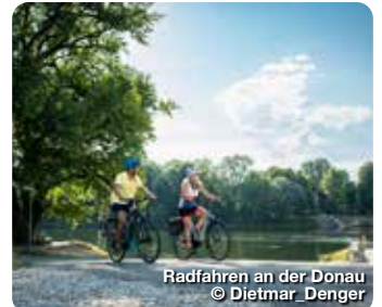
Radfahren an der Donau