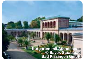
Kurgarten mit Arkadenbau