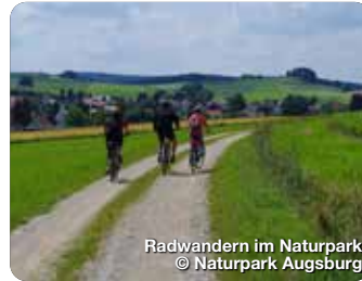
Radwandern im Naturpark

TreffpunktDeutschland.de/augsburger-land