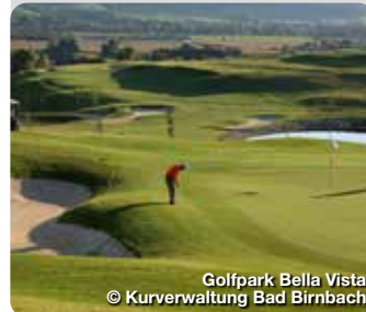
Golfpark Bella Vista

In den Heil- und Thermalbädern Bad Füssing, Bad Griesbach, Bad Birnbach, Bad Gögging und Bad Abbach findet man die richtige Balance zwischen Gesundheit, Entspannung und ganzheitlichem Vital- und Aktivurlaub. Das niederbayerische Umland zeichnet sich durch die höchste Golfplatzdichte Deutschlands aus, mit der Gemeinde Bad Griesbach als dem größten zusammenhängenden Golf-Resort Europas. Die abwechslungsreiche Region bietet als ideale Ergänzung dazu geschichtsträchtige Einblicke in das Herz alter Dom- und Herzogstädte wie Passau, Landshut, Straubing, Dingolfing und Landau. Sie verbinden überliefertes Kulturgut mühelos mit zeitgenössischer Lebensart. TreffpunktDeutschland.de/bayerisches-golf-thermenland