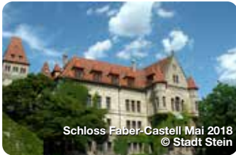
Schloss Faber-Castell Mai 2018