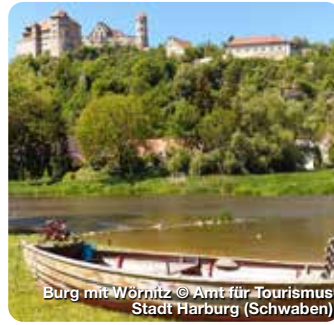
Burg mit Würnitz