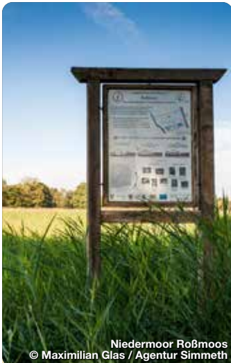
Niedermoor Roßmoos

Der Soccerpark Rehling bei Scherneck erstreckt sich über 18 Bahnen und fügt sich harmonisch in die umliegende Landschaft ein. Wer schafft es, den Ball mit möglichst wenigen Schüssen durch Hindernisse ins Ziel zu befördern? Auer Bergstraße, Rehling