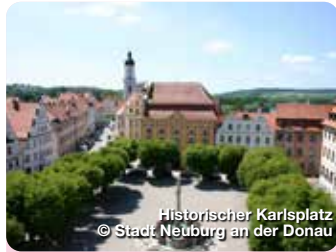
Historischer Karlsplatz