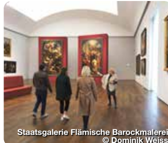
Staatsgalerie Flämische Barockmalerei

TreffpunktDeutschland.de/neuburg-an-der-donau