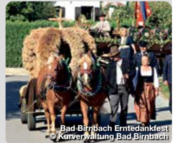
Bad Birnbach Erntedankfest