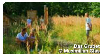
Das Grubet

Das im Aichacher Stadtteil Unterwittelsbach gelegene Wasserschloss bezaubert Besucherinnen und Besucher durch seine malerische Lage im Schlosspark mit Weiher. Kaiserin Elisabeth von Österreich soll hier Teile ihrer Kindheit verbracht haben, weshalb das Schloss im Volksmund auch „Sisi-Schloss“ genannt wird. Rund um das Wasserschloss Unterwittelsbach führt ein Wanderweg, eine Lauschtour sowie eine Radtour entlang. Die Stadt Aichach lädt mit vielen Angeboten wie Sisi-Ausstellungen, Lesungen, Konzerte, etc. ins Schloss und in den Schlosspark ein. Klausenweg 1, Aichach