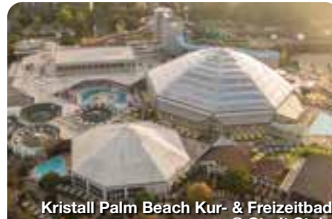
Kristall Palm Beach Kur- & Freizeitbad

Wer an Stein denkt, dem fällt wohl zuerst Faber-Castell ein oder die B14 oder beides. Dabei hat die Stadt, die zwar am südwestlichen Rand Nürnbergs am linken Ufer der Rednitz liegt, aber zum Landkreis Fürth gehört, viel, viel mehr zu bieten. TreffpunktDeutschland.de/rosstal