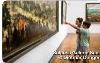
Schloss Galerie Saal

Umsäumt von 200-jährigen Linden sowie stattlichen Adels- und Bürgerhäusern aus Renaissance und Barock zählt die Platzanlage zu den schönsten des süddeutschen Barock. Karlsplatz, Neuburg a.d. Donau