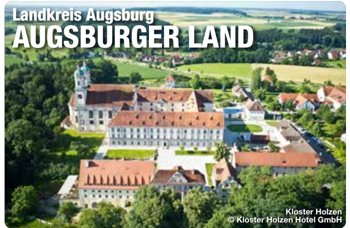
Kloster Holzen

Das Augsburgs Land. Mit seiner reichen Geschichte, seiner vielfältigen Kultur und Landschaft ist das Augsburgs Land ein attraktives Ziel für ein paar Tage Entspannung. Der Naturpark Augsburg - Westliche Wälder ist die grüne Lunge und lädt zum Naturerlebnis und zur Entschleunigung ein. Die Flüsse Lech und Wertach prägen die Landschaft und bieten zahlreiche Möglichkeiten zum Wandern und Radfahren. Ein vielseitiges Kulturangebot und Freizeitspaß sowie familienfreundliche Angebote und Aktivitäten bei abwechslungsreichen Ausflugszielen bieten ein Urlaubsfeeling im Grünen – ganz ohne Trubel.