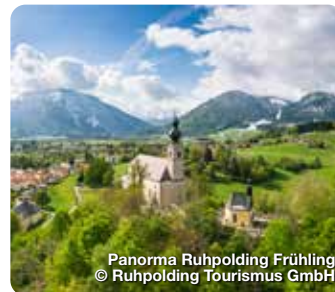
Panorama Ruhpolding Frühling

„Zeit für Dich. Raum für Deine Träume.“ Mit diesem Slogan wirbt das Fürthermare in Fürth um seine Gäste. Raum für Träume gibt es tatsächlich mehr als genug, Badespaß nicht minder. Wenn in der warmen Jahreszeit das Sommerbad öffnet und damit das Angebot der Erlebnistherme mit ihren vielen Facetten erweitert, dann stehen den Besuchern sogar mehr als 4.000 Quadratmeter Wasserfläche zur Verfügung. Zuletzt wurden im März 2022 die neue „Hacienda los Sueños“, ein großzügiges Ruhehaus im mallorquinischen Stil, sowie die Eventaufguss-Sauna „Casa Grande“ mit bis zu 100 Plätzen eingeweiht. Scherbsgraben 15, Fürth