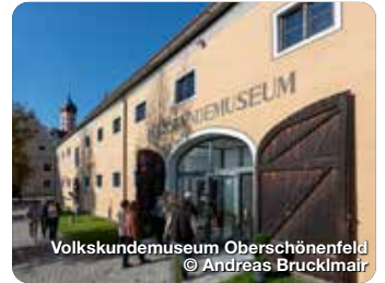
Volkskundemuseum Oberschönenfeld