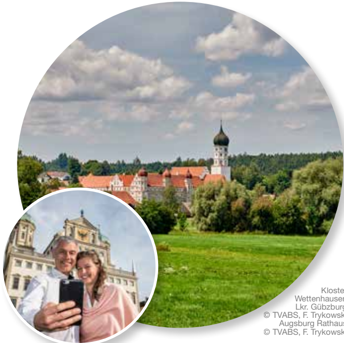
Kloster Wettenhausen Lkr. Güzburg © TVABS, F. Trykowski Augsburg Rathaus © TVABS, F. Trykowski