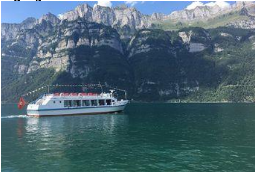
Ausflugs-Option am Sonntag: Schifffahrt, ...