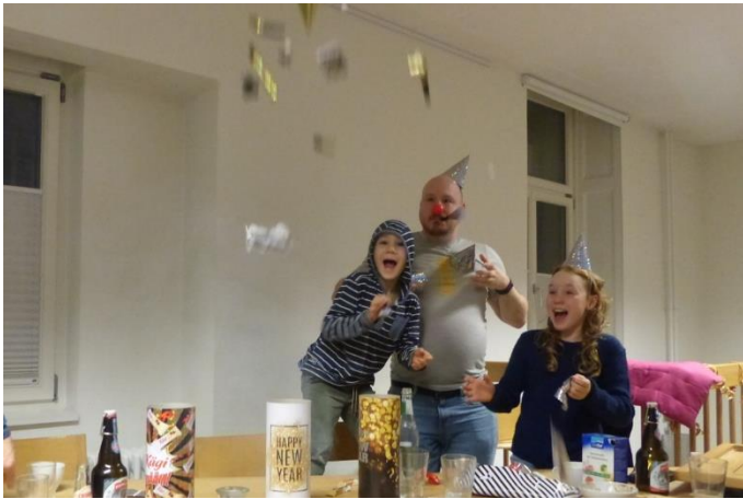
Der Moment, wenn die Tischbombe hochgeht: Freude herrscht an der Silvesterfeier in Basel.

Jahreswechsel in Basel und im Jura. Am Silvesterabend trafen sich zwei Dutzend IOGT-Mitglieder und -Freunde aus der Nordwestschweiz und Norwegen im Treffpunkt Metzgerstrasse 16 in Basel zur gemeinsamen