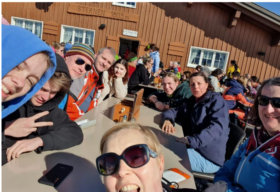
Fröhliche Runde am höchsten Punkt des Gebiets Hoch-Ybrig (Sternen, 1'803 m).

Wer nicht Ski fuhr, vertrieb sich die Zeit bei frühlingshaften Bedingungen mit Spaziergängen oder ausgewachsenen Wandertouren, mit Ausflügen nach Einsiedeln, Klosterführungen daselbst oder sogar mit Tagesausflügen an oder auf den Zürichsee.