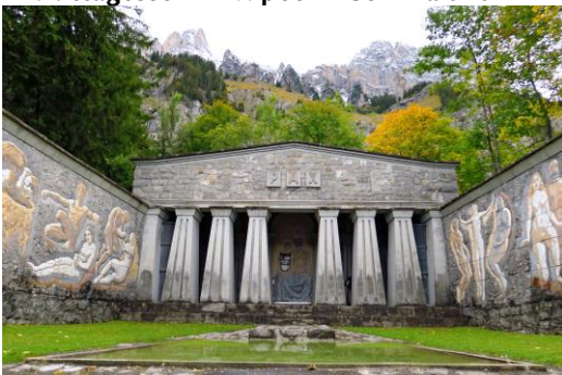
... Besichtigung des berühmten pazifistischen Gesamtkunstwerks «Paxmal» von Karl Bickel.