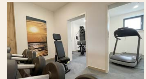
Fitnessbereich im Seehotel