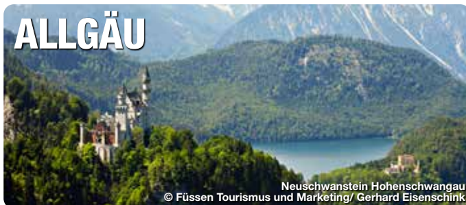
Neuschwanstein Hohenschwangau

Das Allgäu überrascht: gelebte Traditionen, frische Kulturalität, die authentische und bodenständige Küche. Gemeinsam ist allen die hohe Qualität der Angebote. Ob Gastgeber, Restaurant oder die Qualität der Wege. Überzeugen Sie sich selbst.