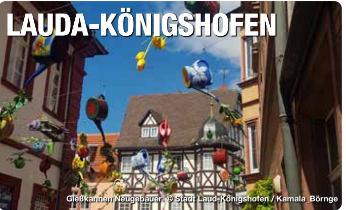
Gießkannen Neugebauer

Die Weinstadt im Lieblichen Taubertal an der Romantischen Straße. Herrliche Weinberge, die idyllische Tauberaue und naturbelassene Wälder formen das Landschaftsbild der Stadt. Spuren von Mittelalter, Bauernkrieg, Gotik und Barock prägen Lauda-Königshofen und bieten mit Fachwerkhäusern, uralten Tauberbrücken mit Heiligenstatuen, Bildstöcken und Kirchen mit einzigartigen Kleinodien eine prächtige Kulisse. Taubertäler Gastfreundschaft, edle Weine im originellen bauchigen Bocksbeutel und eine sprichwörtlich liebeliche Landschaft – das sind Trümpfe, die stechen. Lauda-Königshofen nennt sich mit berechtigtem Stolz „Weinstadt“ - mit badischem Wein und fränkischer Tradition. TreffpunktDeutschland.de/lauda-koenigshofen