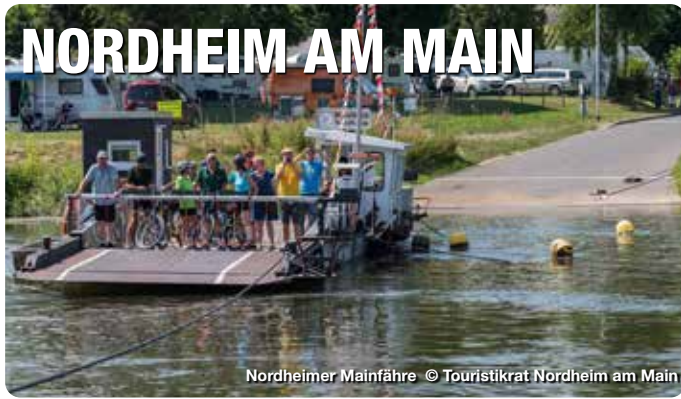
Nordheimer Mainfähre

Mit rund 450 Hektar Rebfläche ist Nordheim am Main die größte Weinbaugemeinde in Franken und mit über 1.100 Jahren Weinbautradition seit jeher ein Mekka für Weinfreunde. Vögelein und Kreuzberg heißen die weithin bekannten Weinlagen, überwiegend mit den klassischen fränkischen Rebsorten Silvaner und Müller-Thurgau bepflanzt. Aber auch neue junge Sorten und Rotweinreben fühlen sich im Klima der Mainschleife wohl. Mehr als 30 selbstvermarktende Weingüter, die Winzergenossenschaft DIVINO Nordheim-Thüngersheim mit ihren über 280 Mitgliedsbetrieben und zahlreiche Edelobstbrenner machen den Gästen ihre Produkte schmackhaft.