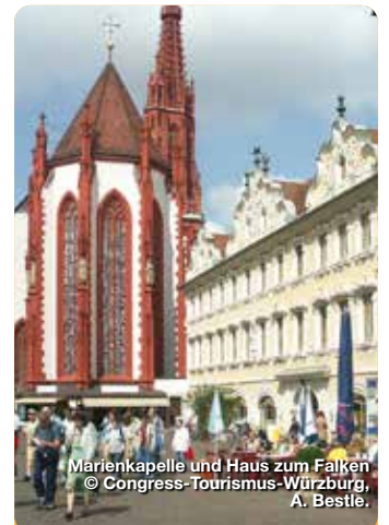
Marienkapelle und Haus zum Falken

Das Mainfranken Theater Würzburg ist die größte und bekannteste Kulturinstitution in der Regiopole Mainfranken. Das Mehrspartenhaus kann auf eine über 200-jährige Historie zurückblicken und steht für künstlerische Qualität und kreative Vielfalt. Seit 2018 wird das Theater bei laufendem Spielbetrieb saniert. 2022 soll das neue Kleine Haus eröffnet werden. Die neue zusätzliche Spielstätte im Neubau bietet 330 Sitzplätze die gläserne Fassade offen zur Stadt. Theaterstraße 21, Würzburg