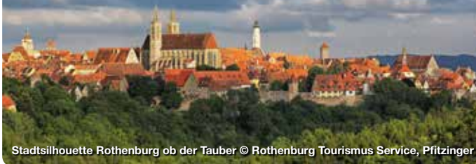
Stadtsilhouette Rothenburg ob der Tauber

Die Stadt Rothenburg ob der Tauber in Mittelfranken ist weit über die Grenzen der Bundesrepublik bekannt, als der Inbegriff des mittelalterlichen romantischen Deutschlands. Die Stadtmauer, die auf über drei Kilometern die Altstadt umschließt, der historische Stadtkern, mit seinen unzähligen Fachwerkhäusern, und die Lage der Stadt über dem Taubertal begeistern Besucher aus der ganzen Welt – und machen Rothenburg ob der Tauber somit zu einem Ort der Begegnungen. Hinter den Mauern der pittoresken Häuser verstecken sich idyllische Privatgärten, die Besuchern im Rahmen von Führungen offenstehen.