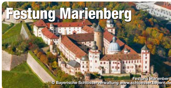
Festung Marienberg

Die Festung Marienberg ist das weithin sichtbare Wahrzeichen der Stadt Würzburg. Die mächtige Anlage, die von 1253 - 1719 Sitz der Fürstbischöfe war, liegt auf einem sich gut einhundert Meter über das Maintal erhebenden Höhenrücken, den auf drei Seiten steil abfallende Hänge umgeben. Diese günstige Lage führte zur Entstehung einer befestigten Fliehburg auf der Anhöhe (um 1000 v. Chr.). Der älteste, im Kern noch existierende Bau dürfte die 706 geweihte Rundkirche im inneren Burghof sein. Der Ursprung der im Lauf der Jahrhunderte immer wieder erweiterten, umgebauten, durch Kriege und Brände häufig zerstörten Festung fällt in das Jahr 1201, als Bischof Konrad von Querfurt nach Auseinandersetzungen zwischen Königtum und Kirche den strategisch günstig gelegenen Berg mit einer trutzigen Burg befestigte. Marienberg, Würzburg