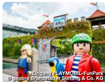
Eingang PLAYMOBIL-FunPark