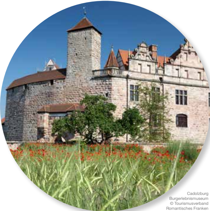
Cadolzburg Burgerlebnismuseum