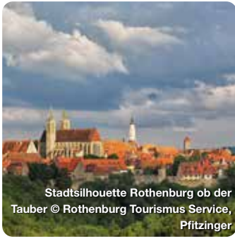
Stadtsilhouette Rothenburg ob der Tauber