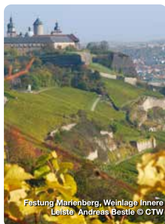
Festung Marienberg, Weinlage Innere Leiste Andreas Bestle © CTW