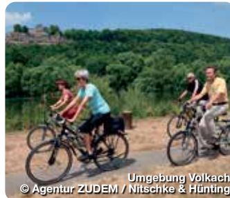
Umgebung Volkach

Willkommen im Herzen des Fränkischen Weinlands, an der Volkacher Mainschleife! Erleben Sie Volkach als historisch, kulinarisch und kulturell attraktives Ausflugsziel zwischen Würzburg und Bamberg. Die Weinstadt ist das Zentrum der Mainschleife und hat eine über 1.100jährige Ortsgeschichte, ganz im Zeichen des Frankenweins, vorzuweisen. Rund ein Viertel der fränkischen Rebfläche werden an der Mainschleife bewirtschaftet. Vier Winzergenossenschaften und über 150 selbstvermarktende Winzer sind hier im Umkreis von 15 Kilometern beheimatet. Die Mainschleife ist das größte zusammenhängende Weinanbauggebiet in Franken. TreffpunktDeutschland.de/volkach