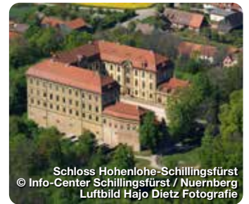
Schloss Hohenlohe-Schillingsfürst