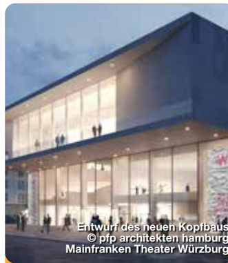
Entwurf des neuen Kopfbaus © pfp architekten hamburg Mainfranken Theater Würzburg