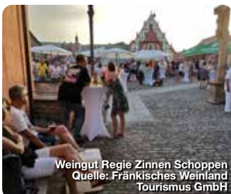
Weingut Regie Zinnen Schoppen

Fränkisches Weinland Tourismus GmbH Turmgasse 11, 97070 Würzburg www.fraenkisches-weinland.de