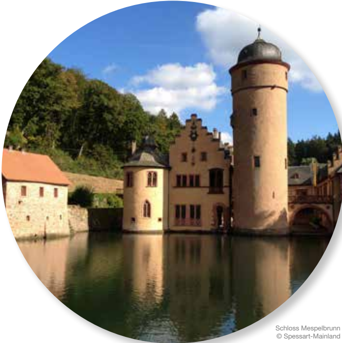
Schloss Mespelbrunn