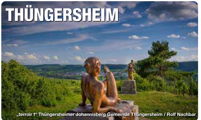
„terroir f“ Thüngersheimer Johannisberg Gemeinde Thüngersheim / Rolf Nachbar

Zellingen und Retzbach schmiegen sich, mainabwärts von Würzburg, rechts- und linksseitig romantisch ans Ufer des Mains. Die beiden Ortsteile sind durch die Alte Mainbrücke, eine Fußgänger- und Radfahrbrücke, verbunden. Der Markt Zellingen ist vor allem durch den Ortsteil Retzbach mit seiner Wallfahrtskirche „Maria im Grünen Tal“ und der Weinlage „Retzbacher Benediktusberg“ bekannt. Aktive sowie Erholungssuchende kommen bei uns gleichermaßen auf ihre Kosten. Eine Vielzahl gut ausgeschilderter Wander-, Rad- und Laufwege erschließen das idyllische Maintal und seine romantischen Seitentäler. Die zentrale Lage unserer Gemeinde bietet zudem beste Ausgangsmöglichkeiten für Radtouren, Wanderungen und Ausflüge in die nähere Umgebung. TreffpunktDeutschland.de/zellingen