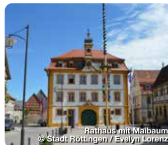
Rathaus mit Malbaum

An der Romantischen Straße, im fränkischen Weinland, im Lieblichen Taubertal, liegt die schöne Stadt Röttingen. Das barocke Rathaus, mit seinen zwei kunstvollen Drachenspeichern, und die Fachwerkhäuser umschließen den Marktplatz. Ein Brunnen erinnert hier an die Proklamation zur ersten Europastadt. Einzigartig der Sonnenuhrenweg. Um die historische Altstadt verläuft die Stadtmauer mit sieben noch erhaltenen Türmen. Sehenswert ist die romanische Pfarrkirche St. Kilian (13. Jh., in der Außenfassade sind Epitaphe erhalten), die Kapelle St. Georg (1588) und das Käppele (1766). Die Spitalkirche St. Peter und Paul wurde in den Jahren 1613 bis 1615 erbaut. TreffpunktDeutschland.de/roettingen