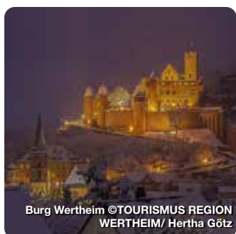
Burg Wertheim