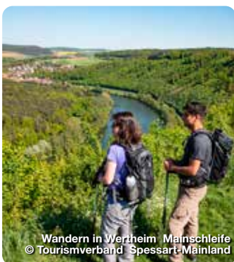
Wandern in Wertheim Mainschleife

Industriering 7, 63868 Großwallstadt, Tel: 06022/26 1020 info@spessart-mainland.de, www.spessart-mainland.de