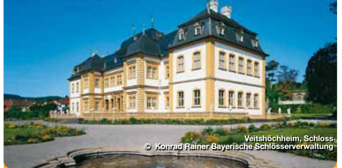
Veitshöchheim, Schloss

Der 1680 bis 1682 erbaute Sommersitz der Würzburger Fürstbischöfe wurde 1753 durch Balthasar Neumann vergrößert. 1806 bis 1814 war das Schloss in den Sommermonaten von Großherzog Ferdinand von Toskana bewohnt, der in dieser Zeit in Würzburg residierte. Seit 1814 ist das Schloss im Besitz der Bayerischen Krone und wurde im 19. Jahrhundert von der königlichen Familie ebenfalls als Sommerschloss genutzt. Erst durch die Restaurierung von 1931/32 wurden alle Räume des Obergeschosses wieder als historische Schauräume ausgestattet und der Öffentlichkeit als Museum geöffnet. Echterstrasse 10, Veitshöchheim