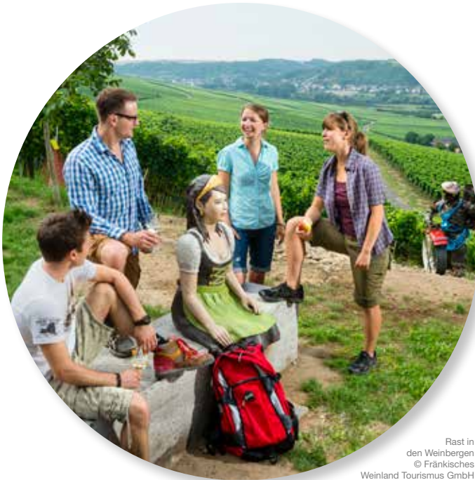
Rast in den Weinbergen