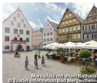
Marktplatz mit altem Rathaus