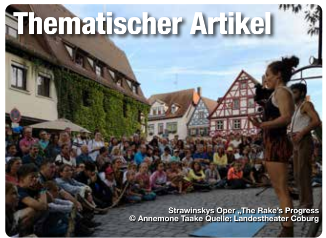
Strawinskys Oper „The Rake's Progress“

Röttingen ist die Stadt der Sonnenuhren und dementsprechend viel gibt es auf dem Röttinger Sonnenuhrenweg zu sehen. 25 verschiedene Sonnenuhren liegen auf dem 2km langen Rundweg innerhalb und um die Stadtmauer. Der Sonnenuhrenweg lädt besonders an sonnigen Tagen dazu ein, die verschiedenen Uhren zu betrachten und die Zeiten abzulesen, aber auch an bedeckten Tagen ist es interessant die unterschiedlichen Bauweisen der einzigartigen Sonnenuhren zu erkunden. Sonnenuhrenweg, Röttingen