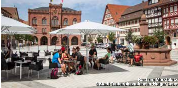
Rast am Marktplatz

Der Marktplatz mit dem neugotischen Rathaus bildet das Zentrum der Ferienstadt Tauberbischofsheim. Ob Glockenspiel, Marktveranstaltungen oder Feste – Urlauber und Einheimische halten sich gerne auf der neu gestalteten Fläche auf und genießen die Atmosphäre. Von hier aus lassen sich Stadtrundgänge wie zur Stadtkirche St. Martin, dem Schlossplatz mit dem Kurmainzischen Schloss sowie durch die verwinkelten Gassen der Altstadt unternehmen. Die neu sanierte Fußgängerzone lädt zum Flanieren und Bummeln geradezu ein. Die örtliche Gastronomie bietet gemütliche Rastmöglichkeiten.