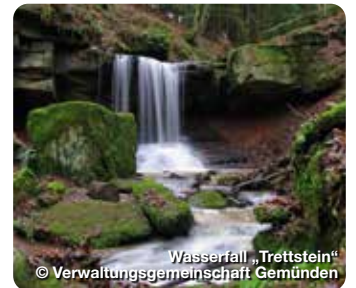
Wasserfall „Trettstein“