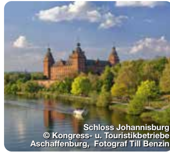
Schloss Johannisburg