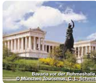
Bavaria vor der Ruhmeshalle