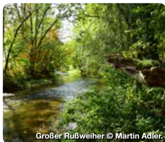
Großer Rußweiher © Martin Adler.

Eingebettet in Weinberge liegt Weikersheim, mit einem der bedeutendsten Renaissance-Schlösser Deutschlands und seinem prächtigen Schlossgarten, inmitten des Lieblichen Taubertals. Für Radfahrer und Wanderer ist die Stadt, mit ihrem bestens ausgebauten Radwegnetz und Wanderwegen, ein idealer Ausgangspunkt. Aber auch Kunst und Kultur kommen nicht zu kurz: In der Konzerthalle Tauber Philharmonie wird ein hochkarätiges Programm angeboten. Skulpturen- und Foto.SCHAU geben den Besuchern die Möglichkeit Kunst im öffentlichen Raum im historischen Ambiente zu betrachten. Ideal für eine Auszeit aus dem Alltag. Treffpunkt Deutschland.de/weikersheim