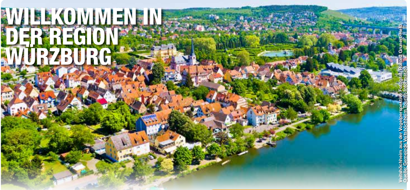
Veitshöchheim aus der Vogelperspektive.