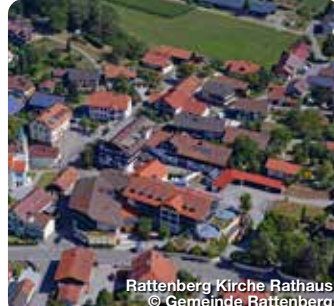
Rattenberg Kirche Rathaus

Ob Aktivurlaub oder Familienabenteuer – Deggendorf ist zu jeder Jahreszeit ein Erlebnis. Mit einem Höhenunterschied von 800 Metern innerhalb des Stadtgebiets ist Deggendorf bekannt als die „Stadt mit den zwei Jahreszeiten“. Bestaunen Sie unsere Stadtgeschichte hautnah im Stadtmuseum, genießen Sie einzigartigen Badespaß mit Ihren Lieben im nahegelegenen Ganzjahresbad oder erkundigen Sie aktiv auf sportliche Weise die wunderschöne Donaustadt. Denn hier ist sowohl für Langläufer, Wanderer als auch Mountainbiker ganzjährig so einiges geboten. Ob Isarradweg, Donauradweg oder unser weitläufiges Wanderwegenetz „Rusel-Oberbreitenau“ – in Deggendorf kommt jeder Gast auf seine Kosten. TreffpunktDeutschland.de/deggendorf