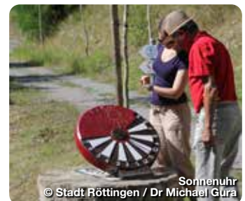
Sonnenuhr