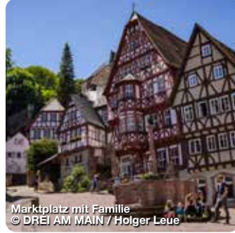
Marktplatz mit Familie

TreffpunktDeutschland.de/ marktheidenfeld