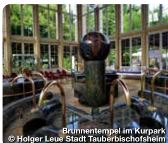
Brunnentempel im Kurpark © Holger Leue Stadt Tauberbischofsheim

TreffpunktDeutschland.de/bad-mergentheim