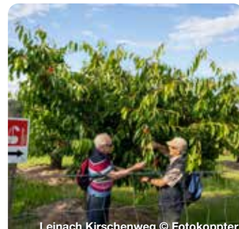
Leinach Kirschenweg