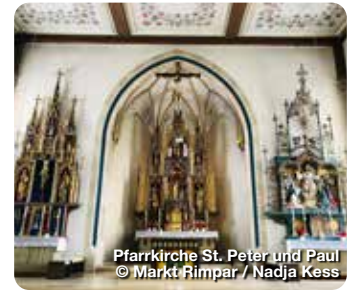
Pfarrkirche St. Peter und Paul