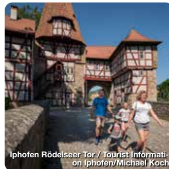
Iphofen Rödelseer Tor / Tourist Information Iphofen/Michael Koch