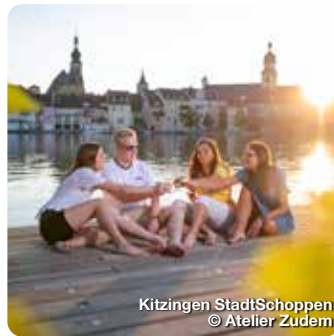
Kitzingen StadtSchoppen © Atelier Zudern