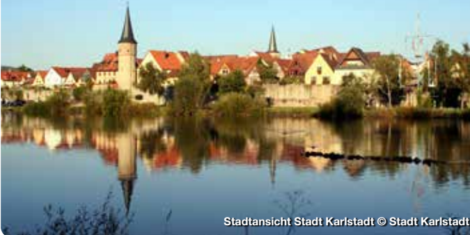
Stadtansicht Stadt Karlstadt

Hinter einer der schönsten Ortssilhouetten entlang des Mains öffnet sich dem Besucher eine Stadt von besonderem Reiz. Die behutsame, aber eindrucksvolle Erneuerung, der „am Reißbrett“ geplanten, Altstadt zieht Besucher in ihren Bann. Kein Wunder, denn nahezu unverändert hat sich der Mustergrundriss der Stadt erhalten, deren Glanzpunkte die romanisch-gotische Stadtpfarrkirche, das Historische Rathaus, die Tore und Türme der Stadtbefestigung sowie die Bürgerhäuser bilden. Hier lässt sich Geschichte auf Schritt und Tritt erleben. Im Museum Karlstadt, das im Mai 2022 eröffnet wird, reisen Sie von der Vergangenheit in die Gegenwart. TreffpunktDeutschland.de/karlstadt