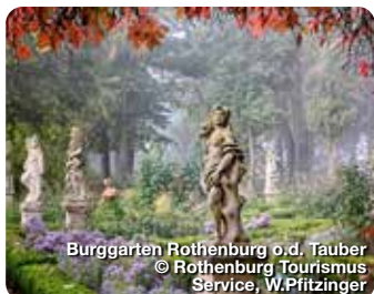
Burggarten Rothenburg o.d. Tauber

Tourismusverband Romantisches Franken Am Kirchberg 4 91598 Colmburg Tel: 0980 94141 info@romantisches-franken.de www.romantisches-franken.de