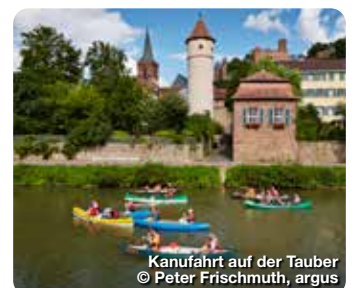
Kanufahrt auf der Tauber