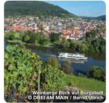
Weinberge Blick auf Bürgstadt

Jeder Tag im Sinngrund wird für Sie eine Entdeckungsreise sein. Eine Entdeckungsreise durch eine zauberhafte, romantische Landschaft mit stillen Tälern und dichten Wäldern, auf Spaziergängen und Wanderungen, Radtouren und Kutschfahrten. Eine Entdeckungsreise durch die Vergangenheit, von der die Kirchen, Schlösser und Burgen, die malerischen Gäßchen mit ihren Fachwerkhäusern und nicht zuletzt auch Naturdenkmäler und frühgeschichtliche Hügelgräber zu erzählen wissen. Der Sinngrund lebt weiterhin von vielen alten Traditionen die auch heute noch gelebt und ausgeübt werden. Der staatlich anerkannte Erholungsort zwischen den Ausläufern des Spessarts und der Rhön ist der Hauptort des unteren Sinntales. TreffpunktDeutschland.de/bugsinn