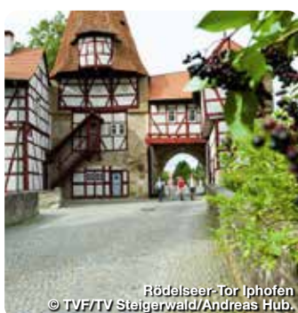
Rödelseer-Tor Iphofen

Hauptstraße 10-12, 91443 Scheinfeld, Tel.: 09162 57549990, kontakt@steigerwaldtourismus.com www.steigerwaldtourismus.com