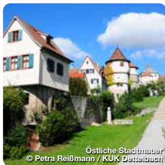
Östliche Stadtmauer

Ein schönes altfränkisches Kleinstädtchen am Fuße des Schwanberges. Die Altstadt, mit dem Rathaus (1548) und seinem historischem Sitzungssaal und den vielen weiteren Baudenkmälern, wird umgeben von der gut erhaltenen Stadtmauer mit 18 Türmen und 2 Stadttoren. Vor dem „Unteren Tor“ liegt der denkmalgeschützte Friedhof mit Renaissanceportal, freistehender Steinkanzel und den Arkaden. Die Grabengärten vor der südlichen Stadtmauer laden zum Spazieren ein. Wer die Umgebung erkunden möchte, kann auf dem Bernemer Weinwanderweg mit 3,5 km oder den Kinderwanderweg „Bärlsweg“ mit ca. 2,5 km oder 3,5 km, wandern. TreffpunktDeutschland.de/mainbernheim