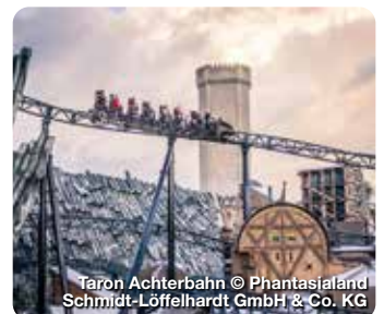
Taron Achterbahn