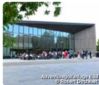
Adventuregolfanlage ESB © Robert Dorzauer.