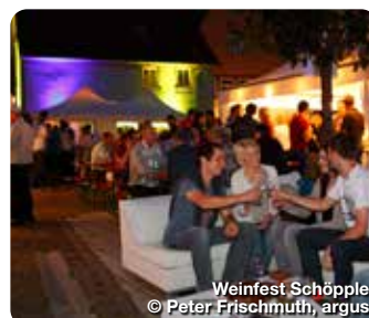
Weinfest Schöpple