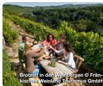
Brotzeit in den Weinbergen