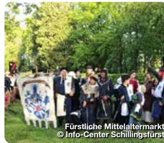
Fürstliche Mittelaltermarkt

TreffpunktDeutschland.de/schillingsfuerst.