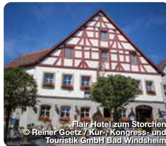
Flair Hotel zum Storchen