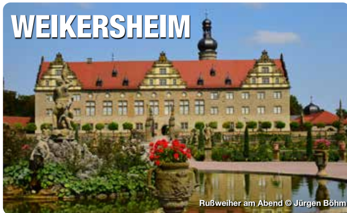
Rußweiher am Abend

Eingebettet in Weinberge liegt Weikersheim, mit einem der bedeutendsten Renaissance-Schlösser Deutschlands und seinem prächtigen Schlossgarten, inmitten des Lieblichen Taubertals. Für Radfahrer und Wanderer ist die Stadt, mit ihrem bestens ausgebauten Radwegnetz und Wanderwegen, ein idealer Ausgangspunkt. Aber auch Kunst und Kultur kommen nicht zu kurz: In der Konzerthalle Tauber Philharmonie wird ein hochkarätiges Programm angeboten. Skulpturen- und Foto.SCHAU geben den Besuchern die Möglichkeit Kunst im öffentlichen Raum im historischen Ambiente zu betrachten. Ideal für eine Auszeit aus dem Alltag. Treffpunkt Deutschland.de/weikersheim