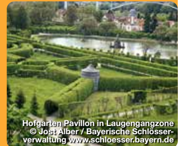
Hofgarten Pavillon in Laugengangzone