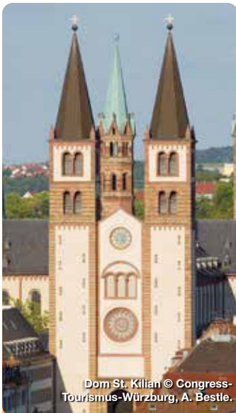
Dom St. Kilian © Congress-Tourismus-Würzburg, A. Bestle.