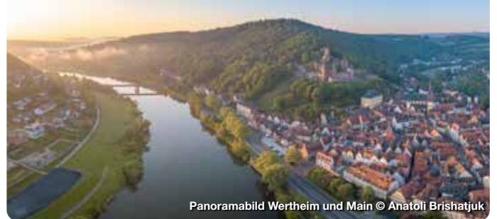
Panoramabild Wertheim und Main

Zwei Flüsse. Eine Region. Tausend Möglichkeiten. Wertheim ist die nördlichste Stadt Baden-Württembergs und Zentrum einer riesengroßen Ferienregion mit Lieblichem Taubertal, Spessart, Odenwald, Churfranken und Fränkischem Weinland. Die Große Kreisstadt ist Mitglied der „Romantischen Straße“ und staatlich anerkannter Erholungsort. In Wertheim vereinen sich Tradition und Moderne, locken kulturelle und kulinarische Vielfalt, fränkische Gastfreundschaft und die Weinvialt der zahlreichen Weinanbaugebiete. Von hier aus erkunden Sie die vielen Sehenswürdigkeiten und Attraktionen. Wertheim ist Ankerplatz für internationale Flusskreuzfahrten und Schiffsausflüge.