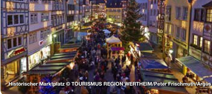
Historischer Marktplatz

25.11. - 27.11.22 02.12. - 04.12.22 09.12. - 11.12.22 16.12. - 18.12.22