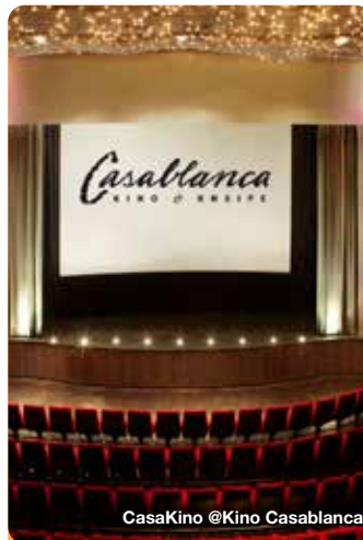
CasaKino @Kino Casablanca