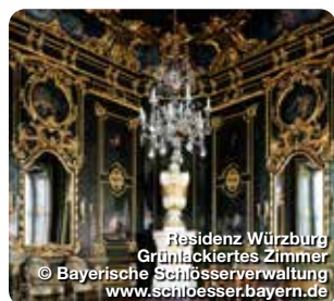
Residenz Würzburg Grünlackiertes Zimmer