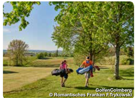
Golfen Colmburg

Mit gleich sechs Golfplätzen ist die Auswahl vor den Toren von Nürnberg groß. Allesamt liegen sie schön eingebettet in die Landschaft und haben noch viel Platz für Gastspieler. Auf den vier 18-Loch und zwei 9-Loch Anlagen kann man entspannte Runden genießen. Alle Informationen zum Radfahren, Wandern und Golfen gibt es auf der Webseite www.romantisches-franken.de