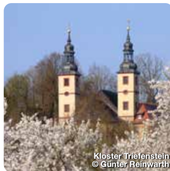
Kloster Triefenstein