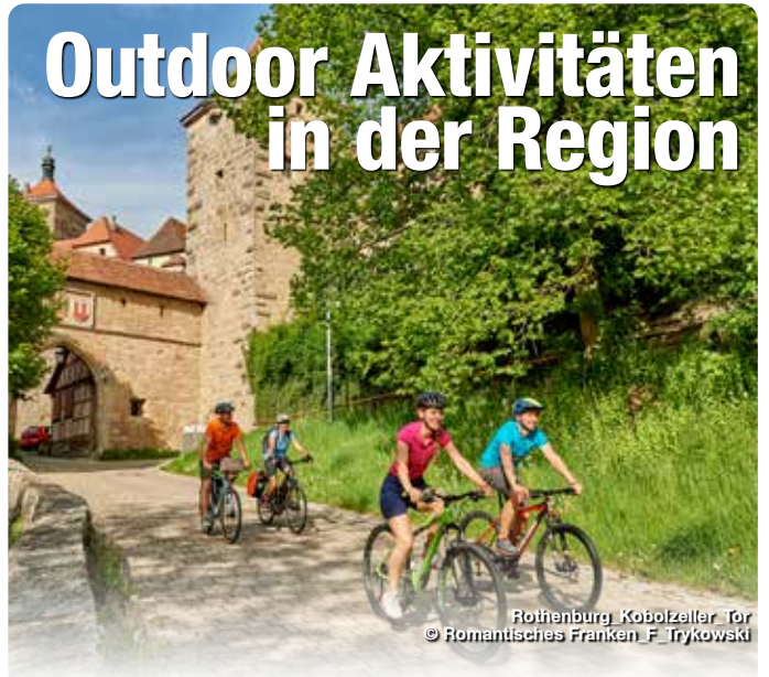
Rothenburg, Kobolzheimer Tor