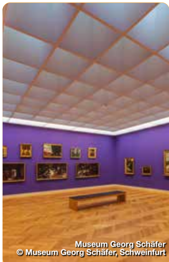
Museum Georg Schäfer