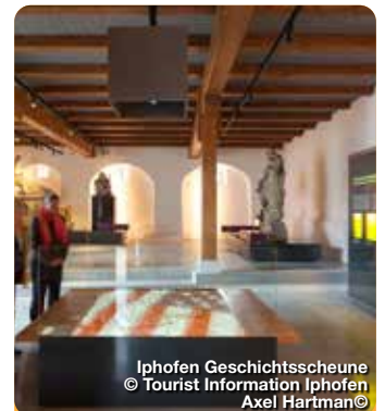
Iphofen Geschichtsscheune