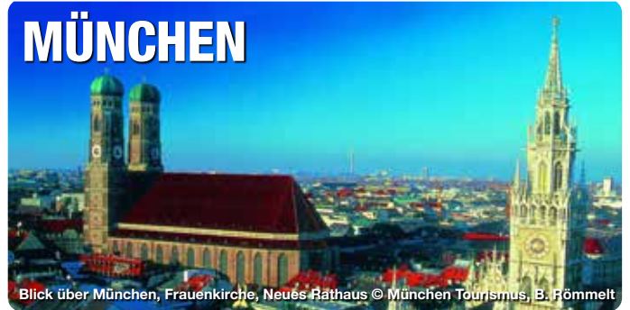
Blick über München, Frauenkirche, Neues Rathaus

Es ist die unvergleichliche Mischung aus Weltoffenheit und Tradition, aus Hightech und Bodenständigkeit, aus Innovation und charmanter Gelassenheit, die München für Touristen aus aller Welt so anziehend macht. Die bayerische Landeshauptstadt mit ihren 1,54 Millionen Einwohnern bietet alles, was sich der Gast für seinen perfekten Aufenthalt erträumt: Eine weitgefächerte Kunst- und Kulturszene, unbegrenzte Sport- und Shoppingmöglichkeiten, ein lebendiges Bar- und Nachtleben, eine vielseitige Gastronomie und ein exzellentes öffentliches Verkehrsnetz. Ihren hohen Freizeit- und Naherholungswert verdankt die Stadt den zahlreichen grünen Oasen wie dem Englischen Garten, den Isarauenden Parkanlagen der Schlösser sowie der Nähe zu den Alpen und den oberbayerischen Seen.