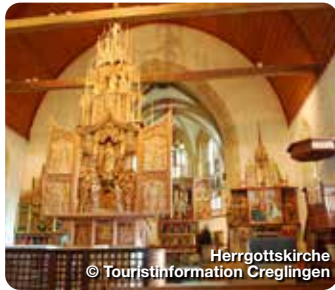
Herrgottskirche

Als kleiner Erholungsort liegt Creglingen inmitten des lieblichen Taubertals und ist Mitgliedsort der Romantischen Strasse. Der Taubertalradweg in Verbindung mit dem Main-Radweg bietet ein sportliches Natur- und Kulturserlebnis. Ländlich geprägt und mit viel Platz in der Natur vereint die Flächengemeinde als Nachbarstadt von Rothenburg ob der Tauber Erholung und aktiv sein. Tilman Riemenschneiders Meisterwerk in der Herrgottskirche, jüdisches Museum und Wohnturm-Museum in der Innenstadt, Keltenlehrpfad und eine Flachsbrechhütte, das ehemalige Kloster Frauental mit Mumien, das interessante Feuerwehrmuseum und das bezaubernde Fingerhutmuseum für Gruppenreisende bieten schöne Ziele für einen Besuch in Creglingen TreffpunktDeutschland.de/creglingen