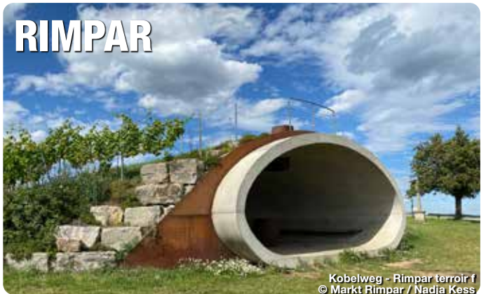
Kobelweg - Rimpar terroir f

Das Landschaftsbild der Marktgemeinde ist geprägt von Wald und Wiesen und bietet zahlreiche Erholungsräume. Einer davon ist der magische terroir f-Standpunkt am Kobersberg mit seinem von den Einheimischen liebevoll genanntem „Kobel“. Im Rahmen der Aktion „Bayerns schönster Fleck“ des Bayerischen Rundfunks wurde er, als Teil des Fränkischen Weinlandes, von den Zuschauer*innen auf den 3. Platz gewählt. Bei schönem Wetter hat man von dort eine Aussicht bis in den Steigerwald. Auf dem angrenzenden ökologischen Weinerlebnisweg erfährt man alles rund um den ökologischen Weinanbau, der hier, dank einiger Pioniere, eine lange Tradition hat. TreffpunktDeutschland.de/rimpar