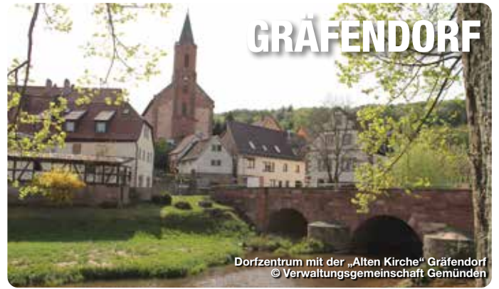
Dorfzentrum mit der „Alten Kirche“ Gräfendorf

Umgeben von den Naturschutzgebieten Schondratal und Sothenberg sowie den beiden Naturparks Spessart und Rhön liegt die Gemeinde Gräfendorf, eingebettet in hügeligem Waldgebiet mit kräftigen Eichen und Buchen. Hier finden Sie als Gast eine Abwechslung, die Sie verzaubern wird. Der verkehrsberuhigte, aber trotzdem gut zu erreichende Ort ist bei den Gästen besonders beliebt, die weit ab vom Autoverkehr Ruhe und Erholung an der naturbelassenen Fränkischen Saale und dem wildromantischen Schondratal, mit seinen einladenden Rad- und Wanderwegen, suchen. Vielfältige Aktivitäten wie Angeln, Bootfahren, Schwimmen, Reiten, Wandern, Radfahren, Klettern u.v.m. sind möglich. TreffpunktDeutschland.de/grafendorf