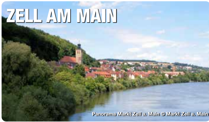
Panorama Markt Zell a. Main

Direkt vor den Toren Würzburgs, idyllisch eingebettet zwischen den Muschelkalkhängen des Wasserschutzgebiets und dem Fluss, liegt die Marktgemeinde am überregional bekannten und beliebten Main-Radweg. Dieser führt am Kloster Oberzell vorbei, das zu den eindrucksvollsten und geschichtsträchtigen Orten im Landkreis Würzburg gehört. Auch im Zeller Altort gibt es äußerst viel zu sehen. So z. B. die Zeller Weinhändlerhäuser, das Wassermuseum und den Kulturkeller, den Bürgerbräustollen, die Rosenbaumsche Laubhütte und das Areal des ehemaligen Klosters Unterzell mit Zugang zum historischen Kapitelsaal mit originalem Stuck aus der Echterzeit.