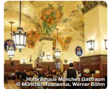
Hofbräuhaus München Gastraum