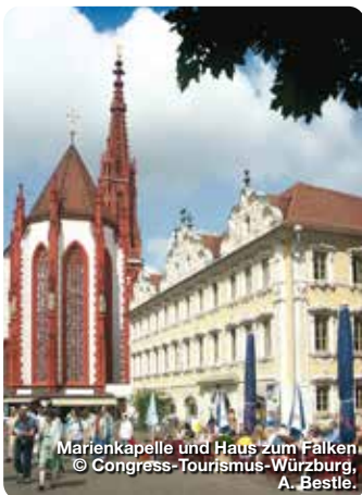
Marienkapelle und Haus zum Falken

Am Congress Centrum, 97070 Würzburg, Tel.: 0931/37 23 35, Fax: 0931/37 36 52, tourismus@wuerzburg.de, www.wuerzburg.de, Facebook: www.facebook.com/wuerzburg.tourismus