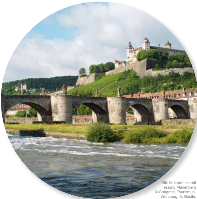
Alte Mainbrücke mit Festung Marienberg