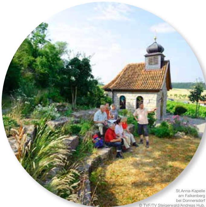
St. Anna-Kapelle am Falkenberg bei Donnersdorf