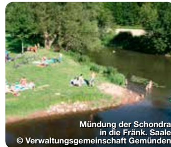
Mündung der Schondra in die Fränk. Saale