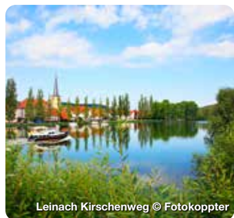
Leinach Kirschenweg