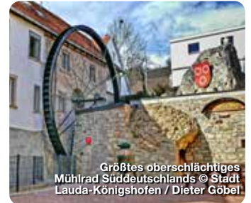
Größtes ober-schlächtiges Mühlrad Süddeutschlands