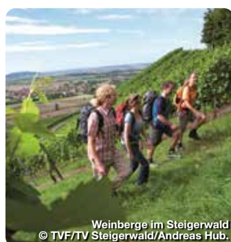
Weinberge im Steigerwald