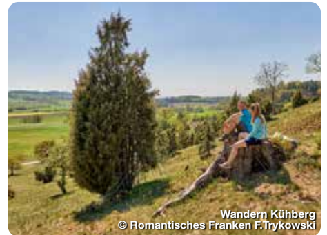
Wandern Kühberg

Ein großes Netz an Wanderwegen durchzieht den Naturpark Frankenhöhe. Rund um den Hesselberg kann man mit herrlicher Aussicht wandern. Rund um die historischen Städte von Dinkelsbühl, Feuchtwangen und Rothenburg o.d.T. stehen eigene Wegenetze bereit. Mit Geschichte wandern geht man auf dem KulturWanderweg Hohenzollern zwischen Rosstal und Langenzenn. Bei Stein und Zirndorf ist der Wanderweg Wallensteins Lager eine schöne Mischung aus Naturerlebnis und Geschichtspfad.