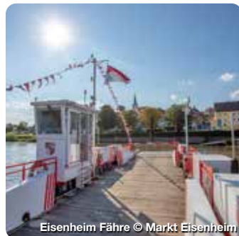
Eisenheim Fähre