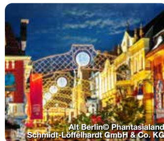
Alt Berlin

Beim Wintertraum verwandelt sich das Phantasialand von November bis Januar in eine winterliche Landschaft mit einem ganz besonderen Angebot. Es gibt eigens für die kalte Jahreszeit entwickelte Shows und winterliche Food-Angebote wie zum Beispiel verschiedenste Suppen im Brotlaib, Flammlachs und Punschspezialitäten. Ab der Dämmerung verwandelt sich der Park dann in ein Lichtermeer. Hinzu kommen im Wintertraum auch die zahlreichen Attraktionen des Phantasialand, die fast alle wie im Sommer geöffnet haben, selbst Chiapas - DIE Wasserbahn. Die Kombination all dieser Facetten macht den Wintertraum so einzigartig. Phantasialand, Brühl