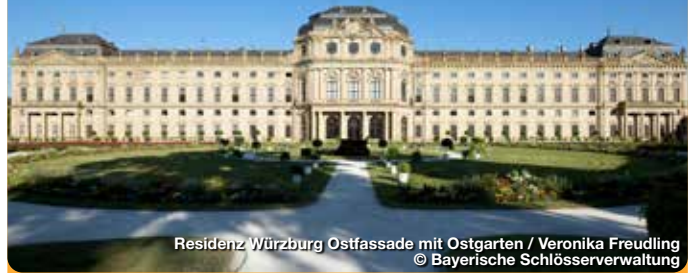
Residenz Würzburg Ostfassade mit Ostgarten

Vom Wiederaufbau zum UNESCO-Welterbe. Die ehemalige Residenz der Würzburger Fürstbischöfe ist von 1720 bis 1744 in einer Bauzeit von nur 24 Jahren im Rohbau entstanden und wurde bis 1780 fertig ausgestattet. In ihrer stilistischen Geschlossenheit zählt sie zu den bedeutendsten Schlossanlagen des Barocks in Europa und gehört seit 1981 zum Weltkulturerbe der UNESCO. Insgesamt können über 40 Schlossräume besichtigt werden. Zu den Highlights zählen das aufwendig restaurierte Spiegelkabinett, die zahlreichen Prunksäle, das eindrucksvolle Deckenfresko Giovanni Battista Tiepolos im Treppenhaus und der angrenzende Hofgarten.