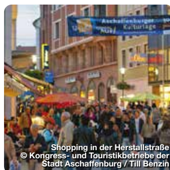
Shopping in der Herstattstraße