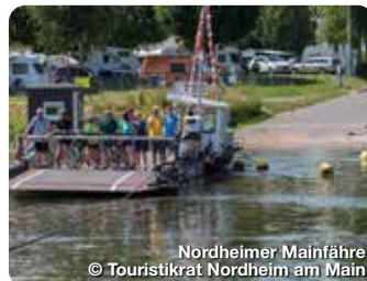
Nordheimer Mainfähre