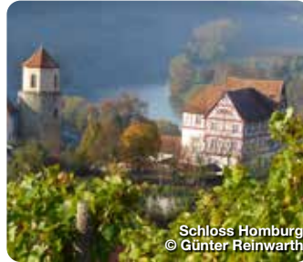
Schloss Homburg