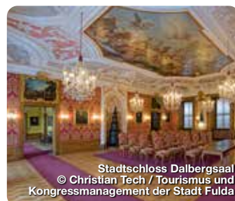
Stadtschloss Dalbergsaal