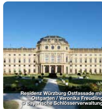
Residenz Würzburg Ostfassade mit Ostgarten