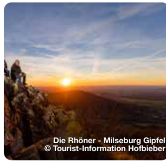
Die Rhöner - Milseburg Gipfel

TreffpunktDeutschland.de/bad-neustadt-an-der-saale