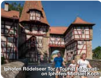
Iphofen Rödelseer Tor / Tourist Information Iphofen/Michael Koch