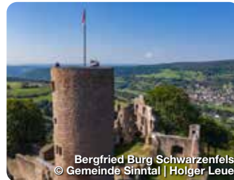
Bergfried Burg Schwarzenfels

TreffpunktDeutschland.de/ steinau-an-der-strasse