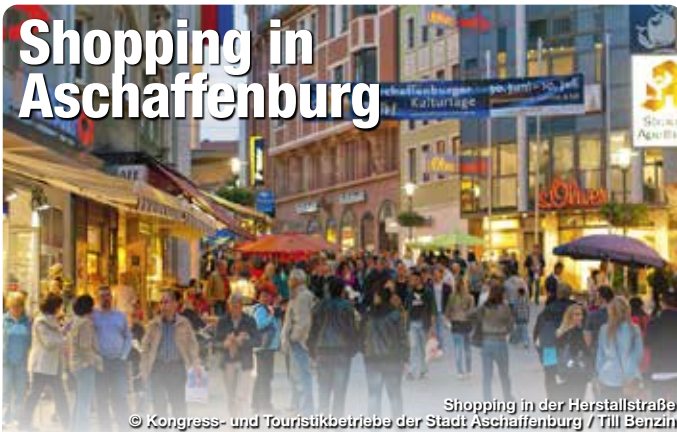
Shopping in der Herstattstraße

Lorem ipsum dolor sit amet, consectetur adipiscing elit. Aenean commodo ligula eget dolor. Aenean massa. Cum sociis natoque penatibus et magnis dis parturient montes, nascetur ridiculus mus. Donec quam felis, ultricies nec, pellentesque eu, pretium quis, sem. Nulla consequat massa quis enim. Donec pede justo, fringilla vel, aliquet nec, vulputate eget, arcu. In enim justo, rhoncus ut, imperdiet a, venenatis vitae, justo. Nullam dictum felis eu pede mollis pretium. Integer tincidunt. Cras dapibus. Vivamus elementum semper nisi. Aenean vulputate eleifend tellus. Aenean leo ligula, porttitor eu, consequat vitae, eleifend ac, enim. Aliquam lorem ante, dapibus in, viverra quis, feugiat a, tellus. Phasellus viverra nulla ut metus varius laoreet. Quisque rutrum. Aenean imperdiet. Etiam ultricies nisi vel augue. Curabitur ullamcorper ultricies.