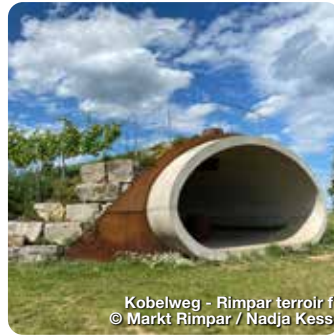
Kobelweg - Rimpar terroir f