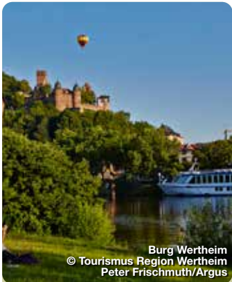
Burg Wertheim