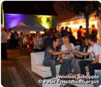
Weinfest Schöpple