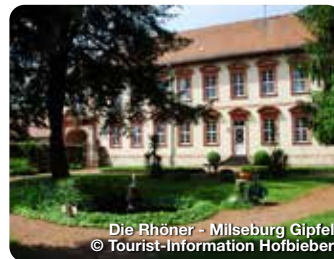
Die Rhöner - Milseburg Gipfel