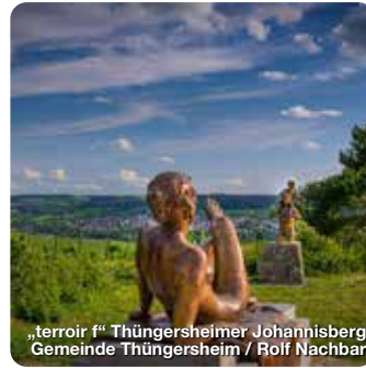
„terroir f“ Thüngersheimer Johannisberg Gemeinde Thüngersheim / Rolf Nachbar