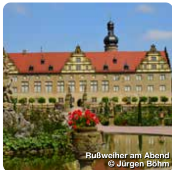
Rußweiher am Abend