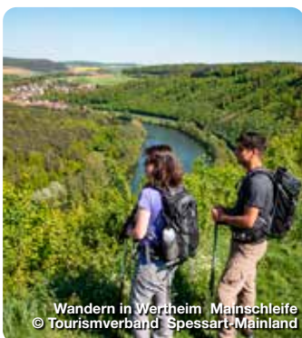
Wandern in Wertheim Mainschleife

Industriering 7, 63868 Großwallstadt, Tel: 06022/26 1020 info@spessart-mainland.de, www.spessart-mainland.de