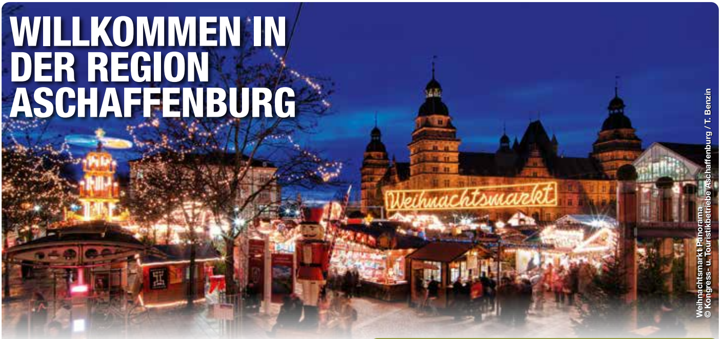
Weihnachtsmarkt Panorama