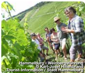
Hammelburg - Weinbergsführung