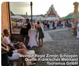
Weingut Regie Zinnen Schoppen

Fränkisches Weinland Tourismus GmbH Turmgasse 11, 97070 Würzburg www.fraenkisches-weinland.de