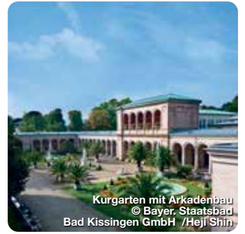
Kurgarten mit Arkadenbau