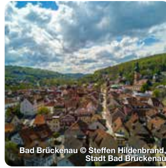
Bad Brückenau