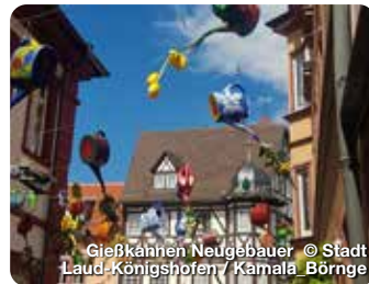
Liebkähnen Neugebauer