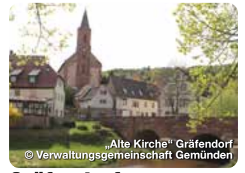
„Alte Kirche“ Gräfen Dorf