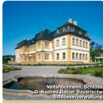
Veitshöchheim, Schloss