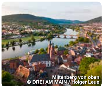
Miltenberg von oben

Miltenberg glänzt nicht nur mit einer mittelalterlichen Altstadt voller Fachwerkbauten, es hat, mit seiner lebendigen Stadtkultur, auch „ganz schön junges“ Mittelalter zu bieten. In den traditionellen Gasthäusern, Häckerwirtschaften und gemütlichen Cafés bleibt kein kulinarischer Wunsch offen. Mit zertifizierten Gästeführern erleben Sie die Altstadt und Museen wie noch nie. Das Highlight für spontan entschlossene Gäste: Tägliche Führungen um 14 Uhr – rund ums Jahr. Für alle, die es gerne aktiver mögen, bietet Miltenberg spektakuläre MTB-Trails, faszinierende Fahrradwege entlang des Mains und gut markierte Wanderwege in den Odenwald und Spessart. TreffpunktDeutschland.de/miltenberg