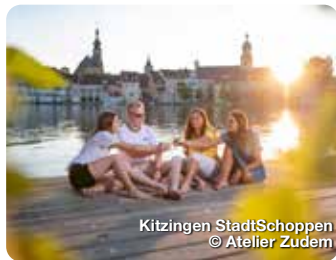
Kitzingen StadtSchoppen

Ein schönes altfränkisches Kleinstädtchen am Fuße des Schwanberges. Die Altstadt, mit dem Rathaus (1548) und seinem historischem Sitzungssaal und den vielen weiteren Baudenkmalern, wird umgeben von der gut erhaltenen Stadtmauer mit 18 Türmen und 2 Stadttoren. Vor dem „Unteren Tor“ liegt der denkmalgeschützte Friedhof mit Renaissanceportal, freistehender Steinkanzel und den Arkaden. Die Grabengärten vor der südlichen Stadtmauer laden zum Spazieren ein. Wer die Umgebung erkunden möchte, kann auf dem Bernemer Weinwanderweg mit 3,5 km oder den Kinderwanderweg „Bärlesweg“ mit ca. 2,5 km oder 3,5 km, wandern. TreffpunktDeutschland.de/mainbernheim