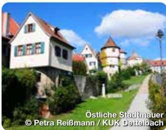
Östliche Stadtmauer