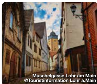
Muschelgasse Lohr am Main