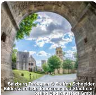
Salzburg Torbogen

TreffpunktDeutschland.de/bad-koenigshofen