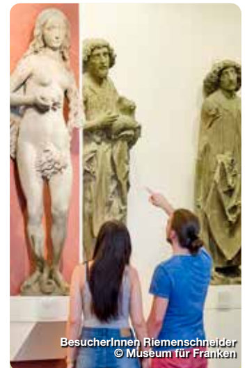
BesucherInnen Riemenschneider

Die ehemalige Residenz der Würzburger Fürstbischöfe ist von 1720 bis 1744 in einer Bauzeit von nur 24 Jahren im Rohbau entstanden und wurde bis 1780 fertig ausgestattet. In ihrer stilistischen Geschlossenheit zählt sie zu den bedeutendsten Schlossanlagen des Barocks in Europa und gehört seit 1981 zum Weltkulturerbe der UNESCO. Insgesamt können über 40 Schlossräume besichtigt werden. Zu den Highlights zählen das aufwendig restaurierte Spiegelkabinett, die zahlreichen Prunksäle, das eindrucksvolle Deckenfresko Giovanni Battista Tiepolos im Treppenhaus und der angrenzende Hofgarten. Residenzplatz 2, Würzburg