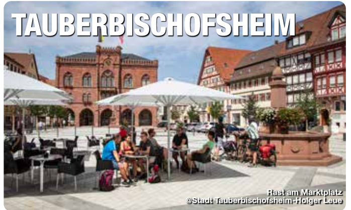
Rast am Marktplatz

Der Marktplatz mit dem neugotischen Rathaus bildet das Zentrum der Ferienstadt Tauberbischofsheim. Ob Glockenspiel, Marktveranstaltungen oder Feste – Urlauber und Einheimische halten sich gerne auf der neu gestalteten Fläche auf und genießen die Atmosphäre. Von hier aus lassen sich Stadtrundgänge wie zur Stadtkirche St. Martin, dem Schlossplatz mit dem Kurmainzischen Schloss sowie durch die verwinkelten Gassen der Altstadt unternehmen. Die neu sanierte Fußgängerzone lädt zum Flanieren und Bummeln geradezu ein. Die örtliche Gastronomie bietet gemütliche Rastmöglichkeiten.