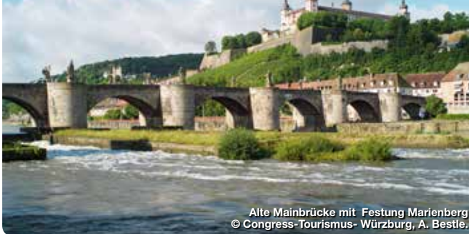
Alte Mainbrücke mit Festung Marienberg © Congress-Tourismus- Würzburg, A. Bestle.

Die reizvolle Universitätsstadt am Main liegt inmitten von Weinbergen, überragt von ihrem Wahrzeichen, der Festung Marienberg. Architektonischer Glanzpunkt ist die fürstbischöfliche Residenz, seit 1981 UNESCO Welterbe. Balthasar Neumann schuf dieses „Schloss über allen Schlössern“ mit dem berühmten Treppenhaus und dem weltgrößten Deckenfresko von Giovanni B. Tiepolo. Die spätgotische Marienkapelle, das Haus zum Falken mit seiner prunkvollen Rokoko-Fassade und der Dom St. Kilian, die viertgrößte romanische Kirche Deutschlands, dürfen ebenfalls bei keiner Stadtbesichtigung fehlen.