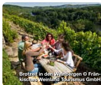
Brötzeit in den Weinbergen