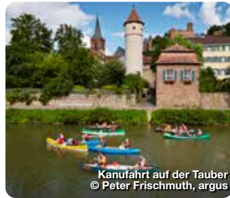
Kanufahrt auf der Tauber