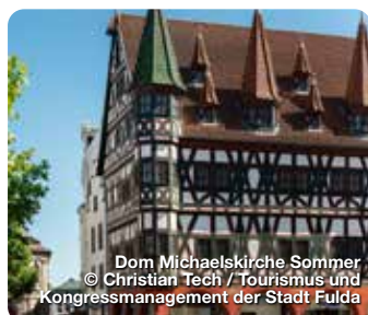
Dom Michaeliskirche Sommer

In Fulda ist der Glanz des Barock lebendig. Prächtige Bau- und Kunstdenkmäler bedeutender Architekten künden im Barockviertel der einstigen Residenzstadt vom Ruhm und von der Pracht der Fuldaer Fürstbische und Fürstbischöfe, die im 18. Jahrhundert weltliche und geistliche Macht vereinten. Das Erkunden der historischen Sehenswürdigkeiten aus jener glanzvollen Epoche wird für Gruppen und Einzelreisende in Hessens schönster Barockstadt zu einem Erlebnis. Das bekannteste Wahrzeichen Fuldas ist der Dom St. Salvator. Johann Dientzenhofer erbaute das Gotteshaus im Stil des italienischen Barock. Seit der Erhebung der Fürstbische zum Fürstbistum Fulda 1752 ist der Sakralbau Bischofs- und Kathedrale Kirche. TreffpunktDeutschland.de/fulda