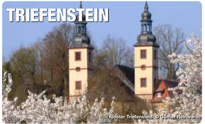
Kloster Triefenstein

Mitten in Deutschland, und ganz nah am Himmelreich, liegt der Markt Triefenstein idyllisch mit seinen vier Ortsteilen Homburg am Main, Lengfurt, Trennfeld und Rettersheim. Der Markt Triefenstein mit 4.600 Einwohner zeigt auch im Tourismusangebot vielseitige Facetten: landschaftlich und kulturelle Idylle mit zwei gepflegten Kulturwanderwegen, historische Gebäude mit Schloss Homburg, Kloster Triefenstein, Dreifaltigkeitssäule und Papiermühle, Sport- und Freizeitangebote bis hin zu kulinarischen Weinangeboten. Besuchen Sie die Region und genießen Sie den besonderen Flair Triefensteins.