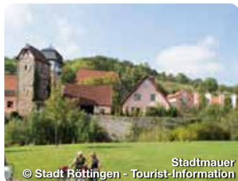
Stadtmauer

Niederstetten, idyllisch mitten im Hohenloher Land, zwischen Tauber und Jagst gelegen, ist idealer Ausgangsort für Tagestouren in die Feriengebiete Liebliches Taubertal, Franken und das Jagsttal. Jakobsweg und Romantische Straße sowie ein gut ausgebautes Rad- u. Wanderwegenetz locken. Historische Stätten wie die Keltische Viereckschanze zeugen von der frühen Besiedelung. Die Werke des großen Bildhauermeisters Tilman Riemenschneider, Klöster, Burgen und die Städte Würzburg, Schwäbisch Hall sowie die alte Deutschordensstadt Bad Mergentheim und natürlich Rothenburg ob der Tauber lassen erahnen, dass man sich in altem Kulturland befindet. TreffpunktDeutschland.de/niederstetten