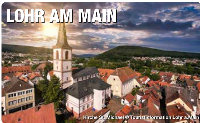
Kirche St. Michael

Einfach märchenhaft. „Spieglein, Spieglein an der Wand...“, wer es märchenhaft mag, besucht das Lohrer Schneewittchen. Den Gebrüdern Grimm zufolge, wohnte das schöne Mädchen in einem Schloss mit seiner bösen Stiefmutter. In diesem Schloss, in Lohr am Main, sind heute das Spessartmuseum mit seiner Schneewittchenpräsentation und der legendäre „sprechende Spiegel“ untergebracht. In der historischen Altstadt entdecken Sie das typisch fränkische Fachwerk. Die Lohrer Fußgängerzone, mit zahlreichen kleinen aber feinen Geschäften, Straßencafés, Biergärten und urigen Weinhäusern lädt zum Verweilen ein. TreffpunktDeutschland.de/lohr-am-main