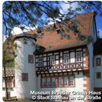
Museum Brueder Grimm-Haus