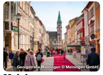
Georgstraße Meiningen

Hosenfeld ist eine ländlich geprägte Gemeinde im Westen des Landkreises Fulda, umgeben von Bergen, Wäldern wie auch von offener Landschaft mit Blick bis Rhön und Vogelsberg. TreffpunktDeutschland.de/hosenfeld