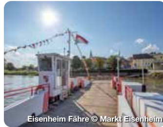
Eisenheim Fähre