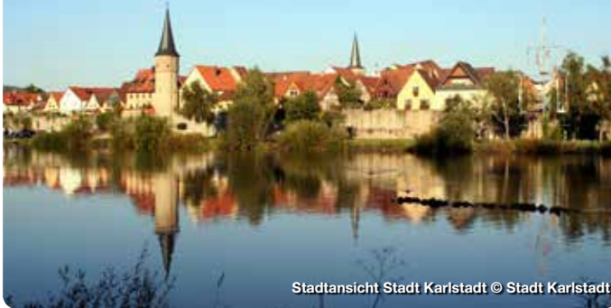
Stadtsicht Stadt Karlstadt

Hinter einer der schönsten Ortssilhouetten entlang des Mains öffnet sich dem Besucher eine Stadt von besonderem Reiz. Die behutsame, aber eindrucksvolle Erneuerung, der „am Reißbrett“ geplanten, Altstadt zieht Besucher in ihren Bann. Kein Wunder, denn nahezu unverändert hat sich der Mustergrundriss der Stadt erhalten, deren Glanzpunkte die romanisch-gotische Stadtpfarrkirche, das Historische Rathaus, die Tore und Türme der Stadtbefestigung sowie die Bürgerhäuser bilden. Hier lässt sich Geschichte auf Schritt und Tritt erleben. Im Museum Karlstadt, das im Mai 2022 eröffnet wird, reisen Sie von der Vergangenheit in die Gegenwart. TreffpunktDeutschland.de/karlstadt