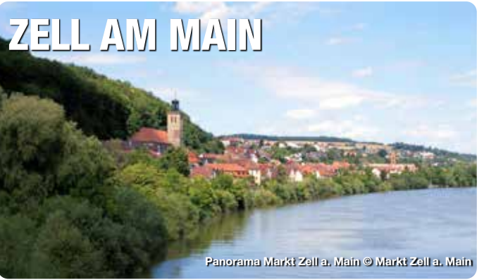
Panorama Markt Zell a. Main

Direkt vor den Toren Würzburgs, idyllisch eingebettet zwischen den Muschelkalkhängen des Wasserschutzgebiets und dem Fluss, liegt die Marktgemeinde am überregional bekannten und beliebten Main-Radweg. Dieser führt am Kloster Oberzell vorbei, das zu den eindrucksvollsten und geschichtsträchtigsten Orten im Landkreis Würzburg gehört. Auch im Zeller Altort gibt es äußerst viel zu sehen. So z. B. die Zeller Weinhändlerhäuser, das Wassermuseum und den Kulturkeller, den Bürgerbräustollen, die Rosenbaumsche Laubhütte und das Areal des ehemaligen Klosters Unterzell mit Zugang zum historischen Kapitelsaal mit originalem Stuck aus der Echterzeit.