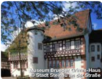
Museum Brueder Grimm-Haus

Die idyllisch, im Naturpark Hessischer Spessart, am Rande von Rhön und Vogelsberg, gelegene Gemeinde Sinnthal bietet reizvolle Wander- und Radwege in einer wunderschönen Mittelgebirgslandschaft. Die seltene Schachbrettblume ist hier ebenso zuhause wie der Biber. Ausgedehnte Mischwälder wechseln sich ab mit grünen Wiesen und Weiden, beschaulichen Flusstälern und malerischen kleinen Orten. Zu den beeindruckendsten Sehenswürdigkeiten zählt die Burg Schwarzenfels, die vor mehr als 700 Jahren hoch über dem Tal der Sinn errichtet wurde, und von deren Bergfried Sie eine herrliche Aussicht über den Spessart in das Sinnthal und in die Rhön haben. TreffpunktDeutschland.de/sinntal