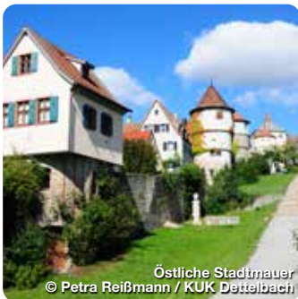
Östliche Stadtmauer

Ein schönes altfränkisches Kleinstädtchen am Fuße des Schwanberges. Die Altstadt, mit dem Rathaus (1548) und seinem historischem Sitzungssaal und den vielen weiteren Baudenkmälern, wird umgeben von der gut erhaltenen Stadtmauer mit 18 Türmen und 2 Stadttoren. Vor dem „Unteren Tor“ liegt der denkmalgeschützte Friedhof mit Renaissanceportal, freistehender Steinkanzel und den Arkaden. Die Grabengärten vor der südlichen Stadtmauer laden zum Spazieren ein. Wer die Umgebung erkunden möchte, kann auf dem Bernemer Weinwanderweg mit 3,5 km oder den Kinderwanderweg „Bärlsweg“ mit ca. 2,5 km oder 3,5 km, wandern. TreffpunktDeutschland.de/mainbernheim