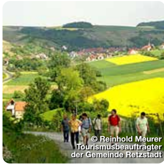
© Reinhold Meurer Tourismusbeauftragter der Gemeinde Retzstadt