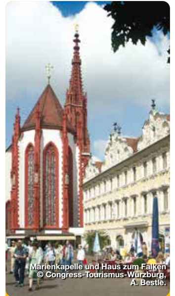
Marienkapelle und Haus zum Falken © Congress-Tourismus-Würzburg, A. Bestle.

Das Mainfranken Theater Würzburg ist die größte und bekannteste Kulturinstitution in der Regiopole Mainfranken. Das Mehrspartenhaus kann auf eine über 200-jährige Historie zurückblicken und steht für künstlerische Qualität und kreative Vielfalt. Seit 2018 wird das Theater bei laufendem Spielbetrieb saniert. 2022 soll das neue Kleine Haus eröffnet werden. Die neue zusätzliche Spielstätte im Neubau bietet 330 Sitzplätze die gläserne Fassade offen zur Stadt. Theaterstraße 21, Würzburg