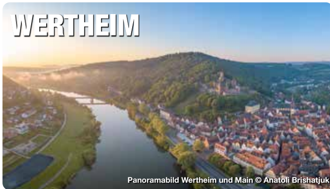
Panoramabild Wertheim und Main