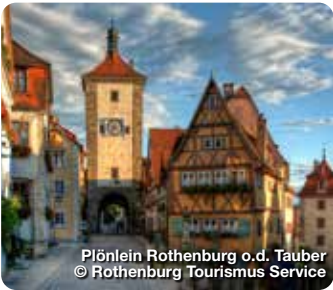
Plöhllein Rothenburg o.d. Tauber

TreffpunktDeutschland.de/rothenburg-ob-der-tauber