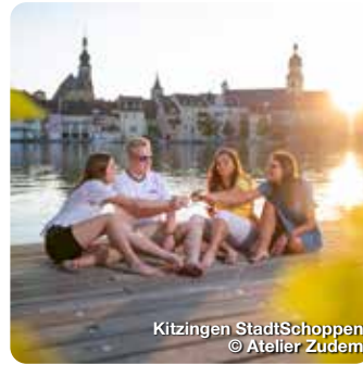
Kitzingen StadtSchoppen