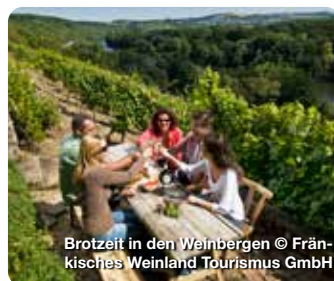
Brotzeit in den Weinbergen