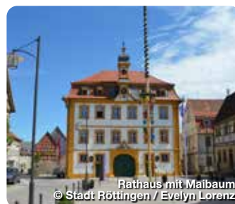
Rathaus mit Maßbaum