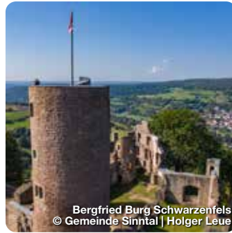
Bergfried Burg Schwarzenfels Gemeinde Sinnthal

Stadtprozelten, mit seinem Stadtteil Neuenbuch und dem Weiler Hofthiergarten, liegt im landschaftlich reizvollen Maintal zwischen Spessart und Odenwald. Es ist eine der kleinsten Städte unserer Heimat, angeschlossen an einen Höhenrücken (Kühlberg), der von der Burgruine „Henneburg“ gekrönt wird. Sie ist es auch, die Stadtprozelten einen besonderen Reiz verleiht. Sie ist eine der größten und markantesten, wie auch gleichzeitig besterhaltensten Burgen Deutschlands, und gewährt eine höchst malerische Aussicht über das Maintal, und die gegenüberliegenden Ausläufer des Odenwaldes. Und weil die Burg früher Burg Prozelten hieß, heißt die Stadt zu ihren Füßen Stadtprozelten. TreffpunktDeutschland.de/stadtprozelten