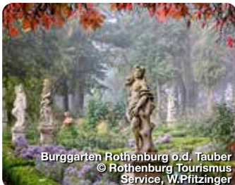
Burggarten Rothenburg o.d. Tauber

Tourismusverband Romantisches Franken Am Kirchberg 4 91598 Colmburg Tel: 0980 94141 info@romantisches-franken.de www.romantisches-franken.de