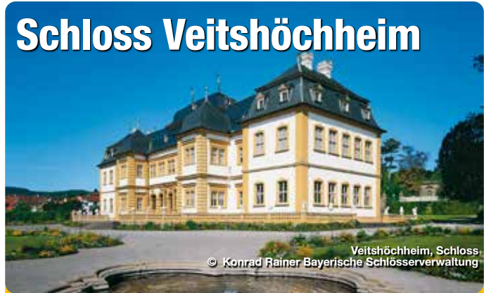
Veitshöchheim, Schloss

Der 1680 bis 1682 erbaute Sommersitz der Würzburger Fürstbischöfe wurde 1753 durch Balthasar Neumann vergrößert. 1806 bis 1814 war das Schloss in den Sommermonaten von Großherzog Ferdinand von Toskana bewohnt, der in dieser Zeit in Würzburg residierte. Seit 1814 ist das Schloss im Besitz der Bayerischen Krone und wurde im 19. Jahrhundert von der königlichen Familie ebenfalls als Sommerschloss genutzt. Erst durch die Restaurierung von 1931/32 wurden alle Räume des Obergeschosses wieder als historische Schauräume ausgestattet und der Öffentlichkeit als Museum geöffnet. Echterstrasse 10, Veitshöchheim