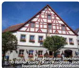
Flair Hotel zum Storch