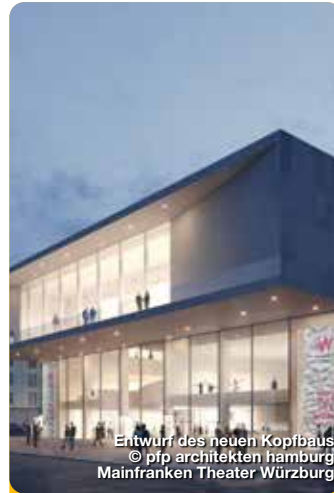
Entwurf des neuen Kopfbaus © pfp architekten hamburg Mainfranken Theater Würzburg