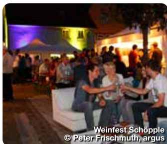
Weinfest Schöpple