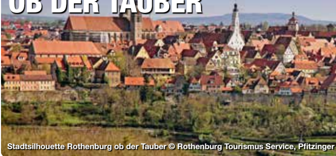
Stadtsilhouette Rothenburg ob der Tauber

Die Stadt Rothenburg ob der Tauber in Mittelfranken ist weit über die Grenzen der Bundesrepublik bekannt, als der Inbegriff des mittelalterlichen romantischen Deutschlands. Die Stadtmauer, die auf über drei Kilometern die Altstadt umschließt, der historische Stadtkern, mit seinen unzähligen Fachwerkhäusern, und die Lage der Stadt über dem Taubertal begeistern Besucher aus der ganzen Welt – und machen Rothenburg ob der Tauber somit zu einem Ort der Begegnungen. Hinter den Mauern der pittoresken Häuser verstecken sich idyllische Privatgärten, die Besuchern im Rahmen von Führungen offenstehen.