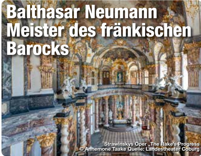
Strawinskys Oper „The Rake's Progress

Kein anderer Architekt hat die Bauwerke in und um Würzburg so nachhaltig geprägt wie Balthasar Neumann (1687-1753). Berühmt wurde er durch den Bau der Residenz mit ihrem einzigartigen Treppenhaus. Beeinflusst wurde Neumann maßgeblich von den französischen Architekten Robert de Cotte und Germain Boffrand, mit denen er seine Pläne für die Residenz diskutierte. Weitere Bauwerke aus seiner Planung sind die Schönbornkapelle, die Au-