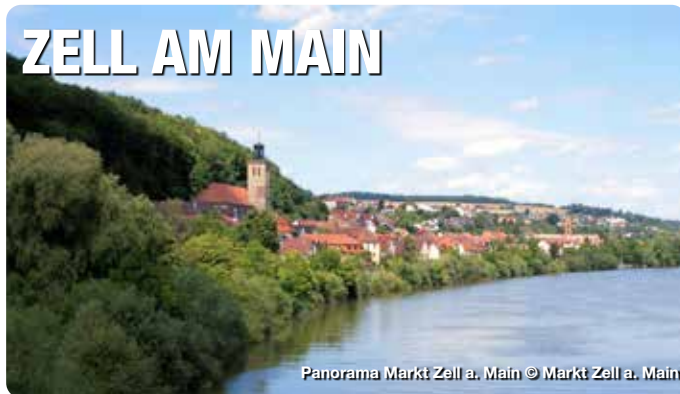
Panorama Markt Zell a. Main

Direkt vor den Toren Würzburgs, idyllisch eingebettet zwischen den Muschelkalkhängen des Wasserschutzgebiets und dem Fluss, liegt die Marktgemeinde am überregional bekannten und beliebten Main-Radweg. Dieser führt am Kloster Oberzell vorbei, das zu den eindrucksvollsten und geschichtsträchtigsten Orten im Landkreis Würzburg gehört. Auch im Zeller Altort gibt es äußerst viel zu sehen. So z. B. die Zeller Weinhändlerhäuser, das Wassermuseum und den Kulturkeller, den Bürgerbräustollen, die Rosenbaumsche Laubhütte und das Areal des ehemaligen Klosters Unterzell mit Zugang zum historischen Kapitelsaal mit originalem Stück aus der Echterzeit. TreffpunktDeutschland.de/zell-am-main