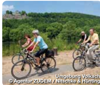
Umgebung Volkach

Willkommen im Herzen des Fränkischen Weinlands, an der Volkacher Mainschleife! Erleben Sie Volkach als historisch, kulinarisch und kulturell attraktives Ausflugsziel zwischen Würzburg und Bamberg. Die Weinstadt ist das Zentrum der Mainschleife und hat eine über 1.100jährige Ortsgeschichte, ganz im Zeichen des Frankenweins, vorzuweisen. Rund ein Viertel der fränkischen Rebfläche werden an der Mainschleife bewirtschaftet. Vier Winzergenossenschaften und über 150 selbstvermarktende Winzer sind hier im Umkreis von 15 Kilometern beheimatet. Die Mainschleife ist das größte zusammenhängende Weinanbaugebiet in Franken. TreffpunktDeutschland.de/volkach