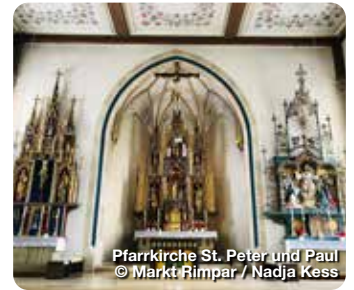
Pfarrkirche St. Peter und Paul