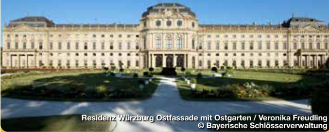
Residenz Würzburg Ostfassade mit Ostgarten

Vom Wiederaufbau zum UNESCO-Welterbe . Die ehemalige Residenz der Würzburger Fürstbischöfe ist von 1720 bis 1744 in einer Bauzeit von nur 24 Jahren im Rohbau entstanden und wurde bis 1780 fertig ausgestattet. In ihrer stilistischen Geschlossenheit zählt sie zu den bedeutendsten Schlossanlagen des Barocks in Europa und gehört seit 1981 zum Weltkulturerbe der UNESCO. Insgesamt können über 40 Schlossräume besichtigt werden. Zu den Highlights zählen das aufwendig restaurierte Spiegelkabinett, die zahlreichen Prunksäle, das eindrucksvolle Deckenfresko Giovanni Battista Tiepolos im Treppenhaus und der angrenzende Hofgarten.