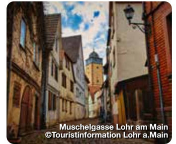
Muschelgasse Lohr am Main