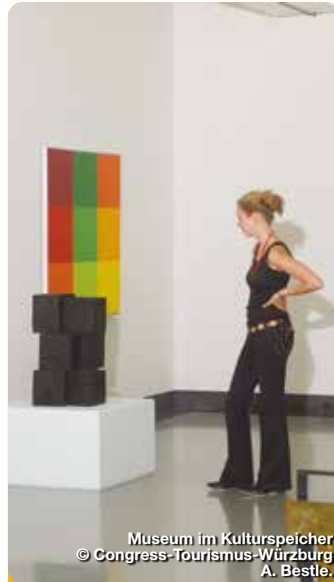
Museum im Kulturspeicher © Congress-Tourismus-Würzburg A. Bestle.

Finden Sie einen Augenblick der Ruhe und Einkehr im Würzburger Dom. Der Dom St. Kilian ist die viertgrößte romanische Kirche Deutschlands und gilt als ein Hauptwerk der deutschen Baukunst des 11. und 12. Jahrhunderts. 2012 wurden der Innenraum, die Krypta und die Sepultur umgestaltet und erstrahlen jetzt in einer zeitgemäßen Ästhetik. Domstraße 40, Würzburg.