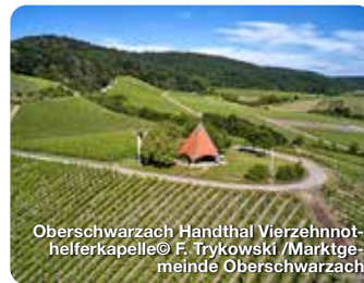
Oberschwarzach Handthal Vierzeihnnot- helferkapelle