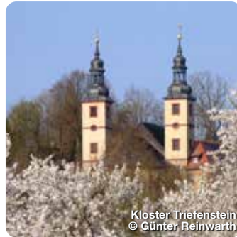
Kloster Triefenstein © Günter Reinwärtig