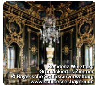
Residenz Würzburg Grünlackiertes Zimmer