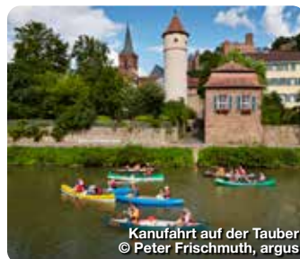
Kanufahrt auf der Tauber