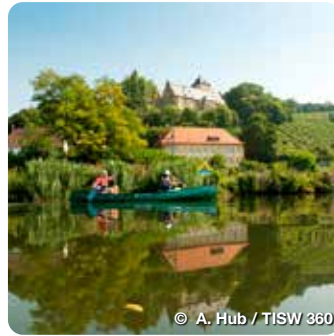
© A. Hub / TISW 360