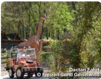
Dactari Fahrt