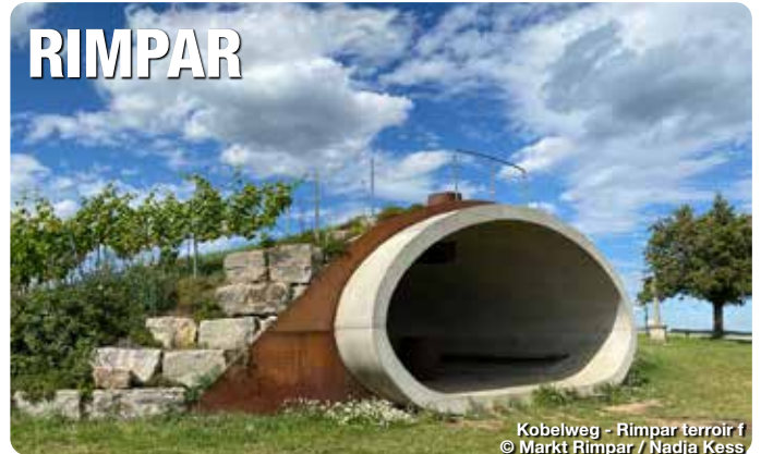
Kobelweg - Rimpar terroir f

Das Landschaftsbild der Marktgemeinde ist geprägt von Wald und Wiesen und bietet zahlreiche Erholungsräume. Einer davon ist der magische terroir f-Standpunkt am Kobersberg mit seinem von den Einheimischen liebevoll genanntem „Kobel“. Im Rahmen der Aktion „Bayerns schönster Fleck“ des Bayerischen Rundfunks wurde er, als Teil des Fränkischen Weinlandes, von den Zuschauer*innen auf den 3. Platz gewählt. Bei schönem Wetter hat man von dort eine Aussicht bis in den Steigerwald. Auf dem angrenzenden ökologischen Weinerlebnisweg erfährt man alles rund um den ökologischen Weinanbau, der hier, dank einiger Pioniere, eine lange Tradition hat. TreffpunktDeutschland.de/rimpar