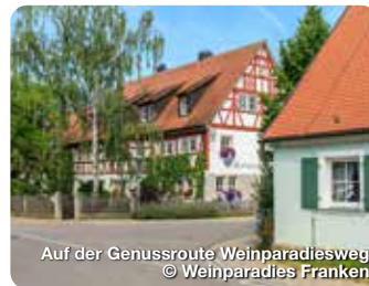
Auf der Genussroute Weinparadiesweg