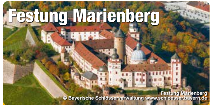
Festung Marienberg

Die Festung Marienberg ist das weithin sichtbare Wahrzeichen der Stadt Würzburg. Die mächtige Anlage, die von 1253 - 1719 Sitz der Fürstbischöfe war, liegt auf einem sich gut einhundert Meter über das Maintal erhebenden Höhenrücken, den auf drei Seiten steil abfallende Hänge umgeben. Diese günstige Lage führte zur Entstehung einer befestigten Fliehbürg auf der Anhöhe (um 1000 v. Chr.). Der älteste, im Kern noch existierende Bau dürfte die 706 geweihte Rundkirche im inneren Burghof sein. Der Ursprung der im Lauf der Jahrhunderte immer wieder erweiterten, umgebauten, durch Kriege und Brände häufig zerstörten Festung fällt in das Jahr 1201, als Bischof Konrad von Querfurt nach Auseinandersetzungen zwischen Königtum und Kirche den strategisch günstig gelegenen Berg mit einer trutzigen Burg befestigte. Marienberg, Würzburg