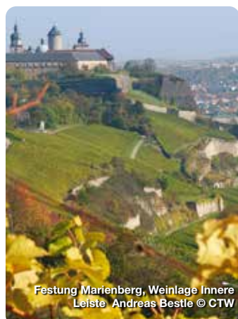
Festung Marienberg, Weinlage Innere Leiste Andreas Bestle © CTW