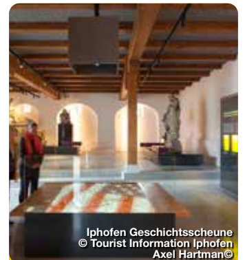
Iphofen Geschichtsscheune