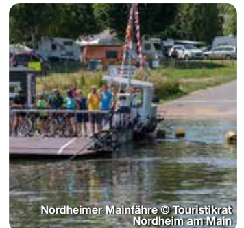
Nordheimer Mainfähre