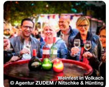
Weinfest in Volkach