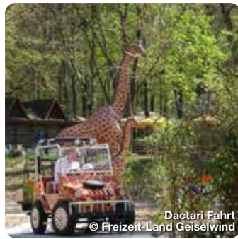
Dactari Fahrt