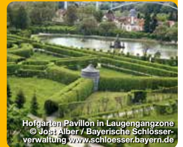
Hofgarten Pavillon in Laugengangzone