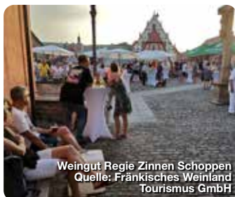
Weingut Regie Zinnen Schoppen

Fränkisches Weinland Tourismus GmbH Turmgasse 11, 97070 Würzburg www.fraenkisches-weinland.de