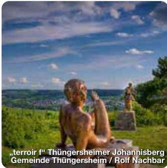
„terroir f“ Thüngersheimer Johannisberg Gemeinde Thüngersheim / Rolf Nachbar