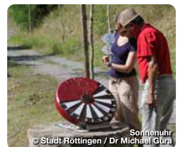
Sonnenuhr