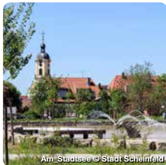
Am Stadtsee