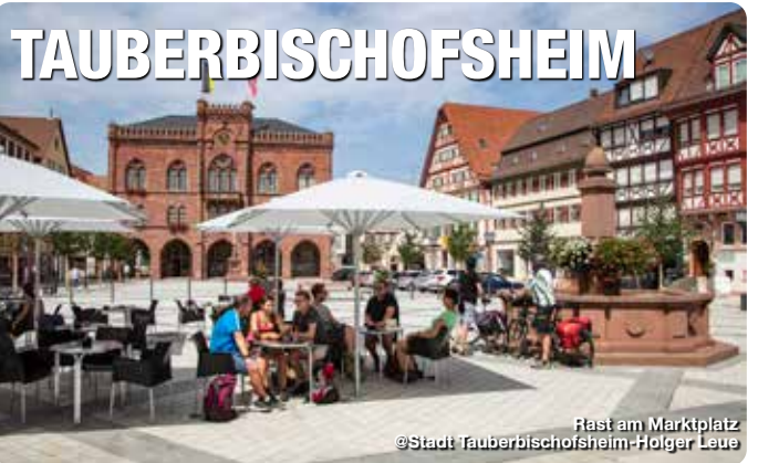
Rast am Marktplatz

Der Marktplatz mit dem neugotischen Rathaus bildet das Zentrum der Ferienstadt Tauberbischofsheim. Ob Glockenspiel, Marktveranstaltungen oder Feste – Urlauber und Einheimische halten sich gerne auf der neu gestalteten Fläche auf und genießen die Atmosphäre. Von hier aus lassen sich Stadtrundgänge wie zur Stadtkirche St. Martin, dem Schlossplatz mit dem Kurmainzischen Schloss sowie durch die verwinkelten Gassen der Altstadt unternehmen. Die neu sanierte Fußgängerzone lädt zum Flanieren und Bummeln geradezu ein. Die örtliche Gastronomie bietet gemütliche Rastmöglichkeiten.