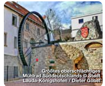
Größtes ober-schlächtiges Mühlrad Süddeutschlands