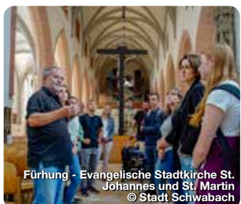
Führung - Evangelische Stadtkirche St. Johannes und St. Martin