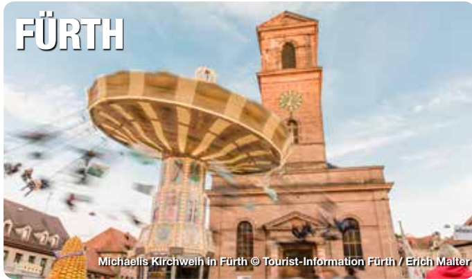
Michaelis Kirchweih in Fürth

Die Feste feiern, wie sie fallen? In Fürth geht das anders. Hier rauchen bei der Planung des Veranstaltungsjahres die Köpfe, um für Gäste einen Kalender mit vielfältigen Terminen zu entwickeln. Aushängeschild in Sachen Feiern ist die Michaelis-Kirchweih – Süddeutschlands größte Straßenkirchweih. Aber auch musikalisch, kulturell und in Sachen saisonales Marktgeschehen hält die Stadt eine Menge für ihre Besucherinnen und Besucher bereit. In Geschäften stöbern, spontan einkehren, gemütlich durchs Grüne schlendern: sich einfach mal treiben lassen. In der Stadt mit dem Kleeblatt im Wappen ist das problemlos möglich, denn Fürth ist eine Großstadt, der es keineswegs an Gemütlichkeit mangelt.