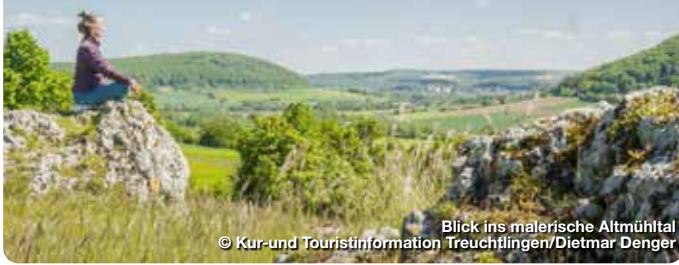
Blick ins malerische Altmühltal

Die Thermenstadt im Altmühltal, mit staatlich anerkanntem Heilwasser, steht für Gesundheit, Wohlbefinden und natürliche Entschleunigung. Neben dem reizarmen Klima der Mittelgebirgslandschaft schätzen Erholungssuchende das wohltuende Heilwasser der Altmühltherme. Es kommt aus 800 Metern Tiefe und ist 18.000 Jahre alt. Wer lieber sportlich aktiv ist, lässt sich bei einer Wander- oder Radtour von den Naturschönheiten des Naturparks Altmühltal verzaubern. Ob beim Waldbaden oder auf dem Mountainbike – Treuchtlingen ist der perfekte Ort, um in Balance zu bleiben, um achtsam umzugehen mit sich selbst, seiner Gesundheit und mit der Natur. Treuchtlingen lädt dich auf.