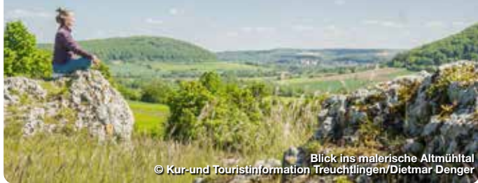
Blick ins malerische Altmühltal

Die Thermenstadt im Altmühltal, mit staatlich anerkanntem Heilwasser, steht für Gesundheit, Wohlbefinden und natürliche Entschleunigung. Neben dem reizarmen Klima der Mittelgebirgslandschaft schätzen Erholungssuchende das wohltuende Heilwasser der Altmühltherme. Es kommt aus 800 Metern Tiefe und ist 18.000 Jahre alt. Wer lieber sportlich aktiv ist, lässt sich bei einer Wander- oder Radtour von den Naturschönheiten des Naturparks Altmühltal verzaubern. Ob beim Waldbaden oder auf dem Mountainbike – Treuchtlingen ist der perfekte Ort, um in Balance zu bleiben, um achtsam umzugehen mit sich selbst, seiner Gesundheit und mit der Natur. Treuchtlingen lädt dich auf. TreffpunktDeutschland.de/treuchtlingen