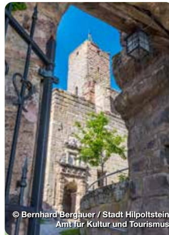
© Bernhard Bergauer / Stadt Hilpoltstein Amt für Kultur und Tourismus