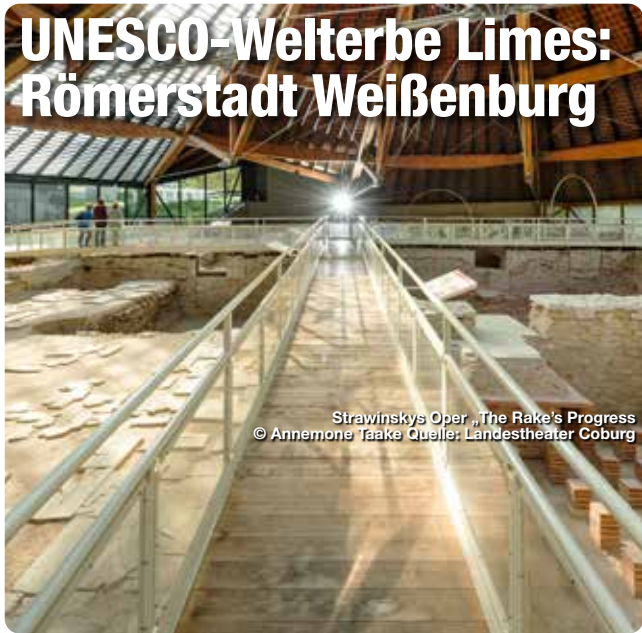
Strawinskys Oper „The Rake's Progress“

Mit dem teilrekonstruierten Kastell Biriciana, den Römischen Thermen und dem größten römischen Schatzfund in Deutschland ist Weißenburg Römerstadt par Excellence. Das Römermuseum der Stadt beherbergt zudem das Zentrale Bayerische Limes-Informationszentrum.