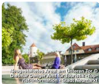
Neugestaltetes Areal am Unteren Tor