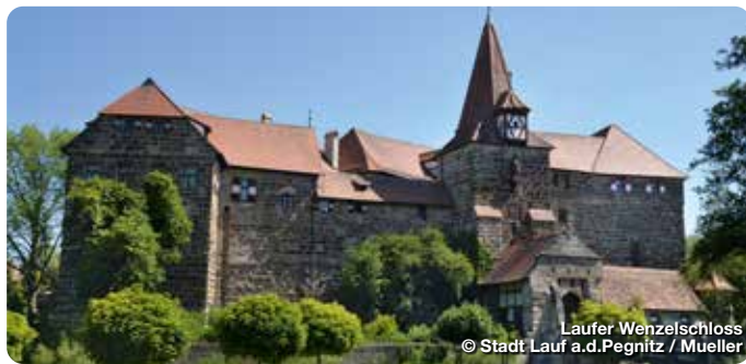
Lauffer Wenzelschloss

TreffpunktDeutschland.de/lauf-an-der-pegnitz