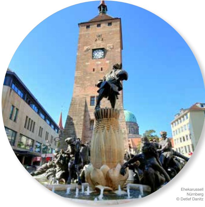
Ehekarussell Nürnberg © Detlef Danitz