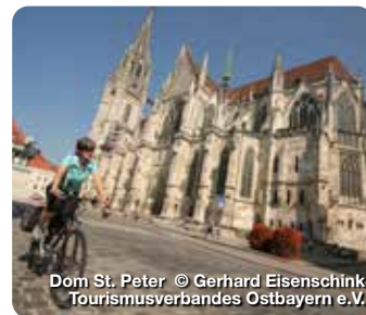
Dom St. Peter