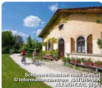
Schleutenhäuschen nach Dietfurt

Notre Dame 1, 85072 Eichstätt, Tel.: 08421 98760 info@naturpark-almuehltal.de , www.naturpark-almuehltal.de