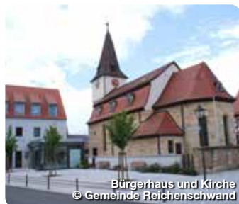
Bürgerhaus und Kirche © Gemeinde Reichenschwand