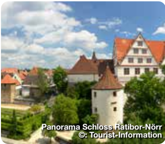
Panorama Schloss Ratibor-Nörr

Noch heute ist die damalige mittelalterliche Struktur im Stadtbild, mit der an vielen Stellen erhaltenen Stadtmauer, und dem breit ausladenden Markt als Zentrum, umrahmt von stattlichen Bürgerhäusern, gut abzulesen. TreffpunktDeutschland.de/roth