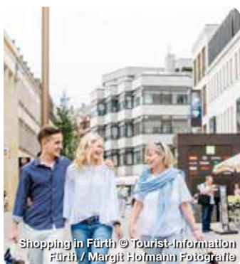
Shopping in Fürth

Und wenn Sie genug von der Stadt haben, dann ist es egal, in welche Himmelsrichtung Sie sich auf den Weg machen. Nürnberg ist von allen Seiten umgeben von einzigartigen Landschaften, hübschen Städtchen, Wander- und Sportangeboten oder einfach ideal für eine Spazierfahrt in das Umland - mit dem Auto oder mit öffentlichen Verkehrsmitteln.