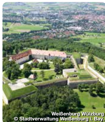
Weißenburg Wülzburg