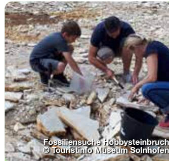
Fossilensuche Hobbysteinbruch