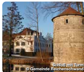
Schloß mit Turm