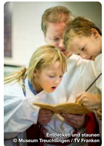
Entdecken und staunen

Quelle purer Lebenslust. Baden und saunieren im wohligen warmen, 18.000 Jahre alten, zertifizierten und staatlich anerkannten, Heilwasser nach balneologischen Grundsätzen. Die Altmühltherme ist der perfekte Ort für Entschleunigung, Gesundheit, Prävention und Wellness. Für kulinarische Genussmomente sorgen das Thermenrestaurant sowie die Wasserbar im Thermalbecken. Bürgermeister-Döbler-Allee 12, Treuchtlingen