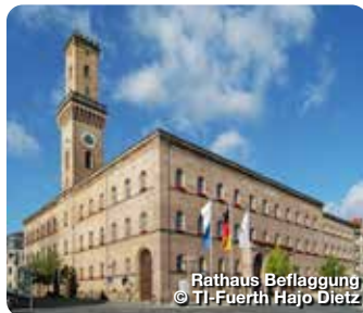
Rathaus Beflaggung