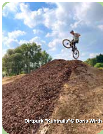
Dirtpark "Kuhtrails"