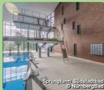
Sprungturm Südstadtbad