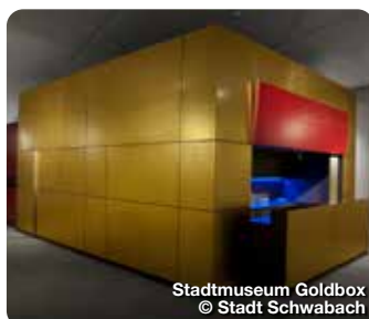
Stadtmuseum Goldbox