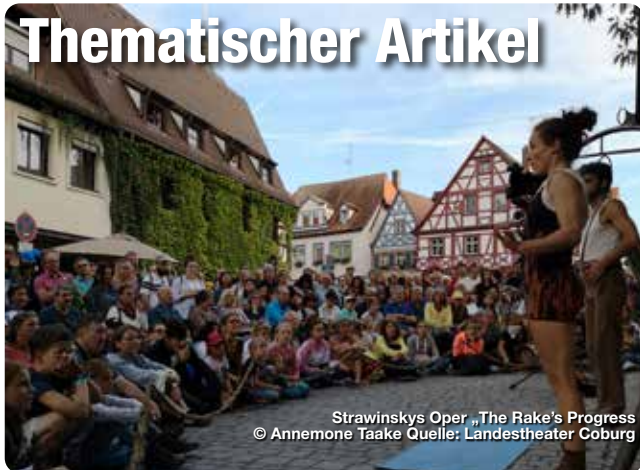
Strawinskys Oper „The Rake's Progress“

Lorem ipsum dolor sit amet, consectetur adipiscing elit. Aenean commodo ligula eget dolor. Aenean massa. Cum sociis natoque penatibus et magnis dis parturient montes, nascetur ridiculus mus. Donec quam felis, ultricies nec, pellentesque eu, pretium quis, sem. Nulla consequat massa quis enim. Donec pede justo, fringilla vel, aliquet nec, vulputate eget, arcu. In enim justo, rhoncus ut, imperdiet a, venenatis vitae, justo. Nullam dictum felis eu pede