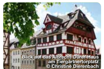
Blick auf das Albrecht-Dürer-Haus am Tiergärtnerplatz

Hier wird die Welt der Nürnberger Handelsfamilien des 16. Jahrhunderts lebendig. Die Sammlung aus dem Besitz der Patrizierfamilie Tucher zeigt wertvolle Möbel, Tapisserien, Gemälde und Kunsthandwerk. Der malerische Renaissancegarten lädt zum Picknick ein. Hirschelgasse 9-11, 90403 Nürnberg