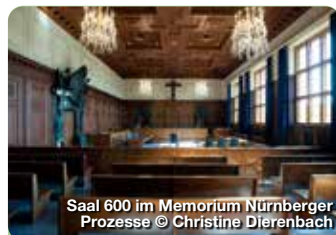
Saal 600 im Memorium Nürnberger Prozesse

Unter den Nationalsozialisten wurde Nürnberg zur „Stadt der Reichsparteitage“. Auf dem ehemaligen Reichsparteitagsgelände zeugen noch heute die Reste der damals errichteten Großbauten von der herausragenden Bedeutung der Stadt für die NS-Propaganda. Die hier abgehaltenen „Reichsparteitage“ sollten als gewaltige Massenveranstaltungen zur Inszenierung der „Volksgemeinschaft“ dienen. In der unvollendet gebliebenen Kongresshalle erlaubt das Dokumentationszentrum einen kritischen Blick auf die Geschichte des Ortes. Bayernstraße 110, Nürnberg