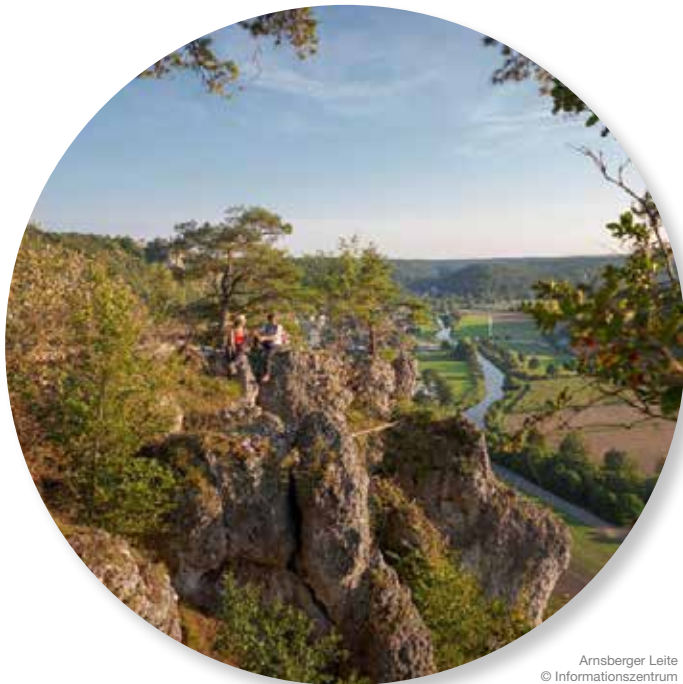
Arnsberger Leite