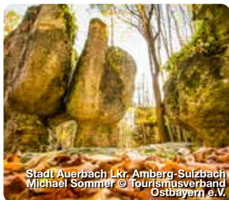
Stadt Auerbach Lkr. Amberg-Weilburg Michael Sommer © Tourismusverband Ostbayern e.V.

Im Gewerbepark D 02, 93059 Regensburg, Tel.: 0941 585390 info@ostbayern-tourismus.de, bayerischerjura.de