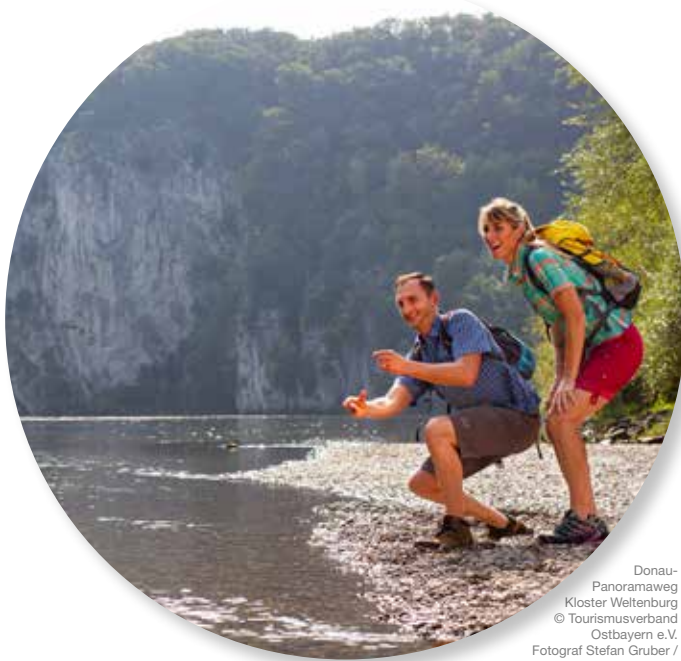
Donau-Panoramaweg Kloster Weltenburg