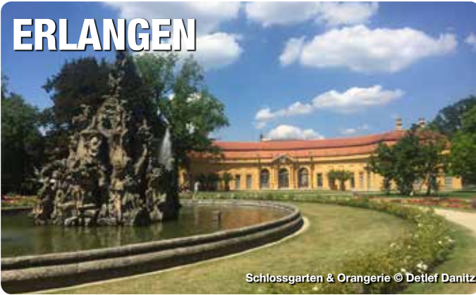
Schlossgarten & Orangerie

Französisches „Savoir-vivre“ in Franken: Zu einer der besterhaltenen barocken Planstädte Deutschlands zählt die Hugenottenstadt Erlangen. Von Markgraf Christian Ernst errichtet, ist die Stadt gegenwärtig ein Denkmal von europäischem Rang. Die lebendige Innenstadt, die aus der im 17. Jahrhundert errichteten Neustadt „Christian Erlang“ hervorgeht, ist heute ein Treffpunkt für Jung und Alt. Geprägt von internationalem Flair, das bereits seit der Hugenottenzeit besteht, ist Erlangen die kleinste bayerische Großstadt. Barocke Bauten, markgräfliche Pracht, moderne Architektur und viele Grünflächen laden Gäste und Einheimische zum Genießen und Verweilen ein. TreffpunktDeutschland.de/erlangen