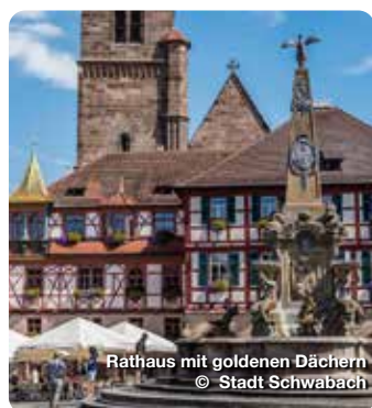
Rathaus mit goldenen Dächern