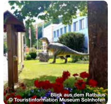
Blick aus dem Rathaus