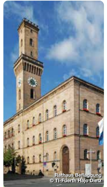
Rathaus Beflaggung