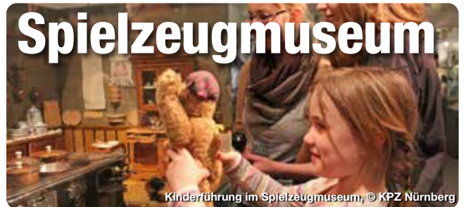
Kinderführung im Spielzeugmuseum

Seit dem Mittelalter ist Nürnberg die Stadt des Spielzeugs. Mit einer Fülle außergewöhnlicher Exponate von der Antike bis zur Gegenwart zeigt das weltberühmte Museum auf 1.400 Quadratmeter Fläche die „Welt im Kleinen“ und gibt so Einblick in die Lebenswelt vergangener Jahrhunderte: Zu sehen sind Puppen, Kaufläden, Zinnfiguren und Blechspielzeug, traditionelles Holzspielzeug und eine Modellbahnanlage der Spur S, aber auch