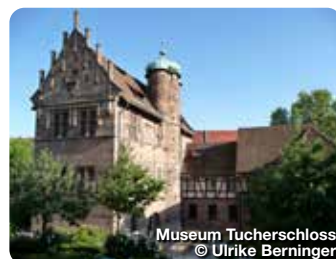
Museum Tucherschloss

Spielwaren der jüngeren Vergangenheit wie Lego, Barbie, Playmobil oder Matchbox. Der fantasievoll gestaltete Kinderbereich im Dachgeschoss kann für Kindergeburtstage angemietet werden. Im Sommer locken außerdem ein großer Spielplatz im Freien und das Museumscafé im lauschigen Innenhof. Durchs Haus führen Audioguides für Groß und Klein sowie eine lustige Bilderrallye. Karlstraße 13-15, Nürnberg