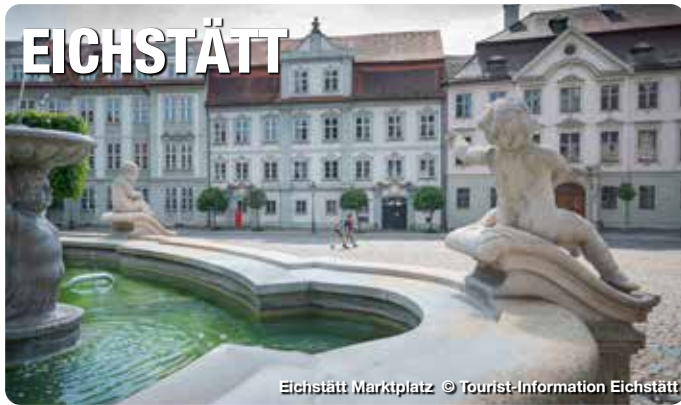
Eichstätt Marktplatz

Ehrwürdige Klöster, reich geschmückte Kirchen, prachtvolle Residenzen und außergewöhnliche Kulturschätze: Mitten im Zentrum des Naturparks Altmühltal liegt die barocke Universitätsstadt Eichstätt. Durch ihre kunstvoll gestalteten Plätze und kleinen Gassen bringt sie italienisches Flair in die Urlaubsregion. Wahrzeichen der Stadt ist die hoch auf einem Berg liegende Willibaldsburg mit ihrem bekannten Jura-Museum und dem Bastionsgarten, der das Erbe des berühmten „Hortus Eystettensis“ zum Erläutern bringt. Der Hofgarten der Sommerresidenz und Biotopgarten des Informationszentrums Naturpark Altmühltal sind die grünen Oasen in der Stadt.