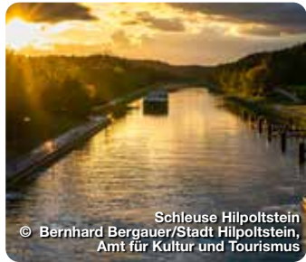
Schleuse Hilpoltstein