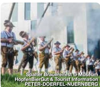
Spalter Brauereifest