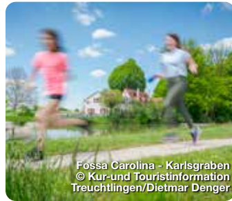
Fossa Carolina - Karlsgraben