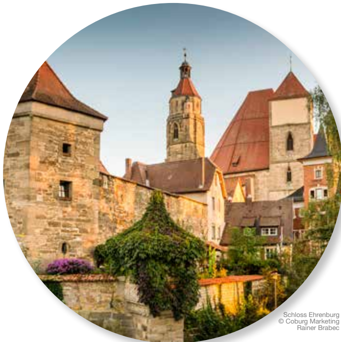
Schloss Ehrenburg