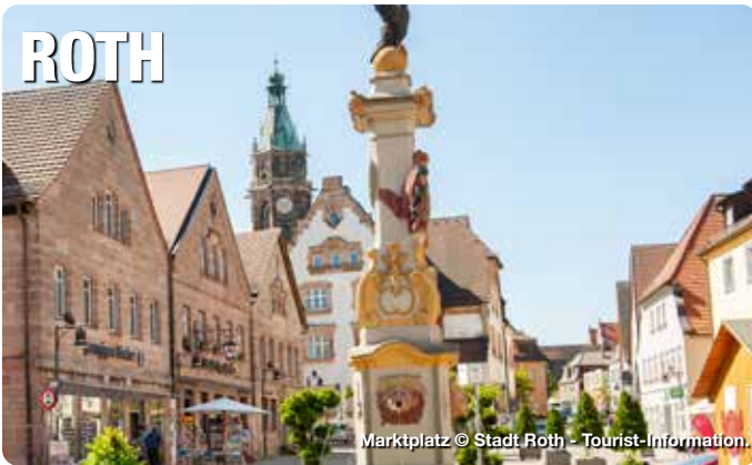
Marktplatz © Stadt Roth - Tourist-Information.

Inmitten des Fränkischen Seenlandes und nur 7 km vom Rothsee entfernt, liegt die Kreisstadt Roth. Unsere Stadt blickt auf eine lange Geschichte zurück. Erstmals urkundlich erwähnt wurde sie im Jahre 1060, als Bischof Gundekar II von Eichstätt eine Kirche zu „Rote“ weihte – und feierte somit 2010 950-jähriges Stadtjubiläum. In der Mitte des 14. Jahrhunderts erfolgte die Verleihung der Stadtrechte.