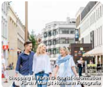
Shopping in Fürth