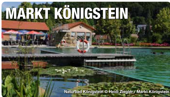
Naturbad Königstein

Wer Zeit mitbringt, kann Königstein als einen Ort wahrnehmen, der für alle Sinne Genussmomente bereithält. In der natürlichen ursprünglichen Landschaft laden Wälder, Wiesen und Höhlen zum Wandern und Erkunden ein. Besondere Kleinode sind der Botanische Lehrpfad, die aus der zweiten Hälfte des 12. Jahrhundert stammende Breitensteinkapelle und das herrliche Naturbad. Vom Aussichtsturm auf dem Ossinger (653 m) genießt man einen sagenhaften Ausblick. Sportbegeisterte finden optimale Bedingungen zum Klettern, Reiten, Mountainbiken und am 3D-Bogenparcours. Der Markt Königstein besticht auch durch seine weithin bekannte ausgezeichnete Gastronomie.