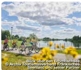
Blick über den Brombachsee

Tourismusverband Fränkisches Seenland Postfach 1365, 91703 Gunzenhausen Tel. 0980 94141, www.fraenkisches-seenland.de