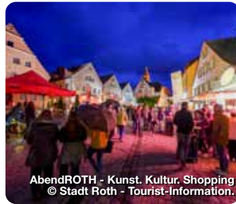
AbendROTH - Kunst, Kultur, Shopping © Stadt Roth - Tourist-Information.