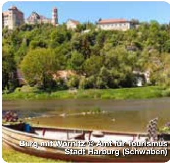
Burg mit Wörnitz