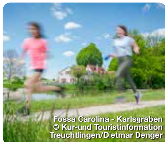
Fossa Carolina - Karlsgraben