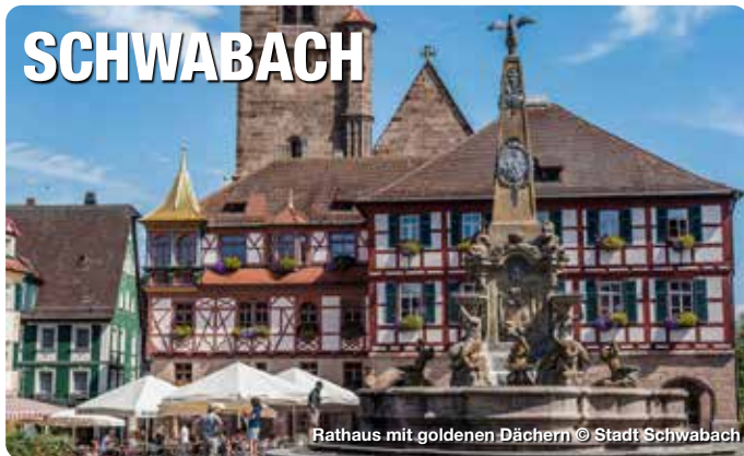
Rathaus mit goldenen Dächern

Die Goldschlägerstadt. Schwabach ist das europäische Zentrum der Blattgoldherstellung. Erleben Sie in der Goldschläger-Schauwerkstatt, wie aus einem kleinen Goldbarren, in mehreren Arbeitsschritten, hauchdünnes Blattgold in einer Stärke von gerade einmal einem 10.000stel Millimeter entsteht. Die Zeugnisse von Schwabachs traditionellem Handwerk finden Sie an vielen Stellen in der Altstadt. Ob auf den goldenen Türmen des Rathauses, dem Hochaltar in der Stadtkirche oder an Fassaden von Häusern und auf modernen Kunstwerken - Schwabach zeigt stolz seine goldene Tradition.