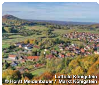
Luftbild Königstein

TreffpunktDeutschland.de/markt-konigstein