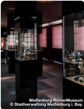
Weißenburg RömerMuseum