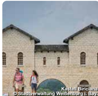
Kastell Biriciana

Doktor-Martin-Luther-Platz 3-5 Weißenburg in Bayern