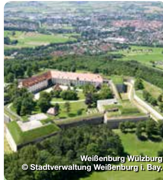
Weißenburg Wülzburg

Martin-Luther-Platz 3-5, Weißenburg i. Bay.