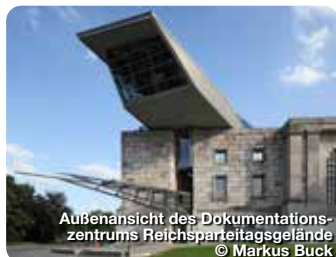
Außenansicht des Dokumentationszentrums Reichsparteitagsgelände

Eine ehemalige Schraubenfabrik aus den 1920er Jahren beherbergt heute das Museum Industriekultur. Hier dreht sich alles um die Geschichte der Industrialisierung in Nürnberg vom 19. Jahrhundert bis zum Strukturwandel in der Gegenwart. Arbeit und Alltag früherer Zeiten werden wieder lebendig: Ausstellungsstücke werden zu Akteuren und Besucher zu Entdeckern. Groß und Klein dürfen bei den spannenden Vorführungen der historischen Bleistiftwerkstatt zusehen und in der Druckerei sogar selbst Hand anlegen. In Lernlaboren können die kleinen Gäste nach Herzenslust forschen und experimentieren sowie Computerspiele von gestern und heute ausprobieren. In der Motorradsammlung lebt die große Zeit Nürnbergs als Ort der Zweiradproduktion auf. Äußere Sulzbacher Str. 62, Nürnberg