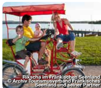
Rikscha im Fränkischen Seenland