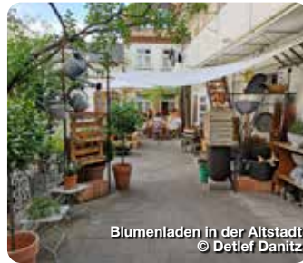
Blumenladen in der Altstadt