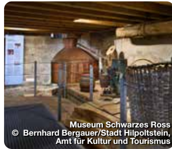
Museum Schwarzes Ross