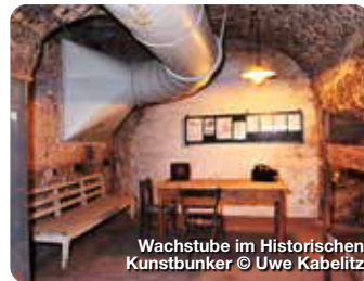
Wachstube im Historischen Kunstbunker

Im Schwurgerichtssaal des Nürnberger Justizpalasts wurde Weltgeschichte geschrieben. Vom 20. November 1945 bis 1. Oktober 1946 mussten sich hier führende Vertreter des nationalsozialistischen Regimes vor einem internationalen Gericht für ihre Taten verantworten. Das Verfahren hatte maßgeblichen Einfluss auf die Entwicklung des Völkerstrafrechts. Bis heute ist der Saal 600 ein symbolträchtiger Ort. im Dachgeschoss des Schwurgerichtsgebäudes befindet sich eine Informations- und Dokumentationsstätte. Bärenschanzstraße 72, Nürnberg