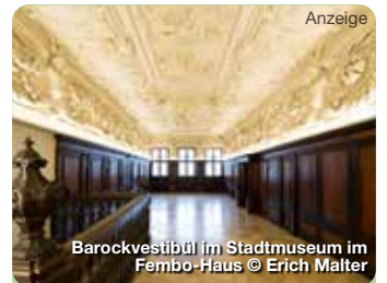
Barockvestibül im Stadtmuseum im Fembo-Haus

Kurz vor dem Ausbruch des Zweiten Weltkriegs wurde einer der Felsenkeller unter dem Nürnberger Burgberg zu einem massiven Kunstbunker ausgebaut. Darin überdauerten einige der bedeutendsten Nürnberger Kunstwerke. Ob. Schmiedgasse 52, Nürnberg