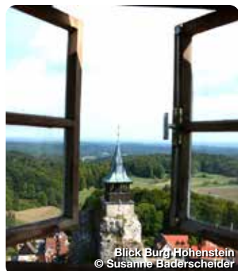
Blick Burg Hohenstein