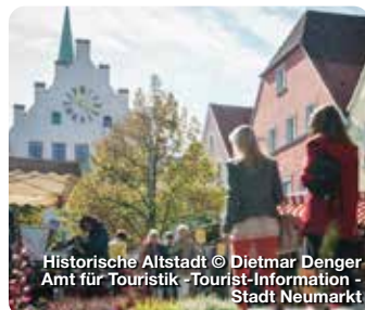
Historische Altstadt