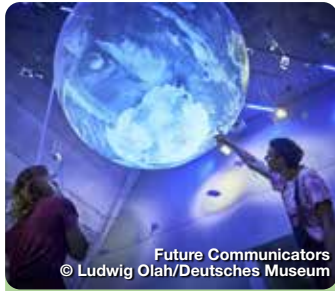
Future Communicators