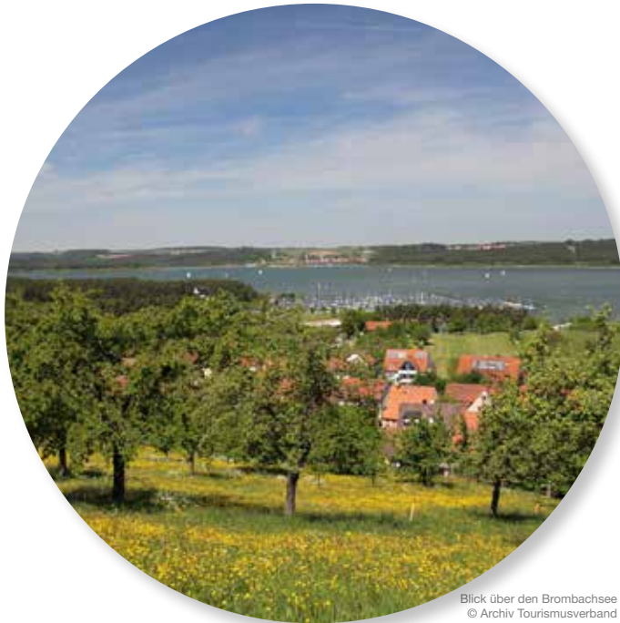
Blick über den Brombachsee