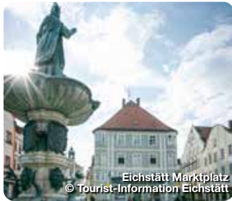
Eichstätt Marktplatz