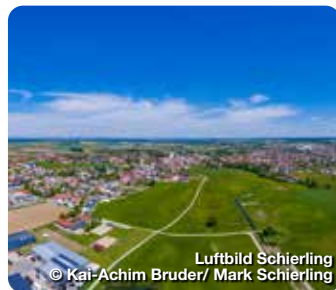
Luftbild Schierling