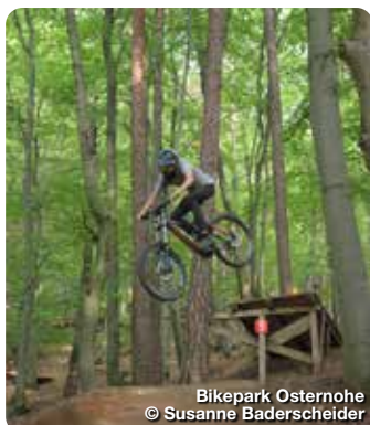
Bikepark Osternohe

Waldluststraße 1, Lauf a. d. Pegnitz, Tel.: 09151 2161 urlaub@nuernberger-land.de, urlaub.nuernberger-land.de