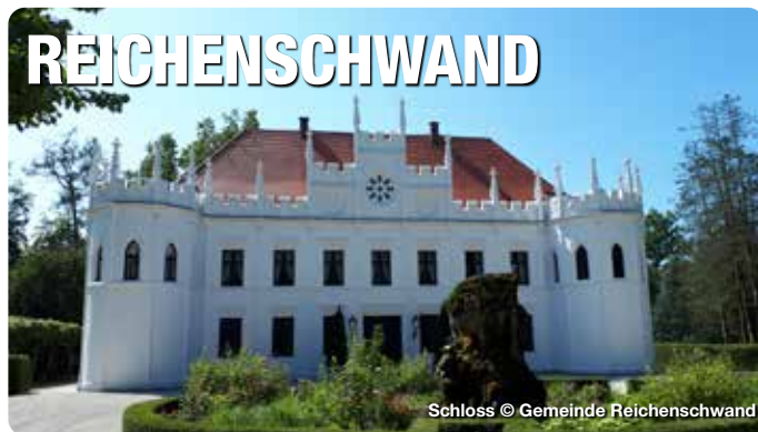
Schloss © Gemeinde Reichenschwand

Vom Herrnsitz zum Museum. Das Weiße Schloss in Heroldsberg wurde um 1478 als Herrnsitz der Nürnberger Patrizierfamilie Geuder erbaut. Das Weiße Schloss ist inzwischen im Besitz des Marktes Heroldsberg und diente im 20. Jahrhundert lange als Rathaus, bevor es nach umfangreicher Sanierung zu einem Museum umgestaltet wurde. Aufgrund der Geschichte des Hauses befasst sich ein wesentlicher Teil der Ausstellungen mit dem Leben und Wirken der Geuder. Gezeigt werden neben Portraits der Familie Geuder mittelalterliche Urkunden zum Beispiel mit der Originalunterschrift von Kaiser Leopold I., Bücher, historische Landkarten, genealogische Darstellungen und mehr. Im Festsaal im 2. Obergeschoss finden auch Trauungen, Konzerte und Lesungen statt. Ein weiteres Thema des Museums ist die interessante Ortsgeschichte Heroldsbergs vom 12. Jahrhundert bis in die Gegenwart, die ebenfalls stark von den Geudern als Ortsherrn geprägt wurde. Auch ein Stück deutscher Wirtschafts- und Industriegeschichte wird erzählt, schließlich wurde in Heroldsberg das Tempo-Taschentuch erfunden. Ein weiterer Themenkomplex ist dem Künstler Fritz Griebel gewidmet, der aus Heroldsberg stammte. Griebel war freischaffender Künstler, später Professor an der Akademie der Bildenden Künste in Nürnberg und nach dem 2. Weltkrieg deren Direktor. Wechselnde Ausstellungen zeigen Ölgemälde und Aquarelle des Künstlers, aber auch Grafiken und Scherenschnitte. Kirchenweg 4,90562 Heroldsberg