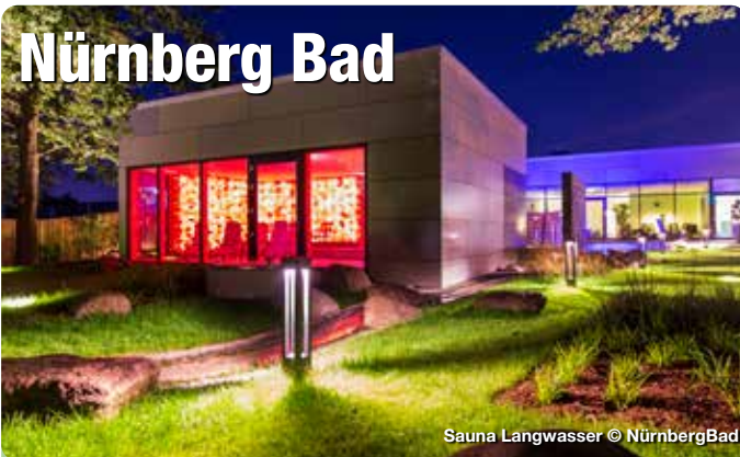
Sauna Langwasser

Die Bäder der Stadt Nürnberg laden mit ihren vielseitigen Möglichkeiten herzlich ein, den Alltag im wahrsten Sinne des Wortes ins Wasser fallen zu lassen! Schwimmer- und Nichtschwimmerbecken, Kleinkindbereiche, Rutschen und Sprungtürme lassen keine Wünsche offen.