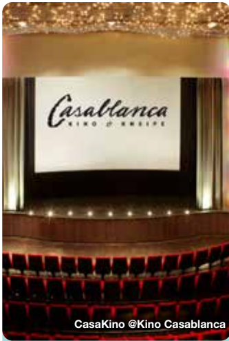
CasaKino @Kino Casablanca