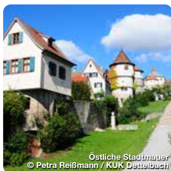
Östliche Stadtmauer

Ein schönes altfränkisches Kleinstädtchen am Fuße des Schwanberges. Die Altstadt, mit dem Rathaus (1548) und seinem historischem Sitzungssaal und den vielen weiteren Baudenkmälern, wird umgeben von der gut erhaltenen Stadtmauer mit 18 Türmen und 2 Stadttoren. Vor dem „Unteren Tor“ liegt der denkmalgeschützte Friedhof mit Renaissanceportal, freistehender Steinkanzel und den Arkaden. Die Grabengärten vor der südlichen Stadtmauer laden zum Spazieren ein. Wer die Umgebung erkunden möchte, kann auf dem Bernemer Weinwanderweg mit 3,5 km oder den Kinderwanderweg „Bäresweg“ mit ca. 2,5 km oder 3,5 km, wandern. TreffpunktDeutschland.de/mainbernheim