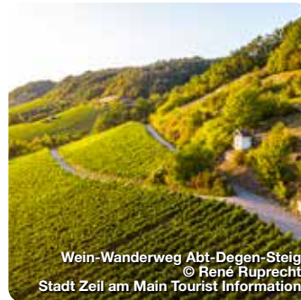
Wein-Wanderweg Abt.-Degen-Steig