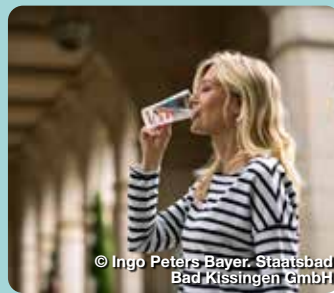
© Ingo Peters Bayer, Staatsbad Bad Kissingen GmbH