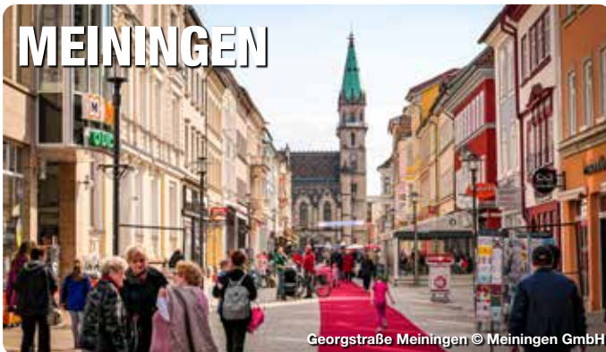
Georgstraße Meiningen

Zwischen Rhön und Thüringer Wald im Werratal gelegen, ist Meiningen die Städteperle Südthüringens. Umgeben von Wäldern mit vielfältigen Wander- und Radwegen, beeindruckt die Stadt mit ihrer mondänen klassizistischen Architektur, einzigartigen Naturdenkmälern, bedeutsamer Kulturgeschichte und einem modernen, vielseitigen Stadtleben. Neben internationalen Besonderheiten wie dem Staatstheater, dem Dampflokwerk, dem Schloss Elisabethenburg oder der Goetz-Höhle, Europas größter begehrter Kluft- und Spaltenhöhle, prägen zwei großzügige Landschaftsparks sowie die Bleichgräben, die harfenförmig das Stadtzentrum umfließen, und architektonische Kleinode Meinings einzigartiger Charakter. TreffpunktDeutschland.de/meiningen