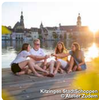
Kitzingen StadtSchoppen