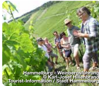
Hammelburg - Weinbergsführung

An den sanften Hängen des Saaletals hat der Weinbau eine lange Tradition. Seit 777 werden hier Reben angebaut und edle Weine produziert, die man am besten bei einer Weinprobe oder einem der geselligen (Wein-)Feste genießt. Die Geschichte Hammelburgs ist fest mit dem Wein verbunden und das wird fast überall spürbar. Ob bei einer kurzweiligen Stadtführung durch die idyllische Altstadt mit ihren engen Gässchen, im Museum Herrenmühle oder in den historischen Gebäuden, wie dem barocken Kellereischloss. Die einzigartige Landschaft ist nicht nur prädestiniert für den Weinanbau, Erholungssuchenden bietet sie mit ihren vielfältigen Möglichkeiten eine Auszeit. TreffpunktDeutschland.de/hammelburg