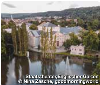
Staatstheater, Englischer Garten

Zwischen Rhön und Thüringer Wald im Werratal gelegen, ist Meiningen die Städteperle Südthüringens. Umgeben von Wäldern mit vielfältigen Wander- und Radwegen, beeindruckt die Stadt mit ihrer mondänen klassizistischen Architektur, einzigartigen Naturdenkmälern, bedeutsamer Kulturgeschichte und einem modernen, vielseitigen Stadtleben. Neben internationalen Besonderheiten wie dem Staatstheater, dem Dampflokwerk, dem Schloss Elisabethenburg oder der Goetz-Höhle, Europas größter begehrter Kluft- und Spaltenhöhle, prägen zwei großzügige Landschaftsparks sowie die Bleichgräben, die harfenförmig das Stadtzentrum umfließen, und architektonische Kleinode Meinings einzigartiger Charakter. TreffpunktDeutschland.de/meiningen