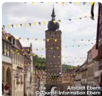
Altstadt Ebern