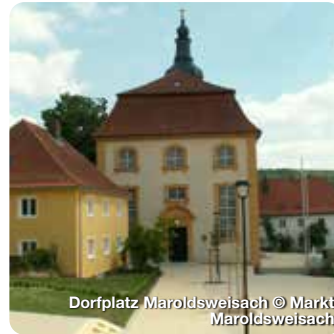
Dorfplatz Maroldsweisach

Lorem ipsum dolor sit amet, consectetur adipiscing elit. Aenean commodo ligula eget dolor. Aenean massa.