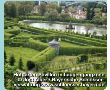
Hofgarten Pavillon in Laugengangzone