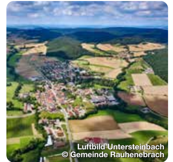
Luftbild Untersteinbach