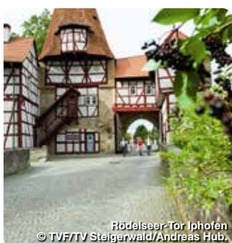
Rödelseer-Tor Iphofen

Hauptstraße 10-12, 91443 Scheinfeld, Tel.: 09162 57549990, kontakt@steigerwaldtourismus.com www.steigerwaldtourismus.com