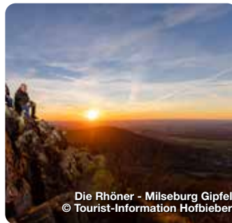
Die Rhöner - Milseburg Gipfel

Aenean commodo ligula eget dolor. Aenean massa. Cum sociis natoque penatibus et magnis dis parturient montes, nascetur ridiculus mus. Donec quam felis, ultricies nec, pellentesque eu, pretium quis, sem. Null. Donec pede justo, fringilla vel, alint. TreffpunktDeutschland.de/ortsname