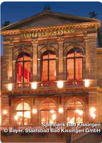
Spielbank Bad Kissingen