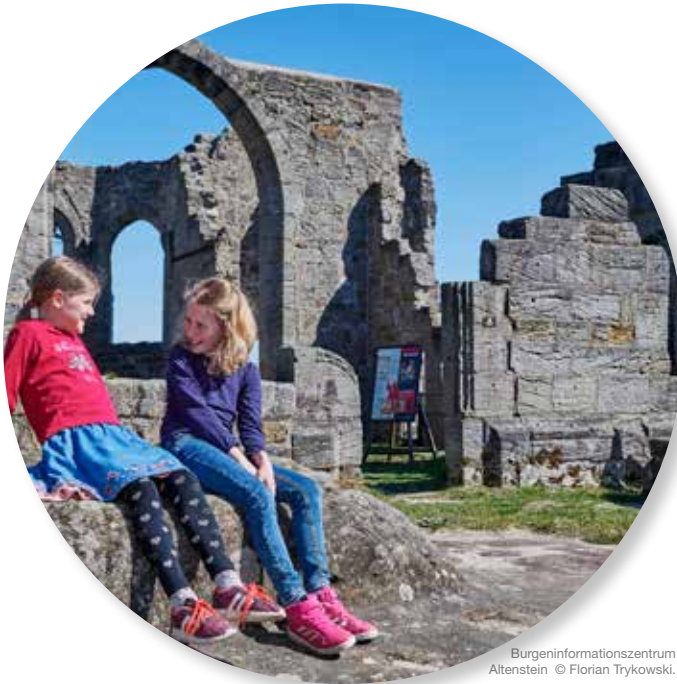
Burgeninformationszentrum Altenstein © Florian Trykowski.

Fernab vom Alltagsstress stoßen Wanderer und Radfahrer im Naturpark Haßberge auf einst mächtige, geschichtsumwobene Burgen, mystische Burgruinen und romantische Schlösser. 22 Erlebnistouren am Burgen- und Schlösser-Wanderweg laden Abenteurer und Naturliebhaber zum Erkunden ein. Einen besonderen Einblick in das Leben und den Alltag auf einer mittelalterlichen Burg ermöglicht die Dauer-Ausstellung „Entdecke das Mittelalter“ im Burgeninformationszentrum der Burg Altenstein mit 14 Erlebnisstationen. Seit 2021 gehören einige Orte im Naturpark auch zu der Regionalroute „Franken – Genuss mit Wein und Bier“, die zur Deutschen Fachwerkstraße gehört. Die historischen Altstädte mit ihrer Fachwerkromantik laden dort, wo Bier- und Weinfranken sich treffen, zur Einkehr mit regionalen Köstlichkeiten ein.