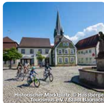
Historischer Marktplatz