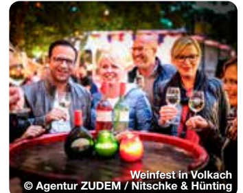
Weinfest in Volkach