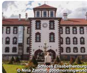
Schloss Elisabethenburg