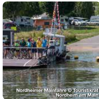
Nordheimer Mainfähre