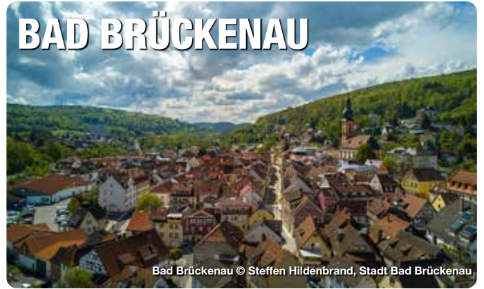
Bad Brückenau

Umgeben von herrlicher Natur, im Tal des Flusses Sinn, liegt die kleine Stadt Bad Brückenau. Hier im Herzen Deutschlands, im Norden Bayerns, hat sich über Jahrhunderte eine ganz besondere Gastfreundschaft entwickelt. Diese liegt in der Tradition des Ortes begründet. Schon seit Jahrhunderten kommen Gäste und Besucher, um hier die heilenden Kräfte der Natur und der sieben Heilquellen zu nutzen. Als Besonderheit gibt es in Bad Brückenau gleich zwei Heilbäder. Dazu gehören der Kurbetrieb im Zentrum, sowie im Bayerischen Staatsbad, in einem nur drei Kilometer entfernten Stadtteil.