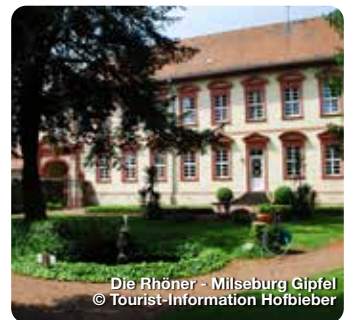
Die Rhöner - Milseburg Gipfel