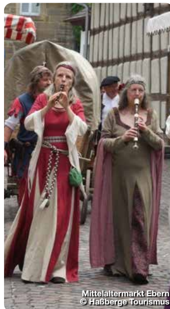
Mittelaltermarkt Ebern