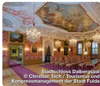
Stadtschloss Dalbergsaal