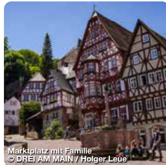
Marktplatz mit Familie

TreffpunktDeutschland.de/marktheidenfeld