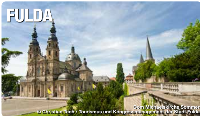
Dom Michaeliskirche Sommer

In Fulda ist der Glanz des Barock lebendig. Prächtige Bauund Kunstdenkmäler bedeutender Architekten künden im Barockviertel der einstigen Residenzstadt vom Ruhm und von der Pracht der Fuldaer Fürststäbte und Fürstbischöfe, die im 18. Jahrhundert weltliche und geistliche Macht vereinten. Das Erkunden der historischen Sehenswürdigkeiten aus jener glanzvollen Epoche wird für Gruppen und Einzelreisende In Hessens schönster Barockstadt zu einem Erlebnis. Das bekannteste Wahrzeichen Fuldas ist der Dom St. Salvator. Johann Dientzenhofer erbaute das Gotteshaus im Stil des italienischen Barock. Seit der Erhebung der Fürststabeitei zum Fürstbistum Fulda 1752 ist der Sakralbau Bischofsund Kathedralkirche. TreffpunktDeutschland.de/fulda