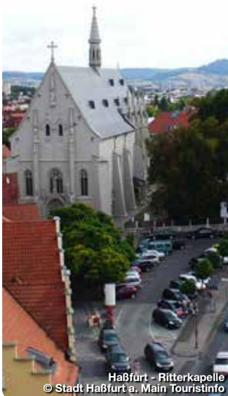
Haßfurt - Ritterkapelle

Marktplatz 1, 97461 Hofheim i.Ufr. 09523 5033710, info@hassberge-tourismus.de www.hassberge-tourismus.de