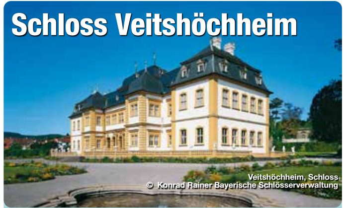
Veitshöchheim, Schloss

Der 1680 bis 1682 erbaute Sommersitz der Würzburger Fürstbischöfe wurde 1753 durch Balthasar Neumann vergrößert. 1806 bis 1814 war das Schloss in den Sommermonaten von Großherzog Ferdinand von Toskana bewohnt, der in dieser Zeit in Würzburg residierte. Seit 1814 ist das Schloss im Besitz der Bayerischen Krone und wurde im 19. Jahrhundert von der königlichen Familie ebenfalls als Sommerschloss genutzt. Erst durch die Restaurierung von 1931/32 wurden alle Räume des Obergeschosses wieder als historische Schauräume ausgestattet und der Öffentlichkeit als Museum geöffnet. Echterstrasse 10, Veitshöchheim