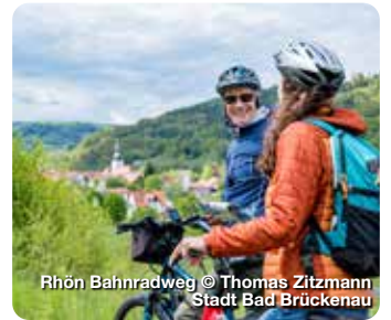
Rhön Bahnradweg © Thomas Zitzmann Stadt Bad Brückenau