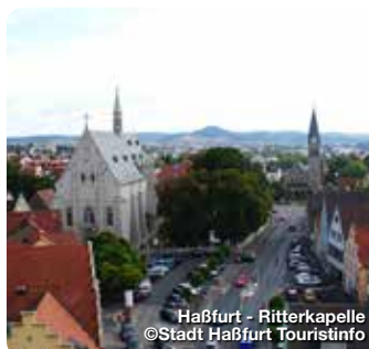
Haßfurt - Ritterkapelle