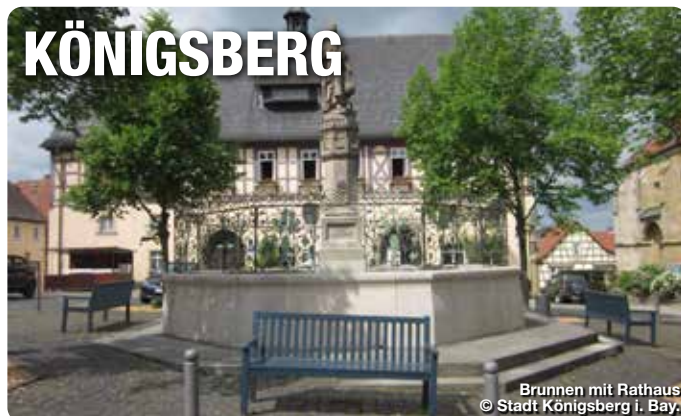
Brunnen mit Rathaus