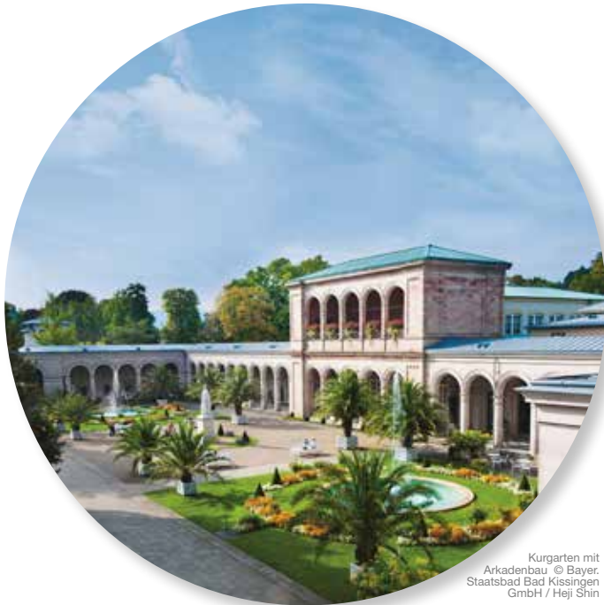
Kurgarten mit Arkadenbau