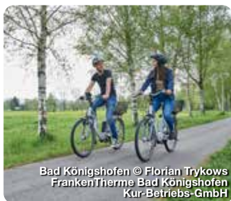
Bad Königshofen © Florian Trykows FrankenTherme Bad Königshofen Kur-Betriebs-GmbH

TreffpunktDeutschland.de/bad-koenigshofen