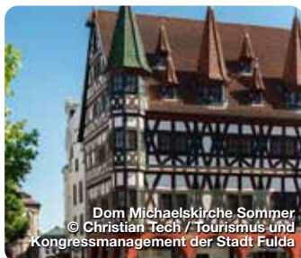
Dom Michaeliskirche Sommer

In Fulda ist der Glanz des Barock lebendig. Prächtige Bauund Kunstdenkmäler bedeutender Architekten künden im Barockviertel der einstigen Residenzstadt vom Ruhm und von der Pracht der Fuldaer Fürststäbte und Fürstbischöfe, die im 18. Jahrhundert weltliche und geistliche Macht vereinten. Das Erkunden der historischen Sehenswürdigkeiten aus jener glanzvollen Epoche wird für Gruppen und Einzelreisende In Hessens schönster Barockstadt zu einem Erlebnis. Das bekannteste Wahrzeichen Fuldas ist der Dom St. Salvator. Johann Dientzenhofer erbaute das Gotteshaus im Stil des italienischen Barock. Seit der Erhebung der Fürststabeitei zum Fürstbistum Fulda 1752 ist der Sakralbau Bischofsund Kathedralkirche. TreffpunktDeutschland.de/fulda