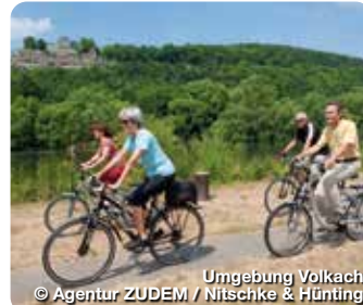
Umgebung Volkach

Willkommen im Herzen des Fränkischen Weinlands, an der Volkacher Mainschleife! Erleben Sie Volkach als historisch, kulinarisch und kulturell attraktives Ausflugsziel zwischen Würzburg und Bamberg. Die Weinstadt ist das Zentrum der Mainschleife und hat eine über 1.100jährige Ortsgeschichte, ganz im Zeichen des Frankenweins, vorzuweisen. Rund ein Viertel der fränkischen Rebfläche werden an der Mainschleife bewirtschaftet. Vier Winzergenossenschaften und über 150 selbstvermarktende Winzer sind hier im Umkreis von 15 Kilometern beheimatet. Die Mainschleife ist das größte zusammenhängende Weinanbaugebiet in Franken. TreffpunktDeutschland.de/volkach