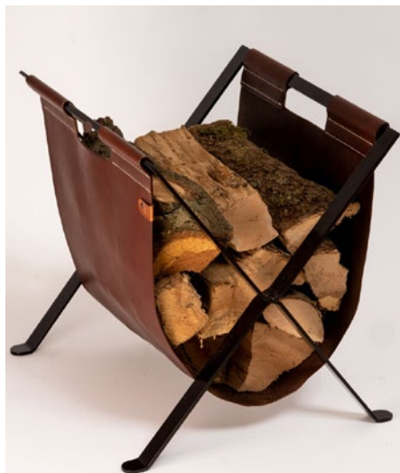
(Bild rechts) X-Basket, zum Aufbewahren von Holz, Zeitschriften und Wolldecken oder anderes.