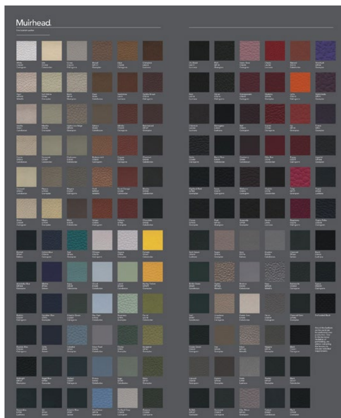
Neue Farbkarte Muirhead

Wie bereits letztes Jahr angekündigt gab es einige Änderungen bei der Lederkollektion von Muirhead. Die neue Farbkarte ist bei uns erhältlich. Bei den Artikeln CALEDONIAN, GRAMPIAN, SATEEN, METALLIC und LUSTRANA wurden zum Teil einzelne Farben aus dem Programm genommen und teilweise durch neue Farben ersetzt. Das Leder CAIRNGORM entspricht dem vormaligen INGLESTON. Nicht nur der Name änderte, sondern auch das Narbenbild und Finish des Leders.