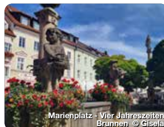
Marienplatz - Vier Jahreszeiten Brunnen