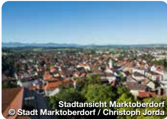
Stadtansicht Marktoberdorf