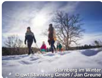
Starnberg im Winter