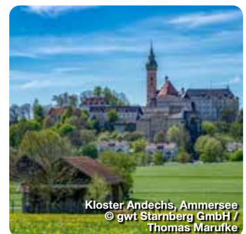
Kloster Andechs, Ammersee

Das 2018 komplett umgebaute Hallenbad bietet gleich mehrere Highlights. Neben dem 25-Meter-Becken mit zwei Sprungtürmen, gibt es ein separates Lehrschwimmbecken und ein Kleinkinderbecken. Kinder und Jugendliche verbringen die meiste Zeit auf der 45-Meter-Wasserrutsche, für die ganz Kleinen gibt es noch zwei „Anfänger“-Rutschen. Und die Erwachsenen? Schwitzen im Dampfbad oder in der separaten Saunalandschaft mit direktem Seezugang. Strandbadstraße 17, Starnberg