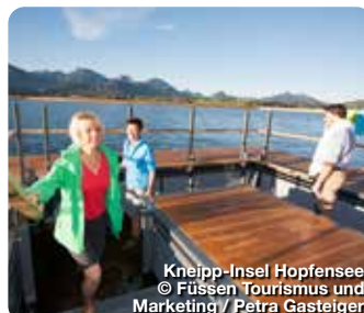
Kneipp-Insel Hopfensee