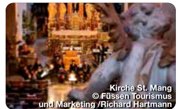
Kirche St. Mang

Füssen, die „Wiege“ des Lauten- und Geigenbaus, feiert beim Festival vielsaitig seit 2003 jährlich sein musikalisches Erbe. Konzerte, Meisterkurse und Vorträge bieten facettenreiche Erlebnisse.