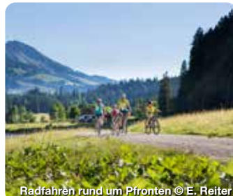
Radfahren rund um Pfronten

Ideal am Fuße der Allgäuer und Tiroler Alpen gelegen, erstreckt sich die Region Pfronten mit ihren 13 Ortsteilen über drei Höhenlagen und bietet so für jeden Bergfan ganzjährig das passende Outdoor- sowie Indoor-Erlebnis. Umgeben von Burgen und Schlössern, wirkt die Region mit den zahlreichen Seen, Flüssen, Wiesen und Wäldern wie ein groß angelegter Schlosspark. Umgeben von alpinen Gipfeln wie dem Breitenberg und dem markanten Aggenstein auf der einen sowie dem Voralpenland auf der anderen Seite, ist Pfronten der ideale Startpunkt in die grandiose Bergwelt. Die Region bietet vielfältigen Outdoor-Spaß für Familien, Gipfelstürmer, Biker, Wintersportler, Genießer, Traditions- und Naturliebhaber. TreffpunktDeutschland.de/pfronten