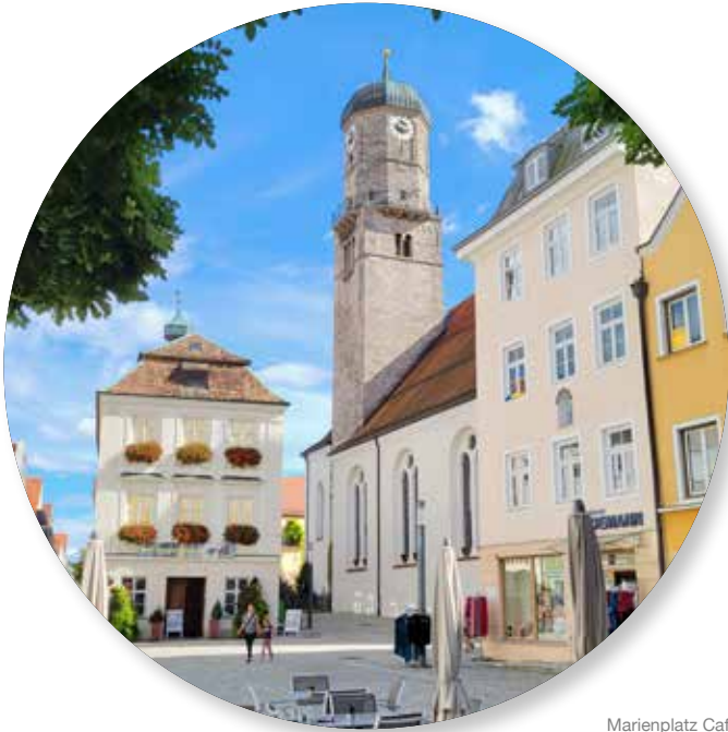
Marienplatz Cafe Kirchturm