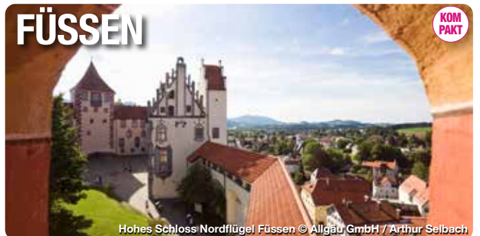
Hohes Schloss Nordflügel Füssen

Schon die bayerischen Könige begeisterten sich für die romantische Landschaft rund um den Allgäuer Urlaubsort Füssen. Hier, wo markante Gipfel wie Wächter eine sanft hügelige Voralpenlandschaft umschließen, ließ Ludwig II. sein Märchenschloss Neuschwanstein erbauen: Stein gewordener Traum einer mittelalterlichen Gralsburg mit weitem Blick ins Land. Heute ziehen Neuschwanstein, das gegenüberliegende Schloss Hohenschwangau und das Museum der bayerischen Könige am Alpsee alljährlich weit über eine Million Besucher aus dem In- und Ausland an. Füssen ist Kreuzungspunkt von Romantischer Straße, Deutscher Alpenstraße und der Alpentransversale Via Claudia Augusta.