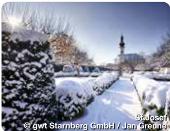
St. Josef