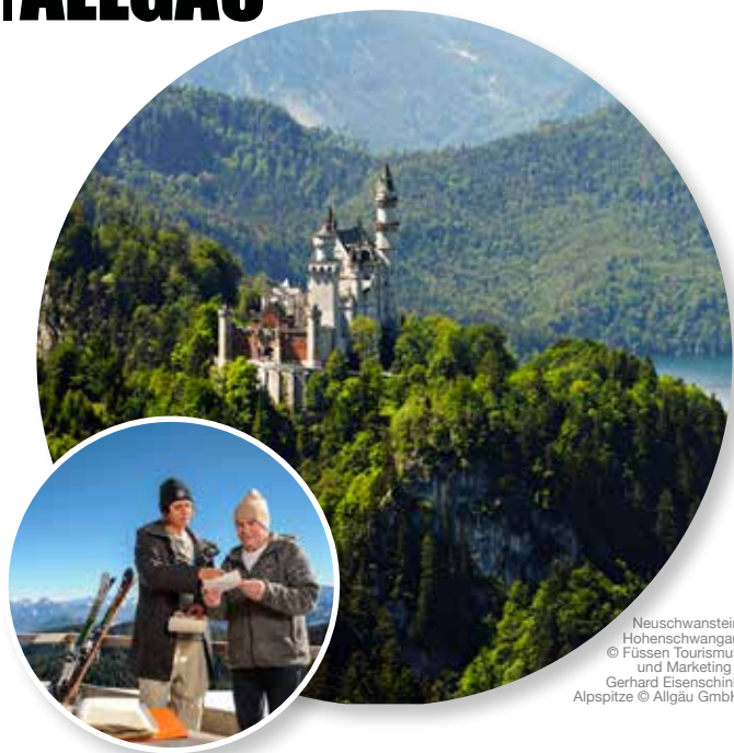
Neuschwanstein Hohenschwangau Alpspitze