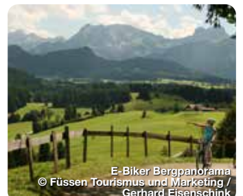
E-Biker Bergpanorama