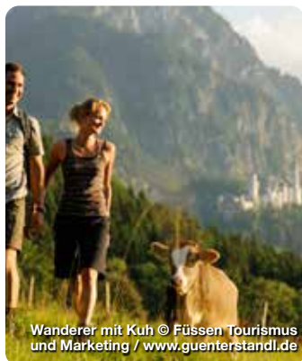
Wanderer mit Kuh