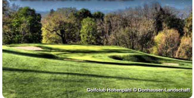
Golfclub Hohenpähli

Die Region StarnbergAmmersee ist bundesweiter Spitzenreiter in Sachen Golfplatzdichte. Neun hochklassige Golfanlagen in einem Umkreis von 25 km bieten Golf Fans ein einzigartiges Erlebnis. Golfen Sie mit Seeblick oder Alpenpanorama und das nur eine halbe Stunde von der Metropole München entfernt. Zusätzlich zu den einzigartigen Golfclubs finden Golfer hier eine große Auswahl an Golfunterkünften, die speziell auf die