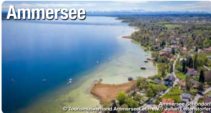
Ammersee Schondorf

Keramikwerkstätten aus ganz Europa präsentieren einen Querschnitt zeitgenössischer Töpferkunst. Längst ist der beliebte Töpfermarkt einer der wichtigsten Branchentreffs in der Keramikszene.