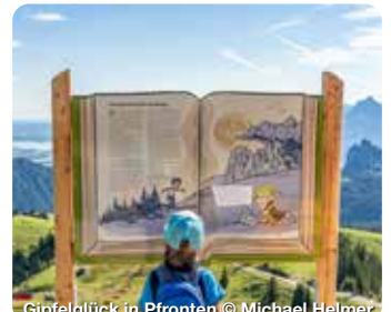
Gipfelglück in Pfronten