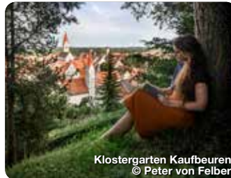
Klostergarten Kaufbeuren

Wie ein Schatzkästchen liegt er im Herzen des Allgäus, im bayerischen Süden Deutschlands. Er ist einer von neun Erlebnisräumen der Region und erstreckt sich über den gesamten Landkreis Ostallgäu, von Füssen über Pfronten, Nesselwang, Halblech, Marktoberdorf bis nach Kaufbeuren und Buchloe. Die königliche Gipfelkulisse aus Ammergauer, Allgäuer und Tannheimer Bergen wachen wie steinerne Riesen über mystische Seen, rauschende Flüsse, sanft gewellte Hügelmeere und sattgrüne Wiesen, zwischen die Dörfer und historischen Städte eingebettet sind. Die archaische Poesie der Landschaft wirkt wie ein großer, weiter Park, der sich vor den vielen Schlössern und Burgen der Region ausbreitet, vor allem zu Füßen des Märchenschlosses Neuschwanstein. TreffpunktDeutschland.de/ostallgaeu