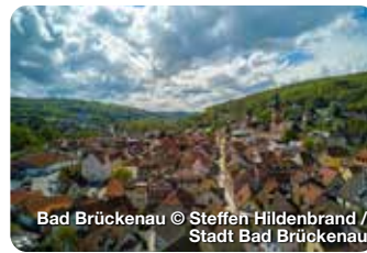
Bad Brückenau

Noch mehr Weihnachtsmärkte auf www.treffpunktdeutschland.de/wellness