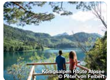
Königsalpen Route Alpsee