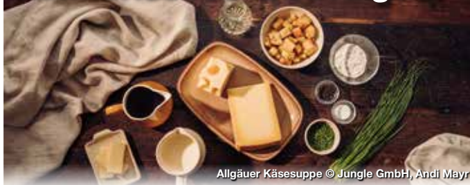
Allgäuer Käsesuppe

Das Allgäu besitzt einen reichen Schatz an traditionsreichen Gerichten – weit über die Allgäuer Kässpätzten, Nonnenfürzle oder Balzheimer hinaus: 15 Gerichte und Produkte sind zum kulinarischen Erbe erklärt worden. Sie zeigen, wie Tradition, Geschichte, Kultur und regionale Landwirtschaft zusammenhängen und vor allem aber, gelebt werden. Und das schon seit über 500 Jahren: solange wird beispielsweise schon die Allgäuer Seele in Wangen gebacken.