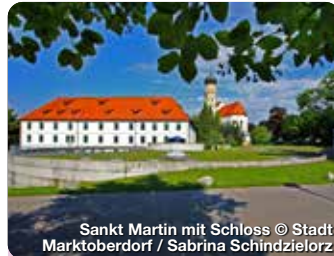
Sankt Martin mit Schloss

Marktoberdorf, das Tor zum Allgäu, begeistert mit malerischer Landschaft und bayerischem Charme. Umgeben von Seen, grünen Hügeln, weiten Wiesen und dem Panorama der Alpen, bietet die Stadt ideale Bedingungen für Naturfreunde und Aktivurlauber. Wander- und Radwege führen durch idyllische Landschaften, vorbei an Flüssen, Wiesen und Wäldern. Mit Musikakademie, Filmburg und Modeon ist die Kreisstadt Marktoberdorf bekannt für ihre reiche kulturelle Tradition. Weitere Highlights sind die prächtige Stadtpfarrkirche St. Martin und die Allee. Gemütlichen Cafés, Biergärten und regionalen Spezialitäten laden nicht nur am Marktplatz zum Verweilen ein. Marktoberdorf ist der perfekte Ausgangspunkt, um das Allgäu zu erkunden und gleichzeitig bayerische Gastfreundschaft zu erleben. TreffpunktDeutschland.de/marktoberdorf