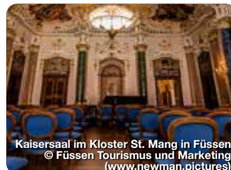
Kaisersaal im Kloster St. Mang in Füssen

Das Tänzelfest ist das älteste historische Kinderfest Bayerns. Jeden Juli begeistert die Tänzelfeststadt mit einer festlichen Eröffnung, historischem Lagerleben in der Altstadt und dem von Kindern gestalteten Häfelesmarkt. Höhepunkt sind am Sonntag und Montag der Kaiserempfang und der große Umzug mit rund 1.800 Kindern, Musikgruppen und prächtigen Festwagen. Festzelt und Vergnügungspark begleiten die gesamte Festwoche.