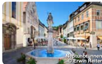
Neptunbrunnen © Erwin Reiter

Der Bau von Schloss Neuschwanstein begann im Jahr 1869 und wurde erst nach dem Tod von König Ludwig II. im Jahr 1886 fertiggestellt. Das Schloss wurde im romanischen Stil erbaut und ist von einer malerischen Landschaft umgeben, die aus Wäldern, Seen und Bergen besteht. Schloss Neuschwanstein ist für seine prächtigen Innenräume und seine imposante Architektur bekannt. Die Innenräume sind mit prächtigen Wandmalereien, Kronleuchtern und opulenten Möbeln ausgestattet. Besucher können die Thronhalle, das Schlafzimmer des Königs und den Singersaal, einen prächtigen Saal mit musikalischen Motiven besichtigen. Neuschwansteinstraße 20, Hohenschwangau