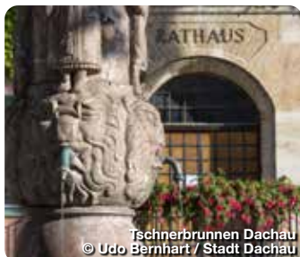
Tschernerbrunnen Dachau