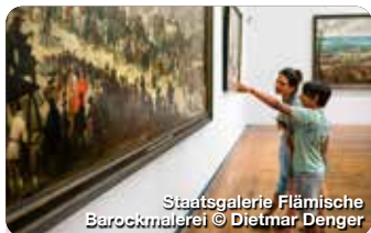
Staatsgalerie Flämische Barockmalerei