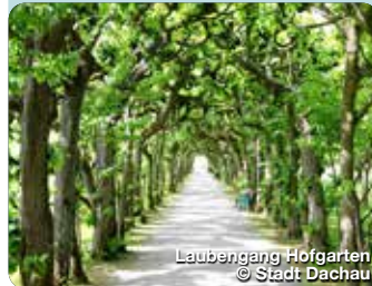
Laubengang Hofgarten