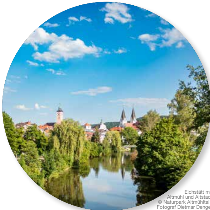
Eichstätt mit Altmühl und Altstadt

Informationszentrum NATURPARK ALTMÜHLTAL Notre Dame 1, 85072 Eichstätt, 08421 98760 info@naturpark-almuehltal.de, www.naturpark-almuehltal.de