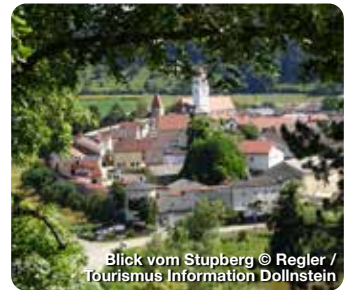
Blick vom Stupberg