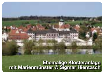
Ehemalige Klosteranlage mit Marienmünster

Umfangreiche mittelalterliche Anlage aus dem 11./12. Jahrhundert, die von den Staufern 1295 an die Grafen von Oettingen verpfändet wurde und 1731 an das Haus Oettingen-Wallerstein ging. Burgstraße 1, Harburg (Schwaben)