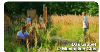
Das Grubet

Das im Aichacher Stadtteil Unterwittelsbach gelegene Wasserschloss bezaubert Besucherinnen und Besucher durch seine malerische Lage im Schlosspark mit Weiher. Kaiserin Elisabeth von Österreich soll hier Teile ihrer Kindheit verbracht haben, weshalb das Schloss im Volksmund auch „Sisi-Schloss“ genannt wird. Rund um das Wasserschloss Unterwittelsbach führt ein Wanderweg, eine Lauschtour sowie eine Radtour entlang. Die Stadt Aichach lädt mit vielen Angeboten wie Sisi-Ausstellungen, Lesungen, Konzerte, etc. ins Schloss und in den Schlosspark ein. Klausenweg 1, Aichach