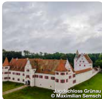
Jagdschloss Grünau

Die Bayerischen Staatsgemäldesammlungen verfügen über die größte Sammlung der Schule der flämischen Barockmalerei. 170 Meisterwerke sind in der Alten Pinakothek ausgestellt. Residenzstraße 2, Neuburg a.d.D.