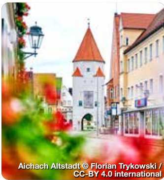
Aichach Altstadt