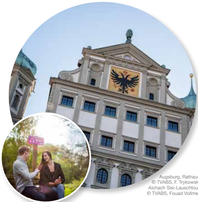
Augsburg, Rathaus Aichach Sisi-Lauschtour