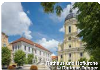
Rathaus und Hofkirche

Das Jagdschloss Grünau liegt etwa sieben Kilometer östlich von Neuburg an der Donau im größten zusammenhängenden Auwaldgebiet Mitteleuropas. Das Schloss ist ein schönes Beispiel der Architektur der Frührenaissance. Der Wittelsbacher Pfalzgraf Ottheinrich ließ es als Liebesbeweis für seine Ehefrau Susanna bauen. Ursprünglich wurde es als Wasserschloss errichtet, doch die Gräben sind inzwischen verlandet. Heute befindet sich das Aueninformationszentrum in mehreren Räumen des Gebäudes. Das Jagdschloss ist generell nur von außen zu besichtigen. Die Innenräume sind der Öffentlichkeit leider nicht zugänglich! Grünau 1, Neuburg an der Donau