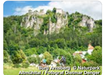
Burg Arnsberg