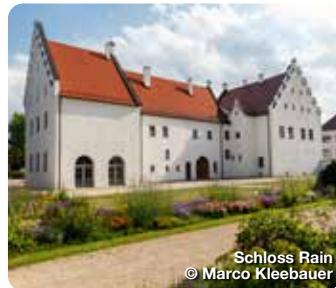
Schloss Rain