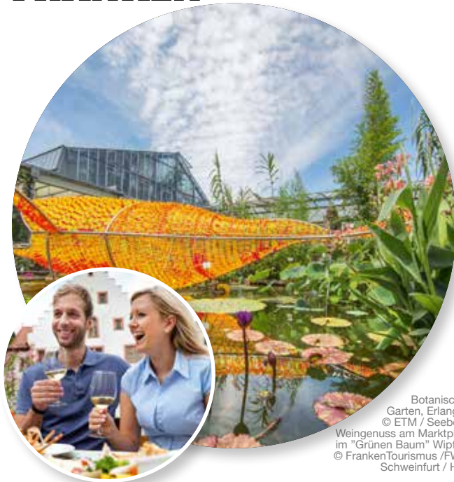
Botanischer Garten, Erlangen © ETM / Seebeck Weingenuß am Marktplatz im "Grünen Baum" Wipfeld © FrankenTourismus /FWL/ Schweinfurt / Hub