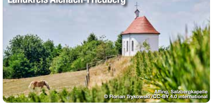
Affing, Salzbergkapelle

Der Wiege Altbayerns. Das „Wittelsbacher Land“, so nennt sich der Landkreis Aichach-Friedberg, verdankt seinen Namensgebern eine reichhaltige Geschichte. Die 1209 zerstörte „Burg Wittelsbach“ ist der ehemalige Stammsitz der Wittelsbacher – und auch wenn heute von der ehemaligen Burg nur noch Mauerreste übrig sind, so weisen doch viele andere Sehenswürdigkeiten auf dieses Herrschergeschlecht. Die beiden charmanten Herzogstädte Aichach und Friedberg, prachtvolle Schlösser oder barocke Wallfahrtskirchen laden Dich herzlich zu einem Besuch ein. Zugleich bietet die malerische Landschaft die perfekte Umgebung für eine Freizeitaktivitäten wie etwa Wandern, Radfahren oder Familienausflüge. treffpunktdeutschland.de/wittelsbacher-land