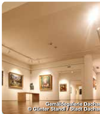
Gemäldegalerie Dachau