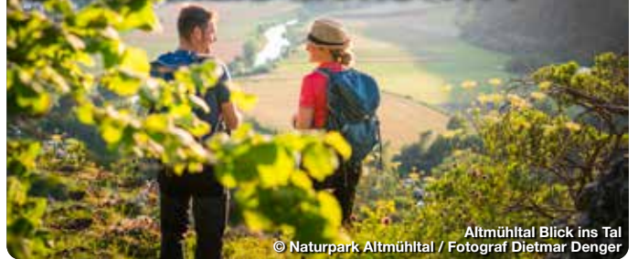
Altmühltal Blick ins Tal

Der Landkreis Eichstätt, idyllisch gelegen in der Mitte Bayerns, bezaubert mit seiner reichen Geschichte und malerischen Landschaft. Das Herzstück ist die gleichnamige Kreisstadt, geprägt von barockem Flair. Die imposante Willibaldsburg thront über der Stadt und bietet nicht nur einen atemberaubenden Ausblick, sondern auch Einblicke in die Vergangenheit. Die Region besticht durch ihre vielfältige Naturlandschaft. Der Naturpark Altmühltal, ein Paradies für Wanderer und Radfahrer, umgibt den Landkreis. Majestätische Felsen und romantische Flusstäler prägen die Szenerie. Kulturinteressierte kommen im Landkreis Eichstätt voll auf ihre Kosten. Die barocken Kirchen und Klöster zeugen von einer reichen religiösen Tradition. Das Jura-Museum auf der Willibaldsburg bietet faszinierende Einblicke in die Erdgeschichte und die regionale Entwicklung.