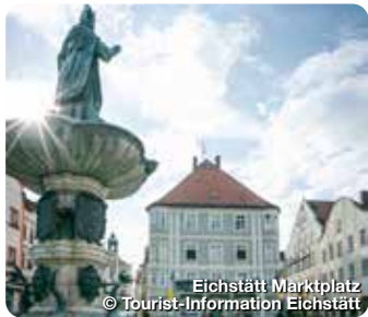
Eichstätt Marktplatz