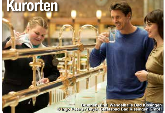
Brunnen- und Wandelhalle Bad Kissingen

Ganz gleich, auf welche Art man Franken für sich entdeckt: Die entspannenden Momente kommen nicht zu kurz. Dafür sorgen die 19 Heilbäder und Kurorte in Franken. Sie sind – dank innovativer Konzepte und Heilschätzen aus der Natur – wahre Gesundheits- und Wohlfühlexperten. Zu ihrem Angebot gehören moderne Thermen, großartige Sauna-