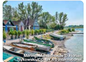
Mering, Mandlchsee