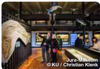
Jura-Museum © KU / Christian Klenk