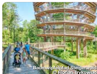
Baumwipfeldpfad Steigerwald