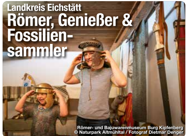
Römer- und Bajuwarenmuseum Burg Kipfenberg

Für Fossilien Sammler ist der Landkreis Eichstätt ein Eldorado. Die Gegend ist weltbekannt für ihre reichen Funde von Fossilien aus der Jurazeit. Die Römer am Limes haben ebenfalls ihre Spuren hinterlassen. Der Obergermanisch-Raetische Limes, UNESCO-Weltkulturerbe, verläuft durch den Landkreis. Historische Stätten wie das Kastell Vettoniana in Pfünz und das Römer und Bajuwarenmuseum in Kipfenberg bieten Einblicke in das römische Erbe der Region. Für Genießer locken