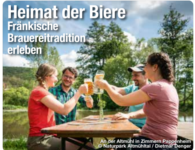
An der Altmühl in Zimmern Pappenheim

Nirgendwo sonst in Europa ist die Brauereidichte so hoch wie in Franken. Logisch also, dass es hier eine Vielzahl an Biersorten, Bierkellern und Biergärten sowie fränkischen Bierspezialitäten gibt, die es zu entdecken lohnt. Die Kampagne „Franken – Heimat der Biere.“ verschafft Orientierung über die biereulturellen Angebote. In der gleichnamigen Broschüre und auf der eigenen Website unter www.franken-bierland.de wird