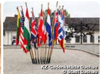
KZ-Gedenkstätte Dachau

Das Museum im Herzen der Altstadt dokumentiert mit ca. 200 Landschaftsbildern und einigen ausgewählten Skulpturen die Entstehung und Entwicklung der Künstlerkolonie Dachau von der Zeit als die Maler die Schönheit der Mooslandschaft entdeckten bis weit ins 20. Jahrhundert hinein. Bei einem Rundgang entdeckt man u.a. bekannte Namen wie Eduard Schleich d. Ä., Christian Morgenstern, Carl Spitzweg oder Lovis Corinth. Zusätzlich zur Dauerausstellung veranstaltet die Gemäldegalerie jährlich Sonderausstellungen zu anderen Künstlerkolonien. Konrad-Adenauer-Straße 3, Dachau