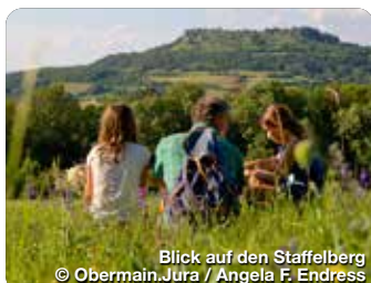
Blick auf den Staffelberg

Pretzfelder Straße 15, 90425 Nürnberg, Tel.: 0911 941510, info@frankentourismus.de, www.frankentourismus.de