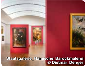
Staatsgalerie Flämische Barockmalerei

Eindrucksvoll auf einem Jurafelsen thront das Residenzschloss über der Donau als Wahrzeichen der Stadt. Pfalzgraf Ott- heinrich (1502 – 1559) ließ das mächtige Renaissanceschloss als Residenz des Fürstentums Pfalz-Neuburg errichten. 1665 – 1670 erhielt es seinen barocken Ostflügel, dessen markante Rundtürme schon von weitem zu erkennen sind. Die vierflügelige Schlossanlage hat echte Schätze zu bieten. Die Schlosskapelle, deren Eingang sich unerwartet im Durchgang zum imposanten Schlossinnenhof befindet, wurde bereits im Jahr 1543 als evangelisch-lutherische Kirche eingeweiht und ist damit einer der ältesten protestantischen Sakralbauten weltweit. Die vom Salzburger Kirchenmaler Hans Bocksberger d. Ä. einmalig gemalte Freskenzyklus brachten der Kapelle den Beinamen „Bayerische Sixtina“ ein. Residenzstraße 2, Neuburg an der Donau