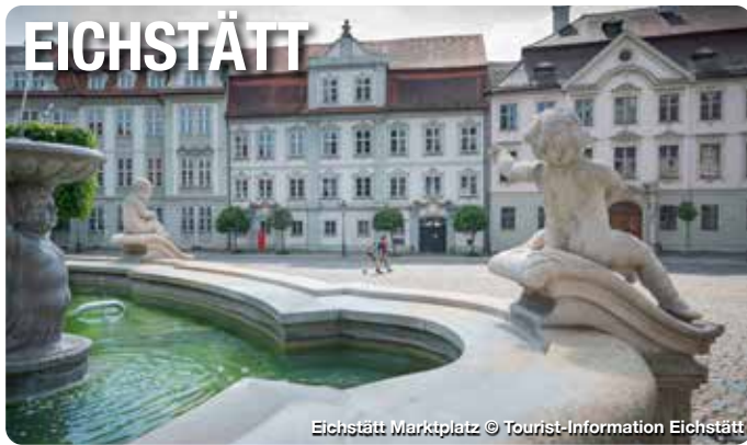
Eichstätt Marktplatz

Ehrwürdige Klöster, reich geschmückte Kirchen, prachtvolle Residenzen und außergewöhnliche Kulturschätze: Mitten im Zentrum des Naturparks Altmühltal liegt die barocke Universitätsstadt Eichstätt. Durch ihre kunstvoll gestalteten Plätze und kleinen Gassen bringt sie italienisches Flair in die Urlaubsregion. Wahrzeichen der Stadt ist die hoch auf einem Berg liegende Willibaldsburg mit ihrem bekannten Jura-Museum und dem Bastionsgarten, der das Erbe des berühmten „Hortus Eystetten-sis“ zum Erblühen bringt. Der Hofgarten der Sommerresidenz und Biotopgarten des Informationszentrums Naturpark Altmühltal sind die grünen Oasen in der Stadt.