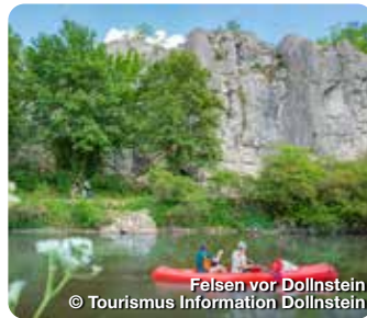
Felsen vor Dollnstein

Dollnstein liegt in einem weiten Talkessel, den in erdgeschichtlicher Zeit Urdonau und Altmühl an ihrem Zusammenfluss schufen. Er ist der geeignete Ausgangspunkt für Wanderer, Kletterer, Rad- und Bootfahrer. Sehr beliebt bei Jung und Alt ist die Fossilien-suche in den umliegenden Steinbrüchen. Das Altmühlzentrum, in der sanierten Burg Dollnstein ist ein Informationszentrum zur Kulturgeschichte des Altmühltals mit den Schwerpunkten Fluss und Burgen. Ein Schatzraum, beherbergt den bei Ausgrabungen gefundenen Dollnsteiner Silberschatz. Die Touristinformation befindet sich in der Burg, sowie ein Museumsladen und ein Café. Es gibt 5 gut markierte Rundwanderwege, 1 Naturlehrpfad, am nördlichen Rand den Altmühltal-Panoramaweg und im Naturwaldreservat den anspruchsvollen Jägersteig. Im Ortsteil Breitenfurt können Sie sich nach Ihren Aktivitäten im Freibad erfrischen. TreffpunktDeutschland.de/dollnstein