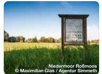
Niedermoor Roßmoos