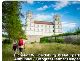
Eichstätt Willibaldsburg

TreffpunktDeutschland.de/eichstaett-region