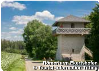
Römerturm Ekertshofen