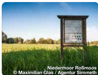
Niedermoor Roßmoos