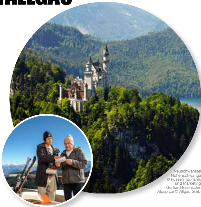
Neuschwanstein Hohenschwangau Alpspitze