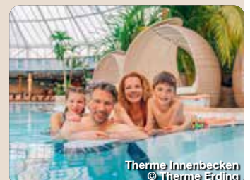
Therme Innenbecken