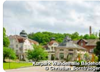
Kurpark Wandelhalle Badhof © Christian Borntraeger