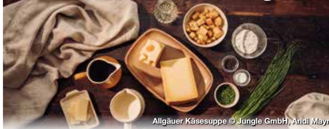
Allgäuer Käsesuppe

Das Allgäu besitzt einen reichen Schatz an traditionsreichen Gerichten – weit über die Allgäuer Kässpätzten, Nonnenfürzle oder Balzheimer hinaus: 15 Gerichte und Produkte sind zum kulinarischen Erbe erklärt worden. Sie zeigen, wie Tradition, Geschichte, Kultur und regionale Landwirtschaft zusammenhängen und vor allem aber, gelebt werden. Und das schon seit über 500 Jahren: solange wird beispielsweise schon die Allgäuer Seele in Wangen gebacken.