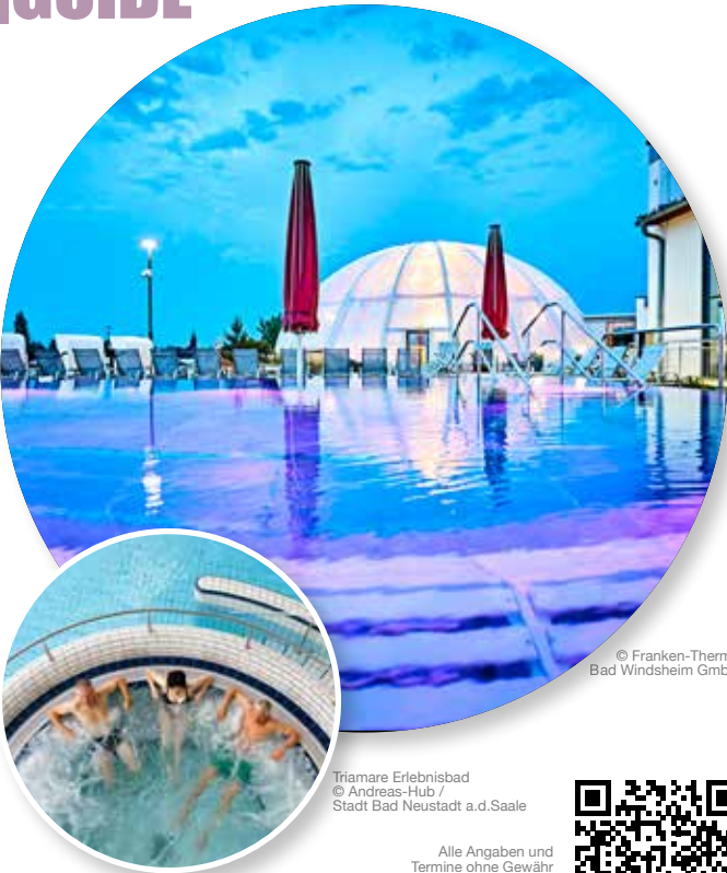
Triamare Erlebnisbad