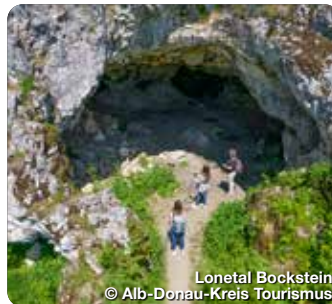
Lonetal Bockstein

Der Alb-Donau-Kreis gehört zum UNESCO Global Geopark Schwäbische Alb und ist Teil des UNESCO Biosphärenreservat Schwäbische Alb. Die abwechslungsreichen reizvollen Landschaften mit ausgedehnten Wäldern, romantischen Tälern und aussichtsreichen Höhen sind ideal für eine Atempause in der Natur. Für Radler, Wanderer und kulturgeschichtlich interessierte Gäste gibt es zahlreiche Tourenvorschläge. Zur Auswahl stehen 20 Eiszeitpfade zum Wandern, 23 Fahrrad-Erlebnistouren, 9 Rennradtouren sowie etliche Kulturrouten, urgeschichtliche Höhlen und regionale Genusssorte vom Landgasthof bis zum Hofladen. TreffpunktDeutschland.de/alb-donau-kreis