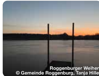
Roggenburger Weiher

In Roggenburg Gast zu sein bedeutet, die Vorzüge überschaubarer Dörfer zu genießen und doch nur wenige Minuten von den Zentren unseres Landkreises Neu-Ulm oder des Nachbarlandkreises Günzburg entfernt zu sein. Roggenburg – das ist ein herrliches Stück Schwaben, geprägt durch die stolzen Kirchtürme der Klosteranlage Roggenburg mit einer intakten Natur, einem gesunden Lebensraum und einer modernen Infrastruktur. Die idyllische Lage, naturnahe Wanderwege, eine hervorragende Anbindung an das überregionale Radwegenetz, viele gemütliche Gaststätten, die beeindruckenden Barockanlagen und die zahlreichen Kulturveranstaltungen verschaffen uns einen hohen Freizeit- und Erholungswert. Ferienwohnungen, Wohnmobilstellplätze und Hotelbetrieb bieten moderne Übernachtungsmöglichkeiten. TreffpunktDeutschland.de/roggenburg