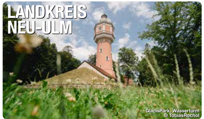
GlacisPark, Wasserturm

Die Region lockt mit idyllischen Fluss- und Seenlandschaften, sanften Hügeln, historischen Schlössern, einzigartigen Museen und beeindruckenden Kirchen. Hier verbinden sich Natur und Kultur zu einem besonderen Erlebnis. Von Elchingen bis Kellmünz umfasst der Landkreis 17 Kommunen, jede mit einer eigenen Geschichte und einzigartigem Charme. Kultur wird hier großgeschrieben, sei es in der historischen Klosterbibliothek Roggenburg, dem Barocksaal des Vöhlenschlosses Illertissen oder dem modernen Wolfgang-Eychmüller-Haus in Vöhringen. Ob Kammermusik, Jazz, Theater oder die renommierte Veranstaltungsreihe „Roggenburger Sommer“ – das Angebot begeistert Musik- und Kulturfreunde gleichermaßen.