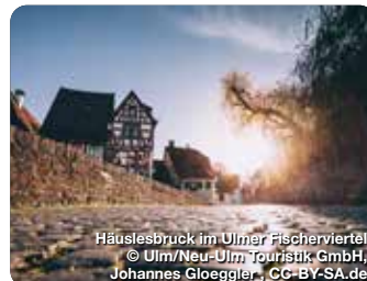
Häuslesbruck im Ulmer Fischerviertel

Als Schwerpunkt-museum für die Altsteinzeit vermittelt es das Leben von Neandertalern und modernen Menschen. Und es werden die ältesten Kunstwerke der Menschheit präsentiert. Blaubeuren