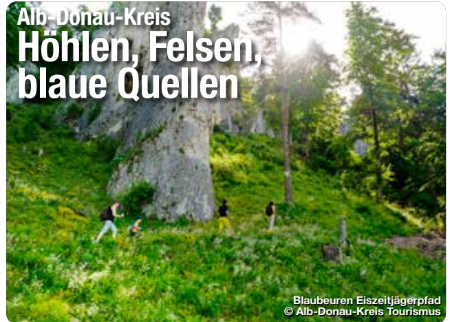
Blaubeuren Eiszeitjägerpfad

Die Kraft der Natur hat auf der Schwäbischen Alb geradezu sensationelle Phänomene geschaffen. Großartige Schau- und Naturhöhlen, markante Felsen und blaue Quellen prägen die Landschaft im einzigartigen „Höhlenreich Alb-Donau-Kreis“. Entdeckt gemeinsam mit Freunden oder der Familie diese geologischen Wunder, die zugleich Zeugnis der Erd- und Menschheitsgeschichte sind. In den Schauhöhlen führen euch Treppen, Wege und Stufen tief hinein in den