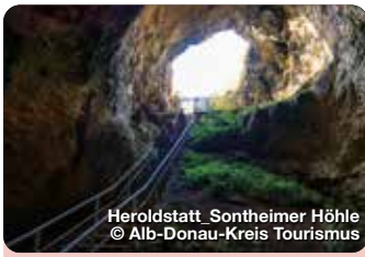
Heroldstatt Sontheimer Höhle