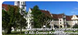
Obermarchtal Klosteranlage

Im Kirchener Tal bei Ehingen thront auf einer Anhöhe Schloss Mochental und lässt seine barocke Pracht erkennen. In den Schlossräumen befindet sich eine renommierte Kunstgalerie mit Ausstellungen für moderne Kunst. Ehingen-Mochental