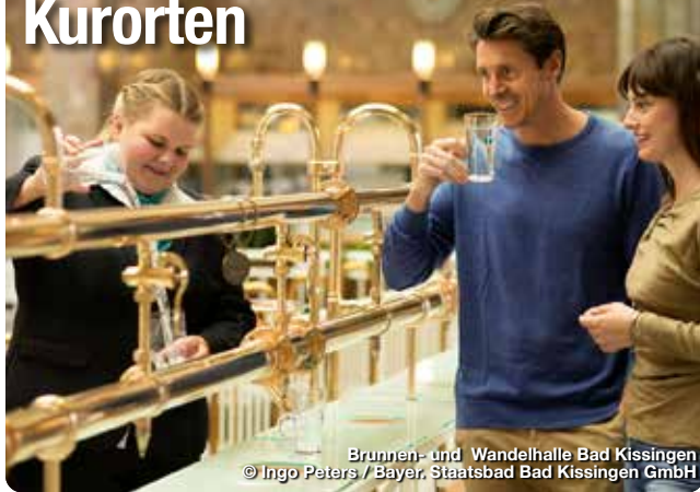
Brunnen- und Wandelhalle Bad Kissingen

Ganz gleich, auf welche Art man Franken für sich entdeckt: Die entspannenden Momente kommen nicht zu kurz. Dafür sorgen die 19 Heilbäder und Kurorte in Franken. Sie sind – dank innovativer Konzepte und Heilschätzen aus der Natur – wahre Gesundheits- und Wohlfühlexperten. Zu ihrem Angebot gehören moderne Thermen, großartige Sauna-