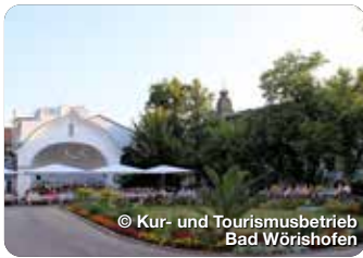
© Kur- und Tourismusbetrieb Bad Wörishofen

GASTRONOMIE Hotel-Gasthof Adler Die Adler Tenne Hauptstraße 40 86825 Bad Wörishofen 08247 96360 info@adler-bw.de adler-bw.de