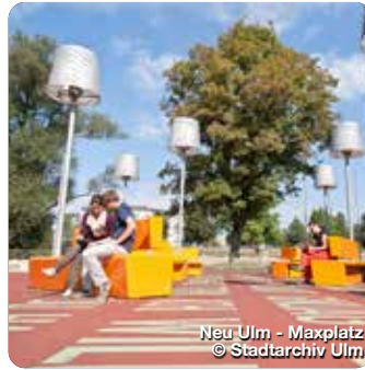
Neu-Ulm - Maxplatz

Das Museum der Gartenkultur in Illertissen ist ganzjährig ein inspirierender Ort. Pflanzenschatze, Bücher und Gärtnerwissen – in allen Bereichen dieses blühenden Kulturbetriebes wird Gartenkultur erlebbar. Auch zeitgemäße Gartenthemen und kreative Ideen zur Gartengestaltung haben hier ihren Platz. Zum Museum gehören die große Gartenbibliothek, das Museumscafé und die Ausstellung mit Exponaten aus der Geschichte des Gärtners, der Gärtner und ihrer Gerätschaften. Die vom Illertisser Verein Förderer der Gartenkultur gepflegten und verschönten Museums-gärten zeigen die Kultur alter Nutz- und Zierpflanzen und inspirieren zu vielfältigem Einsatz in unseren Gärten. Durch die Gärten und Ausstellung werden Führungen angeboten. Jungviehweide 1, Illertisse