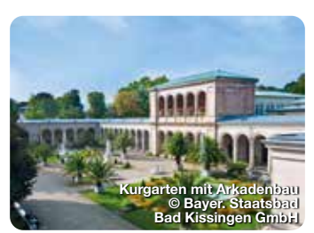
Kurgarten mit Arkadenbau

Bad Hindelang ist nicht nur Heilklimatischer Kurort und Kneipp-Heilbad. Durch das große Naturschutzgebiet gibt es viel zu entdecken und zu erleben. TreffpunktDeutschland.de/bad-hindelang