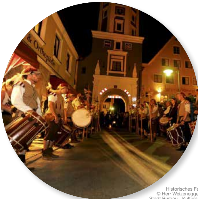
Historisches Fest