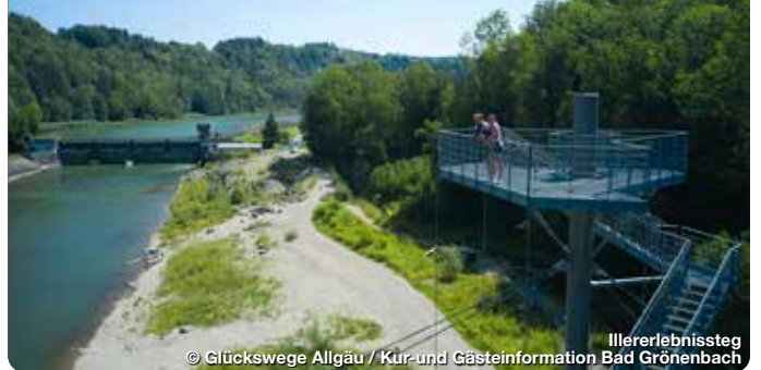
Illererlebnissteig