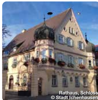
Rathaus, Schloss