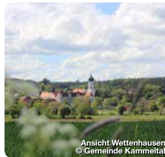
Ansicht Wettenhausen

Ichenhausen liegt in der Mitte des Landkreises Günzburg, nahe dem Freizeitpark LEGOLAND Deutschland. Diese liebenswerte Kleinstadt mit 9000 Einwohnern wurde erstmals im Jahr 1032 urkundlich erwähnt. Über 400 Jahre prägte eine große jüdische Gemeinde das Ortsgeschehen mit. Besuchermagnet ist das Bayerische Schulmuseum, das die Geschichte des Lehrens und Lernens von der Steinzeit bis ins Heute erlebbar macht. Zusätzlich machen wechselnde Sonderausstellungen jeden Besuch zu einem Erlebnis. Die Ichenhauser Fachklinik für Physikalische Medizin und Rehabilitation ist weit über die Grenzen Schwabens hinaus bekannt. TreffpunktDeutschland.de/ichenhausen