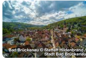
Bad Brückenau

Noch mehr Weihnachtsmärkte auf www.treffpunktdeutschland.de/wellness