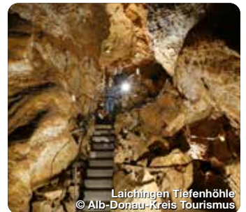
Laichingen Tiefenhöhle