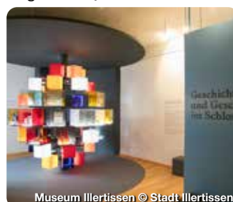
Museum Illertissen

Die Bienen- und Gartenstadt Illertissen liegt direkt an der Iller in Bayerisch-Schwaben. Die Stadt mit rund 18.600 Einwohnern beeindruckt mit ihrer Verbindung aus Natur, Kultur und Geschichte. Hoch über der Stadt erhebt sich das Vöhlenschloss, dessen Ursprünge im 12./13. Jahrhundert liegen. Heute beherbergt es das Bayerische Bienenmuseum und das Museum Illertissen – zwei spannende Museen, die Natur, Imkerei und Regionalgeschichte lebendig vermitteln. Auf der Jungviehweide lädt das Museum der Gartenkultur mit Themengärten, Ausstellungen und Veranstaltungen zum Entdecken ein. Illertissen ist ein attraktives Ziel für Naturfreunde, Kulturinteressierte und Familien. Rad- und Wanderwege, Veranstaltungen und ein vielfältiges Freizeitangebot machen die Stadt zu einem lohnenden Ausflugsziel in der Region. TreffpunktDeutschland.de/illertissen