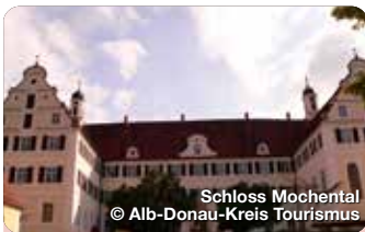
Schloss Mochental