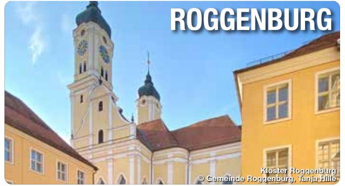
Kloster Roggenburg

Das Schönste an Neu-Ulm ist der Blick auf Ulm? Dieser gewagten These folgt ein klares NEIN! Und dies wird bei einem Bummel durch die 60.000-Einwohner-Stadt schnell deutlich. Machen Sie sich auf den Weg und entdecken Sie die Vielfalt der jungen Stadt an der Donau. Vor allem Freunde der aktiven Stadtentdeckung kommen auf ihre Kosten, denn mit der E-Kart-Bahn Ecodrom, der DAV Kletterwelt und dem Donaabad bieten sich hier viele Möglichkeiten. Aber auch Naturgenießer und Musikliebhaber haben hier ihre Freude, denn die Parks und die verschiedenen Konzerte -sei es Open-Air im Sommer oder in der Ratiopharm Arenaladen herzlich ein. TreffpunktDeutschland.de/neu-ulm