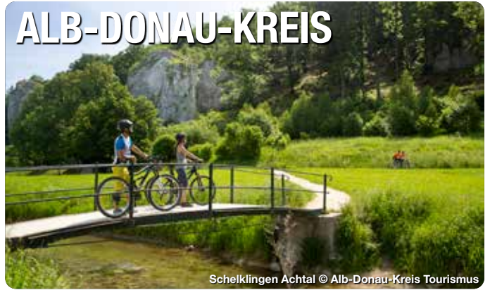
Schelklingen Achtal

Der Alb-Donau-Kreis gehört zum UNESCO Global Geopark Schwäbische Alb und ist Teil des UNESCO Biosphärenreservat Schwäbische Alb. Die abwechslungsreichen reizvollen Landschaften mit ausgedehnten Wäldern, romantischen Tälern und aussichtsreichen Höhen sind ideal für eine Atempause in der Natur. Für Radler, Wanderer und kulturgeschichtlich interessierte Gäste gibt es zahlreiche Tourenvorschläge. Zur Auswahl stehen 20 Eiszeitpfade zum Wandern, 23 Fahrrad-Erlebnistouren, 9 Rennradtouren sowie etliche Kulturrouten, urgeschichtliche Höhlen und regionale Genusssorte vom Landgasthof bis zum Hofladen. TreffpunktDeutschland.de/alb-donau-kreis