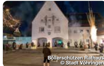
Böllerschützen Rathaus

Die Pfarrkirche St. Johann Baptist in Neu-Ulm wurde 1857 als Garnisonskirche im neuromanischen Stil erbaut. Zwischen 1922 und 1926 gestaltete Dominikus Böhm sie zur heutigen Form um. Heute gilt sie als bedeutender Kirchenbau des 20. Jahrhunderts. Johannespl. 1, Neu-Ulm