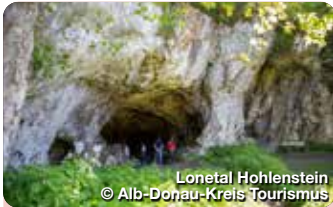
Lonetal Hohlenstein