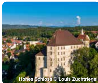
Hohes Schloss