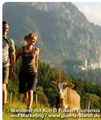
Wanderer mit Kuh