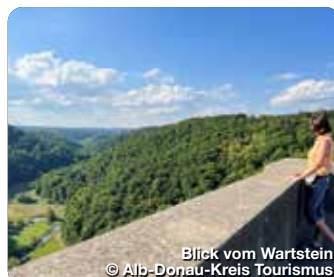
Blick vom Wartstein

Spaß und Action verspricht ein Besuch im Kletterwald. 17 Parcours mit unterschiedlichen Schwierigkeitsgraden in bis zu 16 m Höhe bieten Abenteuer pur für große und kleine Kletterfans. Laichingen