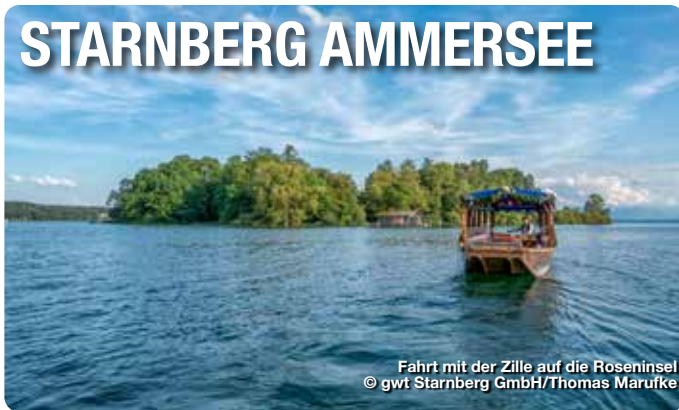
Fahrt mit der Zille auf die Roseninsel

Willkommen in StarnbergAmmersee. Wassersport vor grandioser Alpenkulisse: Insgesamt 130 Ufer-Kilometer schönster Seenlandschaft mit charmanten Bauerndörfern am Ammersee, herrschaftlichen Villen und Schlössern am Starnberger See. Schon Ludwig II. und Kaiserin Sisi ließen sich vom märchenhaften Ambiente verzaubern. Zwischen den Seen erstklassige Golfplätze mit Zugspitzblick und kulturelle Highlights rund ums Jahr: Die Region StarnbergAmmersee – rund 20 Kilometer südwestlich von München – ist „der hochwertigste Lebens- und Wirtschaftsraum in direkter Nachbarschaft einer Weltstadt