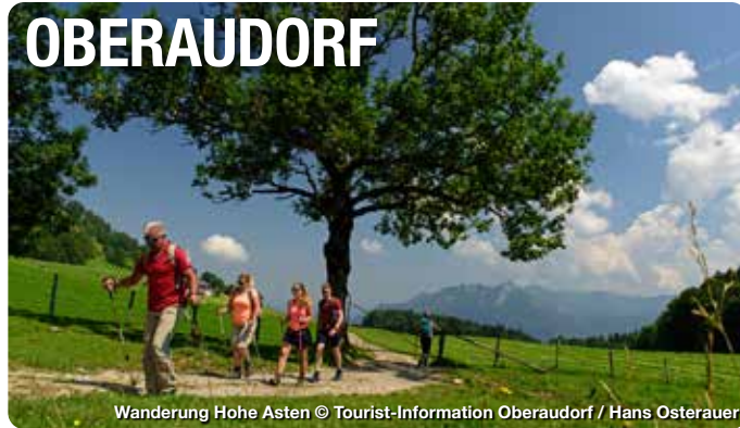
Wanderung Hohe Asten

Im bayerischen Inntal, eingebettet zwischen dem Wendelsteingebirge, dem Inn und dem bekannten Kaisergebirge, nahe dem Chiemgau und der bayerischen Landeshauptstadt München, liegt die idyllische Urlaubsdestination Oberaudorf. Hier findet sich alles, was man für naturnahe Erholung braucht – und das in allen vier Jahreszeiten: sanfte Hügel, abwechslungsreiche Bergwelten, traumhafte Seen, vielzählige Wander- und Fahrradwege, Ski- und Rodelpisten, Langlaufloipen und ein besonderes Highlight für Familien – der Erlebnisberg Oberaudorf-Hoheck. Mit guter Infrastruktur und einem breiten Erholungs-, Freizeit- und Kulturangebot, bietet die Destination darüber hinaus zahlreiche Möglichkeiten zur Urlaubsgestaltung. TreffpunktDeutschland.de/oberaudorf