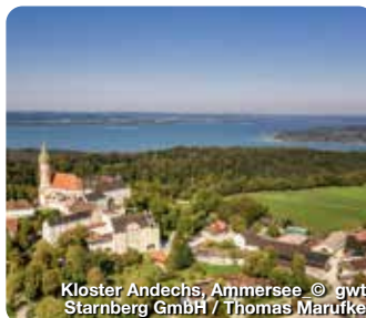
Kloster Andechs, Ammersee

TreffpunktDeutschland.de/starnberg-ammersee