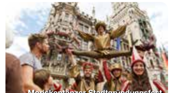
Morisken tänzer Stadtgründungsfest

Die Auer Dult gehört zu den traditionsreichsten Veranstaltungen Münchens und belebt dreimal im Jahr den Mariahilfplatz im Stadtteil Au. Jede Dult dauert neun Tage und hat ihren eigenen Charakter: Maidult, Jakobidult folgt im Hochsommer und die Kirchweihdult.