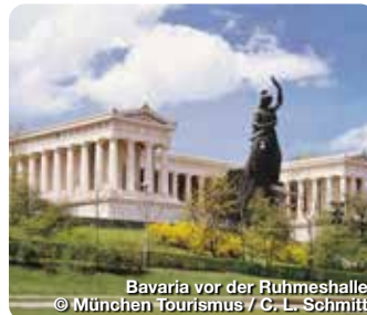
Bavaria vor der Ruhmeshalle