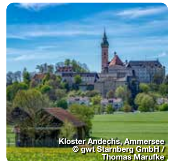
Kloster Andechs, Ammersee

Das 2018 komplett umgebaute Hallenbad bietet gleich mehrere Highlights. Neben dem 25-Meter-Becken mit zwei Sprungtürmen, gibt es ein separates Lehrschwimmbecken und ein Kleinkinderbecken. Kinder und Jugendliche verbringen die meiste Zeit auf der 45-Meter-Wasserwelle, für die ganz Kleinen gibt es noch zwei „Anfänger“-Rutschen. Und die Erwachsenen? Schwitzen im Dampfbad oder in der separaten Saunalandschaft mit direktem Seezugang. Strandbadstraße 17, Starnberg