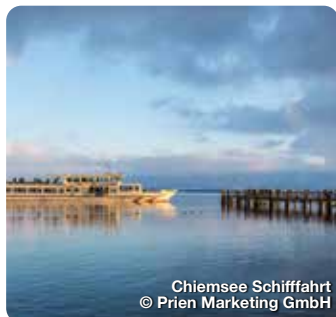
Chiemsee Schifffahrt