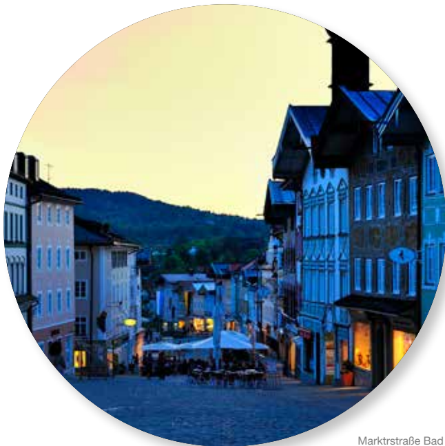
Marktstraße Bad Tölz