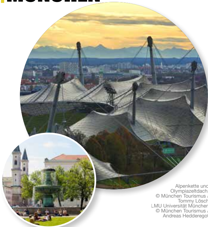
Alpenkette und Olympiastadiondach, © München Tourismus / Tommy Lösch LMU Universität München © München Tourismus / Andreas Heddergott

Referat für Arbeit und Wirtschaft München Tourismus Verkehrsverein Nürnberg e.V. 80331 München Telefon: 089 233 96500 tourismus@muenchen.de, www.muenchen.travel