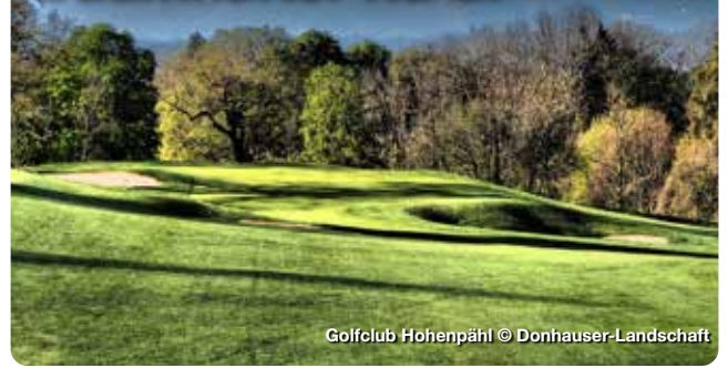
Golfclub Hohenpähl

Die Region StarnbergAmmersee ist bundesweiter Spitzenreiter in Sachen Golfplatzdichte. Neun hochklassige Golfanlagen in einem Umkreis von 25 km bieten Golf Fans ein einzigartiges Erlebnis. Golfen Sie mit Seeblick oder Alpenpanorama und das nur eine halbe Stunde von der Metropole München entfernt. Zusätzlich zu den einzigartigen Golfclubs finden Golfer hier eine große Auswahl an Golfunterkünften, die speziell auf die