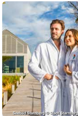
Seebad Starnberg

TreffpunktDeutschland.de/starnbergammersee