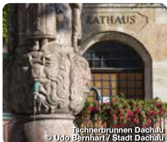
Ischnerbrunnen Dachau