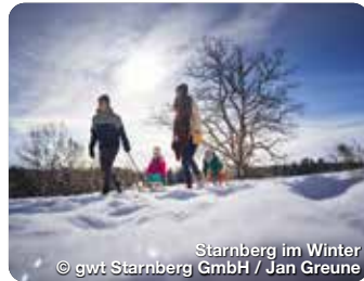
Starnberg im Winter