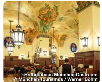
Hofbräuhaus München Gastraum