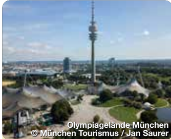
Olympiagelände München