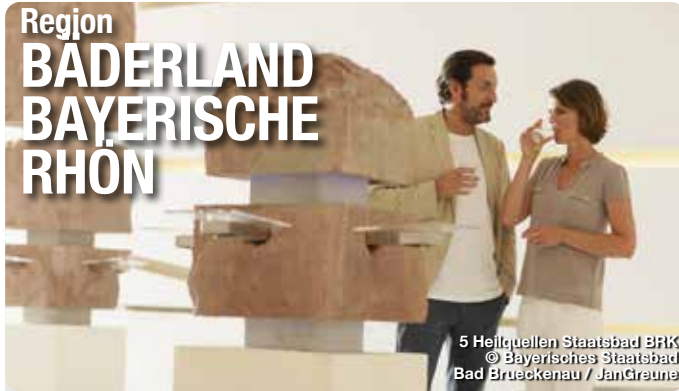
5 Heilquellen Staatsbad BRK

Gesund sein, aber vor allem gesund bleiben, das ist der größte Wunsch jedes Menschen. Das Bäderland Bayerische Rhön, ein deutschlandweit wohl einzigartiger Zusammenschluss von gleich fünf Kurorten - Bad Bocklet, Bad Brückenau, Bad Kissingen, Bad Königshofen und Bad Neustadt - bietet unter dem Motto „In einem Bad zu Gast – in fünf Bädern zu Hause!“ eine Vielzahl von Gesundheits-Arrangements zur Vorbeugung aber auch zur Linderung von Beschwerden. Gäste profitieren von geballter medizinischer Kompetenz, Kultur pur in den geschichts-trächtigen Kurorten sowie einem gesunden Mittelgebirgsklima im Naturpark und UNESCO Biosphärenreservat Rhön. TreffpunktDeutschland.de/baederland-bayerische-rhoen