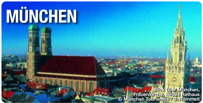
Blick über München, Frauenkirche, Neues Rathaus

Referat für Arbeit und Wirtschaft München Tourismus Verkehrsverein Nürnberg e.V. 80331 München Telefon: 089 233 96500 tourismus@muenchen.de, www.muenchen.travel