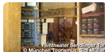
Filmtheater Sendlinger Tor

Besucher*innen erleben hier eine Welt voller Illusionen sowie immersiver Kunstwerke, also Ausstellungsstücke, die den Gästen das Gefühl vermitteln, direkt in eine andere Welt einzutauchen. Tal 27, München