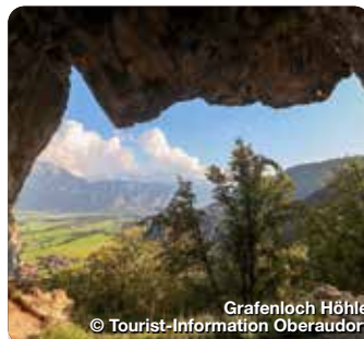
Grafenloch Höhle