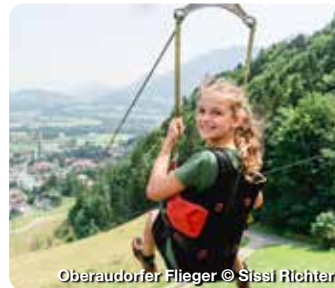
Oberaudorfer Flieger