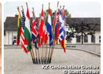
KZ-Gedenkstätte Dachau

Das Museum im Herzen der Altstadt dokumentiert mit ca. 200 Landschaftsbildern und einigen ausgewählten Skulpturen die Entstehung und Entwicklung der Künstlerkolonie Dachau von der Zeit als die Maler die Schönheit der Mooslandschaft entdeckten bis weit ins 20. Jahrhundert hinein. Bei einem Rundgang entdeckt man u.a. bekannte Namen wie Eduard Schleich d. Ä., Christian Morgenstern, Carl Spitzweg oder Lovis Corinth. Zusätzlich zur Dauerausstellung veranstaltet die Gemäldegalerie jährlich Sonderausstellungen zu anderen Künstlerkolonien. Konrad-Adenauer-Straße 3, Dachau