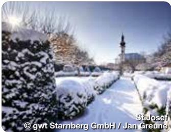
St. Josef