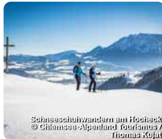
Schneeschuhwandern am Hoheck

Im bayerischen Inntal, eingebettet zwischen dem Wendelsteingebirge, dem Inn und dem bekannten Kaisergebirge, nahe dem Chiemgau und der bayerischen Landeshauptstadt München, liegt die idyllische Urlaubsdestination Oberaudorf. Hier findet sich alles, was man für naturnahe Erholung braucht – und das in allen vier Jahreszeiten: sanfte Hügel, abwechslungsreiche Bergwelten, traumhafte Seen, vielzählige Wander- und Fahrradwege, Ski- und Rodelpisten, Langlaufloipen und ein besonderes Highlight für Familien – der Erlebnisberg Oberaudorf-Hoheck. Mit guter Infrastruktur und einem breiten Erholungs-, Freizeit- und Kulturangebot, bietet die Destination darüber hinaus zahlreiche Möglichkeiten zur Urlaubsgestaltung. TreffpunktDeutschland.de/oberaudorf