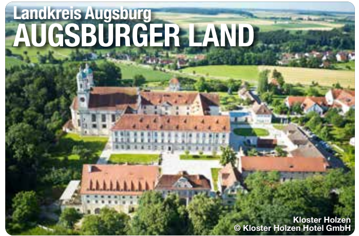
Kloster Holzen

Das Augsburgische Land. Mit seiner reichen Geschichte, seiner vielfältigen Kultur und Landschaft ist das Augsburgische Land ein attraktives Ziel für ein paar Tage Entspannung. Der Naturpark Augsburg - Westliche Wälder ist die grüne Lunge und lädt zum Naturerlebnis und zur Entschleunigung ein. Die Flüsse Lech und Wertach prägen die Landschaft und bieten zahlreiche Möglichkeiten zum Wandern und Radfahren. Ein vielseitiges Kulturangebot und Freizeitspaß sowie familienfreundliche Angebote und Aktivitäten bei abwechslungsreichen Ausflugszielen bieten ein Urlaubsfeeling im Grünen – ganz ohne Trubel.