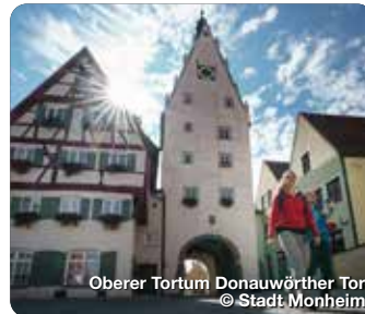
Oberer Torturm Donauwörther Tor

Der Landkreis Donau-Ries in Bayern vereint landschaftliche Schönheit und kulturelle Vielfalt. Harburg beeindruckt mit einer imposanten Burg aus dem 12. Jahrhundert, während Kaisheim mit seinem barocken Kloster fasziniert. Monheim, idyllisch im Naturpark Altmühltal gelegen, bietet historische Sehenswürdigkeiten und Naturerlebnisse. Oettingen verzaubert mit seinem historischen Stadtkern und dem Oettinger Schloss. Rain am Lech lockt mit dem Dehner-Blumenpark und seiner historischen Altstadt. Wemding, am Rand des Rieskraters, begeistert mit seiner Altstadt und dem Fuch sienrundgang. Eine Region voller Geschichte und Natur. TreffpunktDeutschland.de/donau-ries