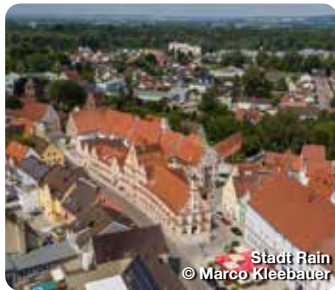
Stadt Rain