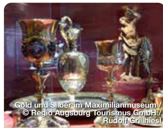
Gold und Silber im Maximilianmuseum

Die älteste bestehende Sozialsiedlung der Welt wurde 1521 von Jakob Fugger „dem Reichen“ gestiftet. Heute leben 150 bedürftige katholische Augsburger Bürger in den 67 Häusern der Reihenhaussiedlung. Sie bezahlen für die rund 60 Quadratmeter großen Wohnungen eine jährliche (Kalt-)Miete von 0,88 Euro. Im Gegenzug sprechen sie täglich drei Gebete für den Stifter und die Stifterfamilie. Es lohnt sich das Fuggereimuseum, das Museum im Weltkriegsbunker und eine Schauwohnung zu besuchen. Seit September 2019 gibt es mit dem „Museum der Bewohner“ und dem „Museum des Alltags“ zwei weitere Möglichkeiten, sich über das Leben der Fuggerei-Bewohner zu informieren. Jakoberstraße 26, Augsburg