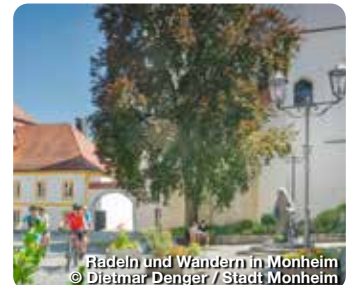
Radeln und Wandern in Monheim