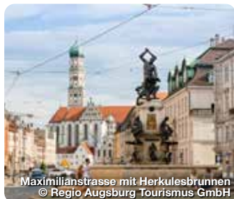
Maximilianstraße mit Herkulesbrunnen