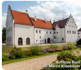
Schloss Rain