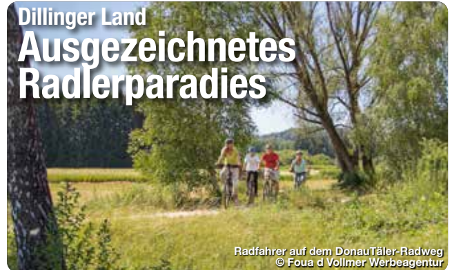
Radfahrer auf dem DonauTäler-Radweg

Am besten lässt sich das vielfältige Dillinger Land mit dem Rad erkunden. Mehr als 15 abwechslungsreiche Tagestouren führen durch den landschaftlichen Dreiklang zwischen Alb, Donautal und Voralpenland – und machen die Region somit zu einem echten Paradies für Radfans. Radlergenuss pur bieten auch die beiden der 4-Sterne-Radwege DonauTäler und Donauradweg. Ein besonderes Highlight ist der Radrundweg zu den Sieben Wegkapellen. Er verbindet auf 153 Kilometern sieben einzigartige Kapellenbauten miteinander – wahre architektonische Unikate und