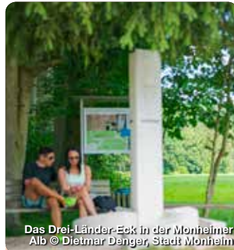
Das Drei-Länder-Eck in der Monheimer Alb

Der Markt Kaisheim ist in seiner heutigen Zusammensetzung durch die Eingemeindung der ehemaligen Gemeinden Altshheim, Gunzenheim, Hafenreut, Leitheim und Sulzdorf mit dem Ortsteil Bergstetten entstanden. Seine Bekanntheit weit über die Grenzen Bayerns hinaus verdankt er dem 1134 gegründeten und 1802 im Zuge der Säkularisation untergegangenen Zisterzienserkloster mit dem gotischen Münster und dem von 1979 bis 1989 restaurierten Kaisersaal, einem prachtvollen Beispiel der Baukunst in der Übergangsperiode vom Barock zum Rokoko. Kaisheim präsentiert sich heute als aufstrebende Gemeinde am Schnittpunkt der Verkehrsachsen von Augsburg nach Nürnberg und von Ingolstadt nach Ulm und damit als idealer Standort in der Region Nordschwaben. TreffpunktDeutschland.de/kaisheim