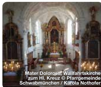
Mater Dolorosa, Wallfahrtskirche zum Hl. Kreuz