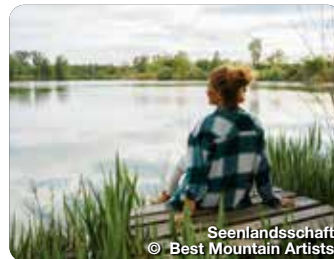
Seenlandschaft © Best Mountain Artists

Auszeit zwischen Donautal und Alb. Hunderte Seen, weite kulturgeprägte Ebenen und das blaue Band der Donau als zentrales Juwel, umgeben von landschaftlichen und kulturellen Schätzen. Dort reihen sich entlang der Donau und Zusam malerische Städte wie Perlen an einer Schnur. Kultur pur findet man auch fernab der Städte in den beschaulichen Dörfern. Neben so viel Kultur und Städteromantik genießt man auf ausgezeichneten Rad- und Wanderwegen Natur pur. Außerdem bietet die Region beste Möglichkeiten zum Wassersport und „Seen-Süchtige“ kommen voll auf ihre Kosten. Das Dillinger Land möchte Einheimische und Gäste motivieren, die Natur und sich selbst bewusst neu zu entdecken. TreffpunktDeutschland.de/dillinger-land