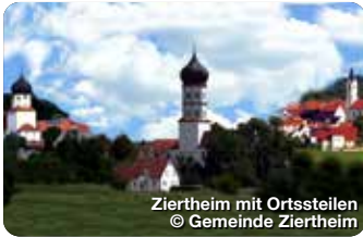
Ziertheim mit Ortssteilen