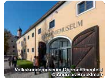
Volkskundemuseum Oberschönenfeld