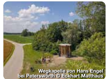
Wegkapelle von Hans Engel bei Peterswörth