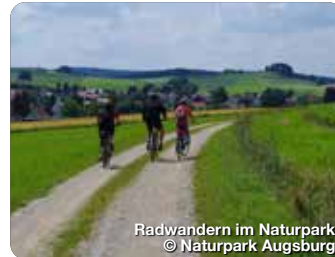
Radwandern im Naturpark

TreffpunktDeutschland.de/augsburger-land