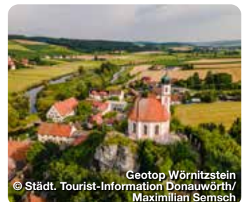
Geotop Wörnitzstein