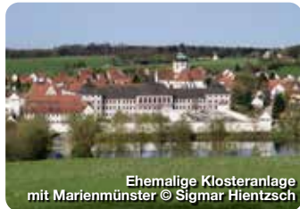
Ehemalige Klosteranlage mit Marienmünster

Umfangreiche mittelalterliche Anlage aus dem 11./12. Jahrhundert, die von den Staufern 1295 an die Grafen von Oettingen verpfändet wurde und 1731 an das Haus Oettingen-Wallerstein ging. Burgstraße 1, Harburg (Schwaben)