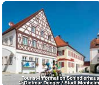
Tourist-Information Schindlerhaus