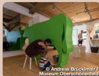
© Andreas Brücklmair / Museum Oberschönenfeld