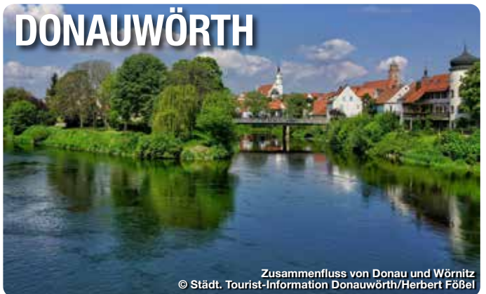
Zusammenfluss von Donau und Wörnitz

Am Zusammenfluss von Donau und Wörnitz und direkt an der Romantischen Straße liegt Donauwörth – eine Stadt, die Geschichte und Natur vereint. Die prächtige Reichsstraße und historische Bauwerke erzählen von einer glanzvollen Vergangenheit. Heute ist Donauwörth idealer Ausgangspunkt für Ausflüge ins Donau-Ries und den UNESCO Global Geopark Ries. Über 100 Kilometer Wander- und Pilgerwege sowie internationale Radrouten wie der Donauradweg laden zum Aktivsein ein. Kulturfans genießen das Käthe-Kruse-Museum und traditionelle Feste, Genießer die bayerisch-schwäbische Küche. Donauwörth – entdecken, erleben, verliehen! TreffpunktDeutschland.de/donauwoerth