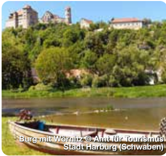
Burg mit Wörnitz