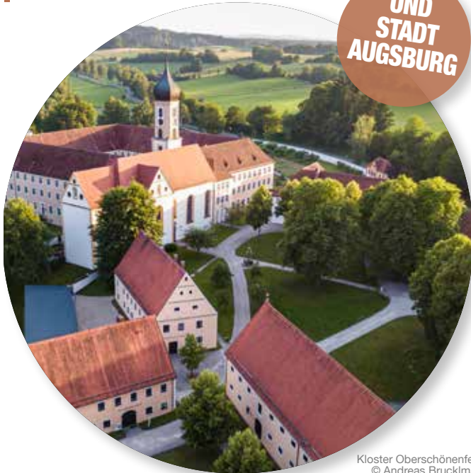
Kloster Oberschönenfeld