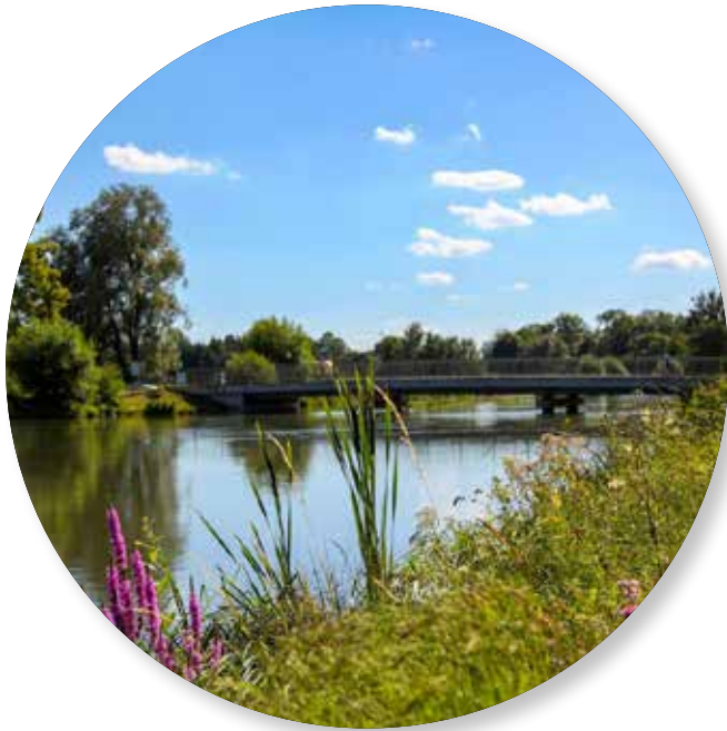
Radfahrer an der Amper bei Dachau