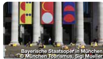
Bayerische Staatsoper in München

Ein kleines, bis in die Details liebevoll gestaltetes Museum mit wechselnden Ausstellungen zur urbanen Kunst wie Murals, Graffiti und Plakatkunst. Hotterstraße 12, München