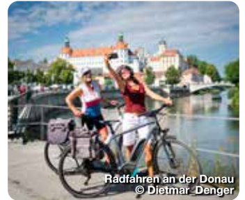
Radfahren an der Donau