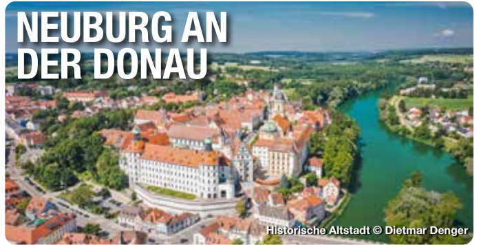
Historische Altstadt

Renaissance am Donauradweg. Mitten in Bayern liegt das Städtchen Neuburg an der Donau - mit seinem nahezu komplett erhaltenen, ungemein sehenswerten Altstadtensemble aus der Renaissance- und Barockzeit. Das herausragendste und größte Bauwerk ist das Residenzschloss. Auf einer Italienreise ließ sich Pfalzgraf Ottheinrich von der dortigen Architektur inspirieren. Wer den Innenhof des Schlosses betritt, spürt die südlich anmutende Atmosphäre sofort. Als einer der ältesten protestantischen Sakralbauten der Welt stellt die 1540 erbaute Schlosskapelle eine echte Besonderheit dar. Neuburgs Blütezeit im 16. und 17. Jahrhundert ist noch heute allgegenwärtig. Man muss nur den historischen Karlsplatz besuchen, der von besterhaltenen prachtvollen Häusern umrahmt wird.