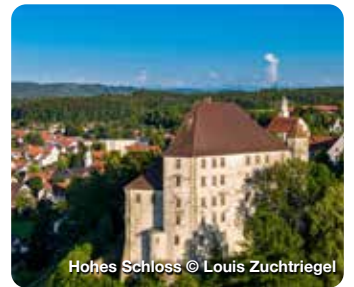
Hohes Schloss

Die Johannesbad Therme verfügt über hochwirksames, weltweit einzigartiges Thermalwasser aus der eigenen staatlich anerkannten Heilquelle, der Johannesquelle. Johannesstraße 2, Bad Füssing