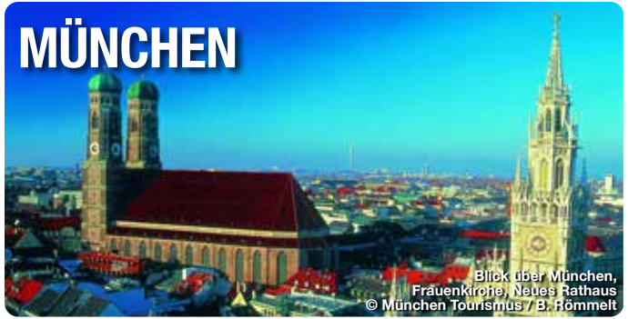
Blick über München, Frauenkirche, Neues Rathaus

Referat für Arbeit und Wirtschaft München Tourismus Verkehrsverein Nürnberg e.V. 80331 München Telefon: 089 233 96500 tourismus@muenchen.de, www.muenchen.travel