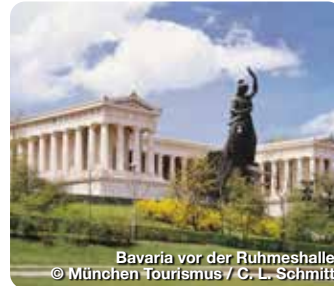
Bavaria vor der Ruhmeshalle