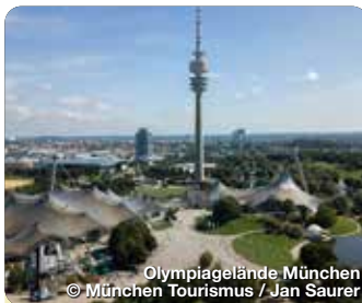
Olympiagelände München