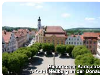
Historischer Karlsplatz