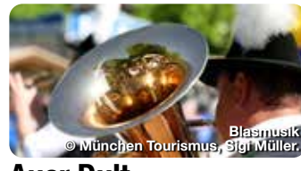
Blasmusik © München Tourismus, Sigi Müller.