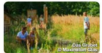
Das Grubet

Das im Aichacher Stadtteil Unterwittelsbach gelegene Wasserschloss bezaubert Besucherinnen und Besucher durch seine malerische Lage im Schlosspark mit Weiher. Kaiserin Elisabeth von Österreich soll hier Teile ihrer Kindheit verbracht haben, weshalb das Schloss im Volksmund auch „Sisi-Schloss“ genannt wird. Rund um das Wasserschloss Unterwittelsbach führt ein Wanderweg, eine Lauschtour sowie eine Radtour entlang. Die Stadt Aichach lädt mit vielen Angeboten wie Sisi-Ausstellungen, Lesungen, Konzerte, etc. ins Schloss und in den Schlosspark ein. Klausenweg 1, Aichach