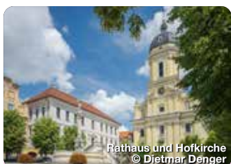
Rathaus und Hofkirche

Das Jagdschloss Grünau liegt etwa sieben Kilometer östlich von Neuburg an der Donau im größten zusammenhängenden Auwaldgebiet Mitteleuropas. Das Schloss ist ein schönes Beispiel der Architektur der Frührenaissance. Der Wittelsbacher Pfalzgraf Ottheinrich ließ es als Liebesbeweis für seine Ehefrau Susanna bauen. Ursprünglich wurde es als Wasserschloss errichtet, doch die Gräben sind inzwischen verlandet. Heute befindet sich das Aueninformationszentrum in mehreren Räumen des Gebäudes. Das Jagdschloss ist generell nur von außen zu besichtigen. Die Innenräume sind der Öffentlichkeit leider nicht zugänglich! Grünau 1, Neuburg an der Donau