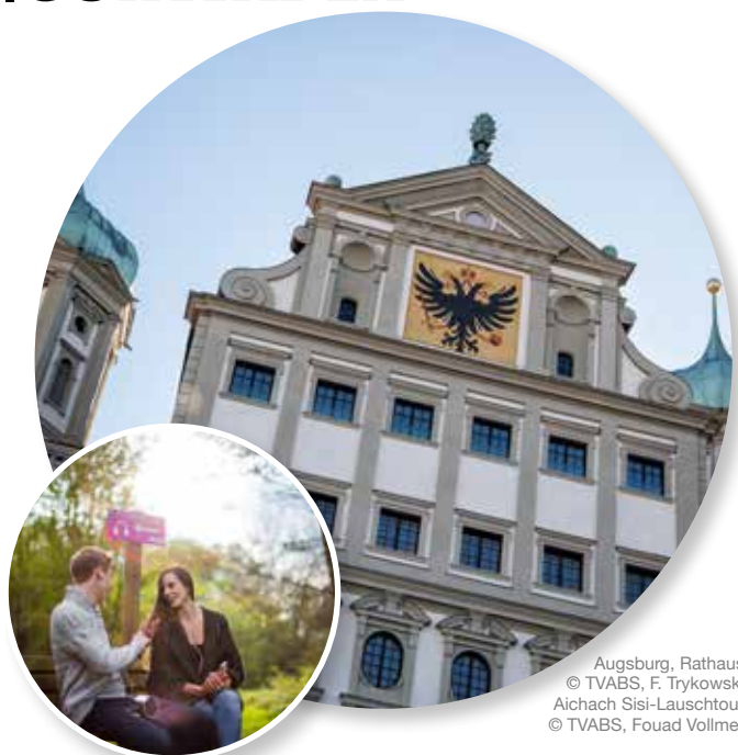
Augsburg, Rathaus Aichach Sisi-Lauschtour