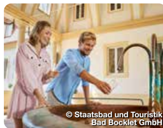
© Staatsbad und Touristik Bad Bocklet GmbH

Bad Berneck liegt wunderschön eingebettet zwischen sieben Bergen im westlichen Fichtelgebirge und zieht schon seit Hunderten von Jahren Freunde der Romantik an. TreffpunktDeutschland.de/bad-berneck