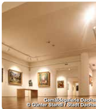
Gemäldegalerie Dachau