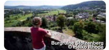
Burgruine Stolzenberg

Frowin-von-Hutten-Str. 5, Bad Soden-Salmünster