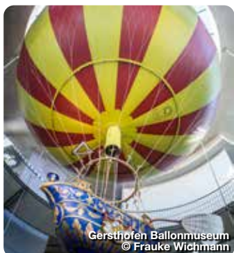
Gersthofen Ballonmuseum

Schießgrabenstr. 14, 86150 Augsburg, Tel.: 0821 45040110, info@tvabs.de , www.bayerisch-schwaben.de