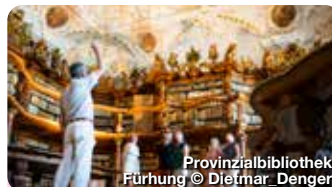
Provinzialbibliothek Führung

Fürstentum Pfalz Neuburg: Diese Sammlung zeigt die 300-jährige Geschichte des ehemaligen Fürstentums Pfalz-Neuburg, beginnend mit den Kunstschätzen des Pfalzgrafen Ottheinrich, der ein kunstsinniger Renaissance-mensch war. Er stürzte das Fürstentum in den finanziellen Ruin. Die nachfolgenden Pfalzgrafen verstanden es durch ihre Politik, und vor allem auch Heiratspolitik Pfalz Neuburg wieder zu neuem Glanz zu verhelfen. Kirchlicher Barock: Kurfürst Johann Wilhelm von der Pfalz gründete 1698 in Neuburg ein Ursulinenkloster. Die Schwestern stickten prächtige Krchengewänder und Altarantependien mit biblischen Szenen in Seide, Silber und Gold. Kunstwerke aus der Zeit der Gegenreformation und religiöse Volkskunst runden die Präsentation ab. Residenzstraße 2, Neuburg a.d.D.