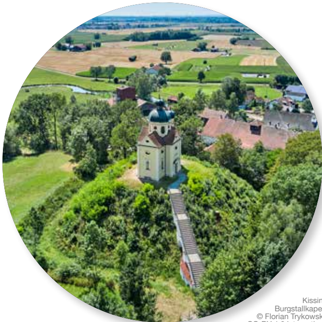
Kissing, Burgstallkapelle