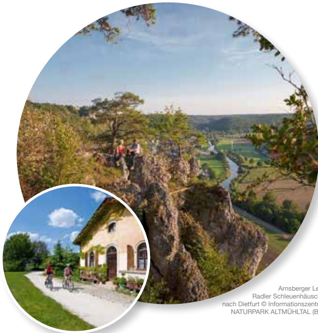
Arnsberger Leite. Radler Schleuenhäuschen nach Dietfurt