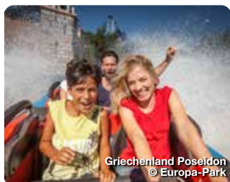
Griechenland Poseidon

Ab 2026 glänzt das Fürstentum Monaco als 18. europäischer Themenbereich im Europa-Park! Inspiriert vom mediterranen Flair erleben Gäste rund um die Achterbahn „Silver Star“ das Land in all seinen Facetten mit prachtvoller Architektur, edlen Yachthäfen und kulinarischen Highlights. Eine exklusive Autoausstellung aus der Sammlung von Fürst Albert II. bringt den Riviera-Glamour nach Rust. Bereits ab November 2026 begeistert im Europa-Park die „Winter Zirkus Revue“ in enger Zusammenarbeit mit dem Internationalen Zirkusfestival von Monte Carlo. Rust