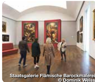
Staatsgalerie Flämische Barockmalerei

TreffpunktDeutschland.de/neuburg-an-der-donau