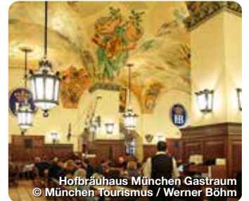
Hofbräuhaus München Gastraum