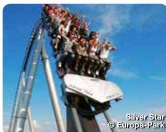
Silver Star