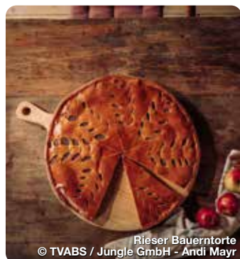
Rieser Bauerntorte