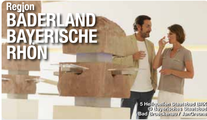
5 Heilquellen Staatsbad BFK

Gesund sein, aber vor allem gesund bleiben, das ist der größte Wunsch jedes Menschen. Das Bäderland Bayerische Rhön, ein deutschlandweit wohl einzigartiger Zusammenschluss von gleich fünf Kurorten - Bad Bocklet, Bad Brückenau, Bad Kissingen, Bad Königshofen und Bad Neustadt - bietet unter dem Motto „In einem Bad zu Gast – in fünf Bädern zu Hause!“ eine Vielzahl von Gesundheits-Arrangements zur Vorbeugung aber auch zur Linderung von Beschwerden. Gäste profitieren von geballter medizinischer Kompetenz, Kultur pur in den geschichts-trächtigen Kurorten sowie einem gesunden Mittelgebirgsklima im Naturpark und UNESCO Biosphärenreservat Rhön. TreffpunktDeutschland.de/baederland-bayerische-rhoen