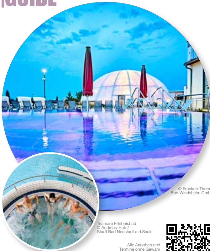
Triamare Erlebnisbad