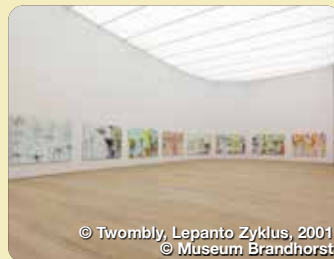
© Twombly, Lepanto Zyklus, 2001