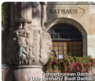
Ischnerbrunnen Dachau