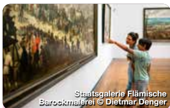
Staatsgalerie Flämische Barockmalerei