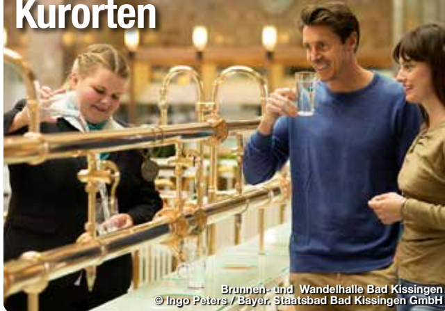
Brunnen- und Wandelhalle Bad Kissingen

Ganz gleich, auf welche Art man Franken für sich entdeckt: Die entspannenden Momente kommen nicht zu kurz. Dafür sorgen die 19 Heilbäder und Kurorte in Franken. Sie sind – dank innovativer Konzepte und Heilschätzen aus der Natur – wahre Gesundheits- und Wohlfühllexperten. Zu ihrem Angebot gehören moderne Thermen, großartige Sauna-