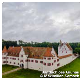
Jagdschloss Grünau

Die Bayerischen Staatsgemäldesammlungen verfügen über die größte Sammlung der Schule der flämischen Barockmalerei. 170 Meisterwerke sind in der Alten Pinakothek ausgestellt. Residenzstraße 2, Neuburg a.d.D.