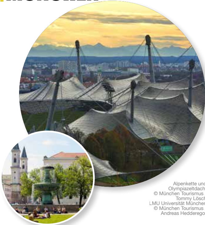
Alpenkette und Olympiastadiondach, © München Tourismus / Tommy Lösch LMU Universität München © München Tourismus / Andreas Hedderogot

Referat für Arbeit und Wirtschaft München Tourismus Verkehrsverein Nürnberg e.V. 80331 München Telefon: 089 233 96500 tourismus@muenchen.de, www.muenchen.travel