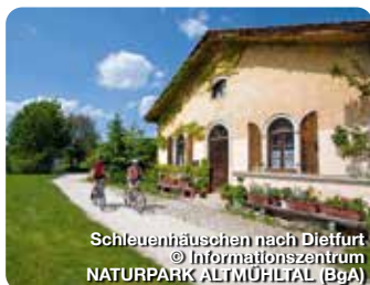
Schleuenhäuschen nach Dietfurt

Notre Dame 1, 85072 Eichstätt, 08421 98760 info@naturpark-almuehltal.de, www.naturpark-almuehltal.de