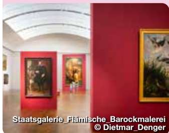
Staatsgalerie Flämische Barockmalerei

Eindrucksvoll auf einem Jurafelsen thront das Residenzschloss über der Donau als Wahrzeichen der Stadt. Pfalzgraf Ottheinrich (1502 – 1559) ließ das mächtige Renaissanceschloss als Residenz des Fürstentums Pfalz-Neuburg errichten. 1665 – 1670 erhielt es seinen barocken Ostflügel, dessen markante Rundtürme schon von weitem zu erkennen sind. Die vierflügelige Schlossanlage hat echte Schätze zu bieten. Die Schlosskapelle, deren Eingang sich unerwartet im Durchgang zum imposanten Schlossinnenhof befindet, wurde bereits im Jahr 1543 als evangelisch-lutherische Kirche eingeweiht und ist damit einer der ältesten protestantischen Sakralbauten weltweit. Die vom Salzburger Kirchenmaler Hans Bocksberger d. Ä. einmalig gemalte Freskenzyklus brachten der Kapelle den Beinamen „Bayerische Sixtina“ ein. Residenzstraße 2, Neuburg an der Donau