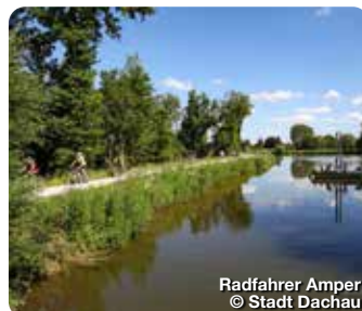
Radfahrer Amper