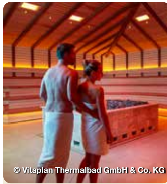
© Vitaplan Thermalbad GmbH & Co. KG

Das Erlebnis- & Wellnessbad mit großer Saunalandschaft bietet Spaß und Vergnügen für Wasserratten jeden Alters. Branderstraße 1, Ruhpolding