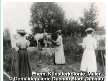
Ehem. Künstlerkolonie Maler

Auf Betreiben des Comité International de Dachau wurde 1965, auf dem Gelände des ehemaligen Konzentrationslagers, die KZ-Gedenkstätte eröffnet. Alte Römerstraße 75, Dachau