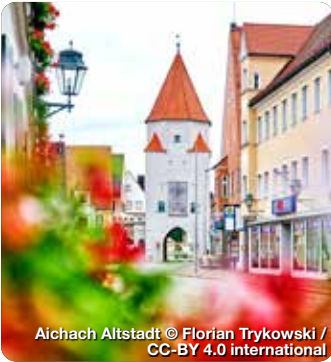
Aichach Altstadt