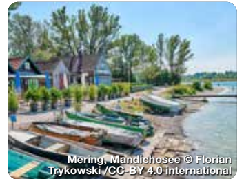
Mering, Mandichosee