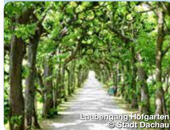
Laubengang Hofgarten