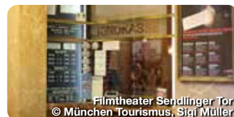
Filmtheater Sendlinger Tor