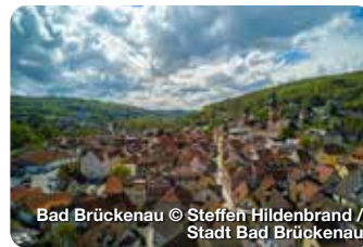
Bad Brückenau

Noch mehr Weihnachtsmärkte auf www.treffpunktdeutschland.de/wellness