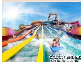
GALAXY ERDING

Südseeparadies mitten in Bayern. In der größten Therme der Welt, der Therme Erding, erwartet die Besucher ein traumhaftes Urlaubsparadies unter Palmen. Unzählige Attraktionen rund um Rutschen, Saunieren, Thermal- und Wellenbaden bieten Erholung, Spaß und Action für alle Ansprüche. In der tropischen Therme lässt sich Wellness mit der ganzen Familie genießen. Für Adrenalin hingegen sorgt das Galaxy Erding, Europas größte Rutschenwelt, mit 28 spektakuläre Bahnen in 3 Schwierigkeitslevels. Ein Bad wie im echten Meer erleben die Besucher im türkisglitzernden Wellenbad. In den Wellnesswelten der VitalOase (textil) sowie der VitalTherme & Saunen (textilfrei) erwarten Gäste ab 16 Jahren einmalige Wohlfühlmomente. Thermenallee 1-5, Erding