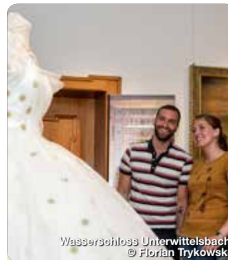
Wasserschloss Unterwittelsbach