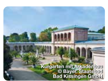
Kurgarten mit Arkadenbau

Bad Hindelang ist nicht nur Heilklimatischer Kurort und Kneipp-Heilbad. Durch das große Naturschutzgebiet gibt es viel zu entdecken und zu erleben. TreffpunktDeutschland.de/bad-hindelang