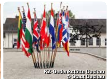
KZ-Gedenkstätte Dachau

Das Museum im Herzen der Altstadt dokumentiert mit ca. 200 Landschaftsbildern und einigen ausgewählten Skulpturen die Entstehung und Entwicklung der Künstlerkolonie Dachau von der Zeit als die Maler die Schönheit der Mooslandschaft entdeckten bis weit ins 20. Jahrhundert hinein. Bei einem Rundgang entdeckt man u.a. bekannte Namen wie Eduard Schleich d. Ä., Christian Morgenstern, Carl Spitzweg oder Lovis Corinth. Zusätzlich zur Dauerausstellung veranstaltet die Gemäldegalerie jährlich Sonderausstellungen zu anderen Künstlerkolonien. Konrad-Adenauer-Straße 3, Dachau