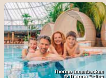
Therme Innenbecken