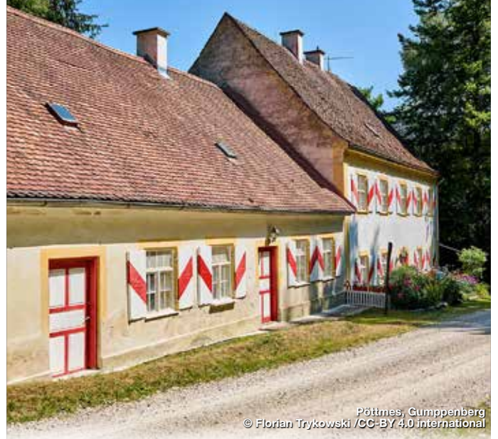
Pöttmes, Gumpenberg

Entlang der Rundwanderung um und durch Pöttmes liegen drei Schlösser, von denen heute nur noch das Schloss in Pöttmes selbst und das Schloss Schorn erhalten sind. Die „Drei Schlösser-Tour“ führt durch eine Allee hinauf zum Gumpenberg. Die hügelige Landschaft am Rande des Donaumooses bietet immer wieder herrliche Ausblicke. Der Wanderweg führt anschließend ein Stück durch den Laubwald und am Schorner Weiher vorbei zurück nach Pöttmes. Der westliche Torturm in Pöttmes, der durchgängig mit einem Weißstorchennest belegt ist, ist ein weiteres Highlight der Wanderung.