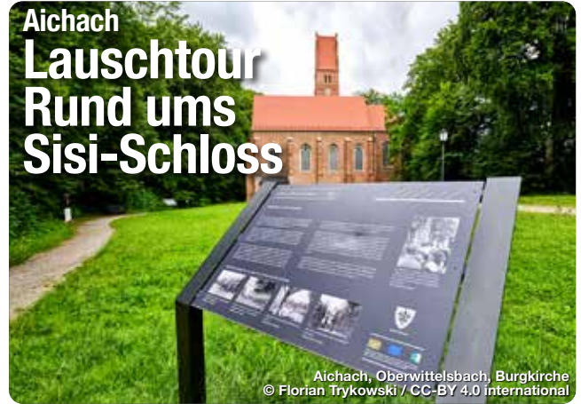
Aichach, Oberwittelsbach, Burgkirche