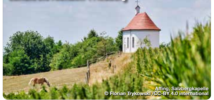
Affing, Salzbergkapelle

Der Wiege Altbayerns. Das „Wittelsbacher Land“, so nennt sich der Landkreis Aichach-Friedberg, verdankt seinen Namensgebern eine reichhaltige Geschichte. Die 1209 zerstörte „Burg Wittelsbach“ ist der ehemalige Stammsitz der Wittelsbacher – und auch wenn heute von der ehemaligen Burg nur noch Mauerreste übrig sind, so verweisen doch viele andere Sehenswürdigkeiten auf dieses Herrschergeschlecht. Die beiden charmanten Herzogstädte Aichach und Friedberg, prachtvolle Schlösser oder barocke Wallfahrtskirchen laden Dich herzlich zu einem Besuch ein. Zugleich bietet die malerische Landschaft die perfekte Umgebung für eine Freizeitaktivitäten wie etwa Wandern, Radfahren oder Familienausflüge. treffpunktdeutschland.de/wittelsbacher-land