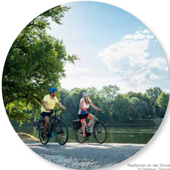
Radfahren an der Donau