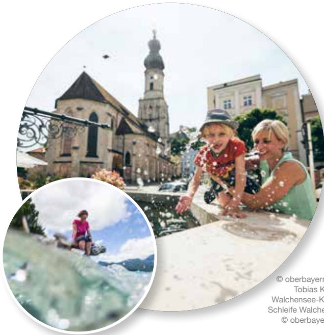
© oberbayern.de / Tobias Köhler Walchensee-Kunstschleife Walchensee © oberbayern.de

Im Südosten des Freistaats Bayern gelegen, begrenzt von den imposanten Alpen im Süden und der Donau im Norden, zählt Oberbayern mit seinen rund 17.500 Quadratkilometern Fläche und rund 4,4 Millionen Einwohnern seit jeher zu den bedeutendsten nationalen und internationalen Urlaubsdestinationen. Hier liegt die Weltstadt München mit ihrem kulturellen Reichtum; mit Top-Museen, großer Oper, beeindruckender Architektur und großzügigen Parks – inklusive gemütlicher Biergärten. In Oberbayern haben Adelsgeschlechter wie die Wittelsbacher ihre Spuren hinterlassen, mit weltbekannten Schlössern und eindrucksvollen Burgenanlagen.