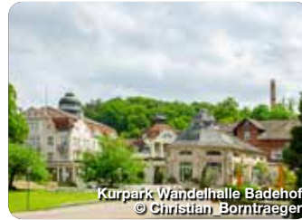
Kurpark Wandelhalle Badhof