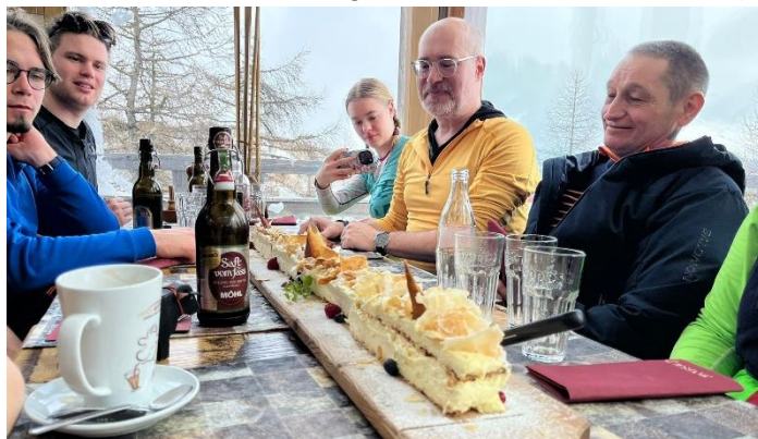
Die 1-m-Crèmeschnitte auf der Moosalp.

Auch kulinarisch hatte die Woche wieder viel zu bieten: Zu den von wechselnden Kochgruppen zubereiteten Abendessen gehörten Klassiker wie Älplermagronen oder Gschwelkti, aber auch asiatische Spezialitäten wie Thai-Curry oder Mah-Meh. Besonders in Erinnerung bleiben wird jedoch die 1 Meter (!) lange Riesen-Crèmeschnitte nach dem Zmittag im Pistenrestaurant Moosalp.