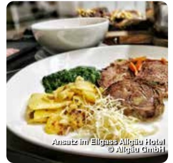
Ansatz im Ellgass Allgäu Hotel

Das Tier von der Nase mit zum Schwanz ganzheitlich verwerten – dieser Gedanke steckt hinter dem Ansatz „from nose to tail“, dem man mittlerweile immer häufiger begegnet. Hin zu einem verantwortungsbewussten und nachhaltigen Konsum, weg von Massenkonsum und Wegwerfgesellschaft – ein Ziel, das sich viele aktuell setzen.