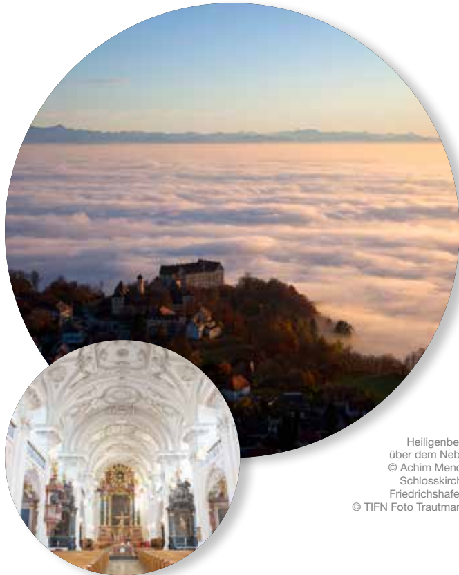
Heiligenberg über dem Nebel © Achim Mende Schlosskirche Friedrichshafen, © TIFN Foto Trautmann