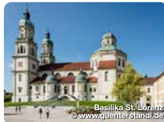
Basilika St. Lorenz

Die kleine Residenzstadt Immenstadt schmiegt sich elegant an die Allgäuer Berge mit dem Naturpark Nagelfluhkette. TreffpunktDeutschland.de/immenstadt