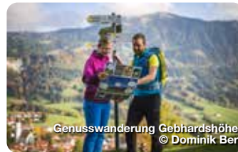
Genusswanderung Gebhardshöhe

Mit drei Wasserski- und Wakeboardliften, dem neuen Aqua Chimp (Kletteraction im schwimmenden Dschungel) und Aquapark, Spielplatz, Beachvolleyballfeld, großzügiger Liegewiese uvm. ist für jeden etwas Passendes dabei. Am Inselsee, Blaichach