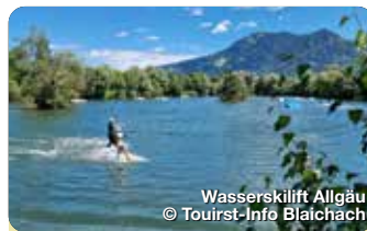
Wasserskilift Allgäu

Vom Bienenlehrpfad über zwei Tobel hin zum Wasserskilift hat Blaichach einiges zu bieten. Das Gunzesrieder Kräutertal gilt als Schatzkästchen der Natur. Hier findet jeder das passende Freizeitangebot - Sommer wie Winter. TreffpunktDeutschland.de/blaiachach