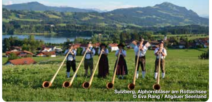
Sulzberg, Alphornbläser am Rottachsee

Der Landkreis Oberallgäu, im Süden Bayerns gelegen, ist ein wahres Paradies für Naturliebhaber und Erholungssuchende. Geprägt von einer atemberaubenden Alpenkulisse, bietet die Region zahlreiche Möglichkeiten für Outdoor-Aktivitäten wie Wandern, Skifahren und Mountainbiken. Besonders beeindruckend sind die Allgäuer Alpen mit dem bekannten Nebelhorn und dem idyllischen Alpsee. Kulturell Interessierte kommen in charmanten Städten wie Oberstdorf und Immenstadt auf ihre Kosten, wo traditionelle bayerische Architektur und gastfreundliche Menschen den besonderen Charme des Allgäus ausmachen. Auch Wellness und Entspannung werden großgeschrieben, etwa in den zahlreichen Thermen und Kurorten. TreffpunktDeutschland.de/tourismus-region