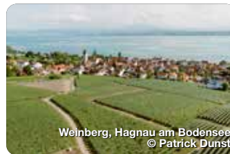
Weinberg, Hagnau am Bodensee