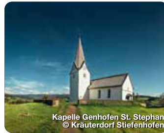
Kapelle Genhofen St. Stephan

Schon der Ausblick in die Allgäuer Alpen und auf den Bodensee weckt Glücksgefühle. Auf dem 540 Meter langen Baumwipfelpfad „Skywalk“ wandeln Abenteuerlustige durch die Baumkronen. Dieser Blickwinkel in den Wald ist etwas Besonderes. Hier befinden sich Besucher auf Höhe der Baumkronen, wo sie sich sonst nicht befinden. Auf der schwingenden Hängebrückenkonstruktion braucht es dafür eine kleine Portion Mut. Am Ende lohnt es sich. Mit etwas Glück begegnen Naturfreunde dem Rot Milan auf Augenhöhe und können den mächtigen Vögeln beim Fliegen zuschauen. Rollstuhlfahrer und Kinderwagen gelangen durch einen gläsernen Aufzug auf alle Etagen des Baumwipfelpfades, bis zur 40 Meter hohen Aussichts-Plattform. Oberschwenden 25, Scheidegg