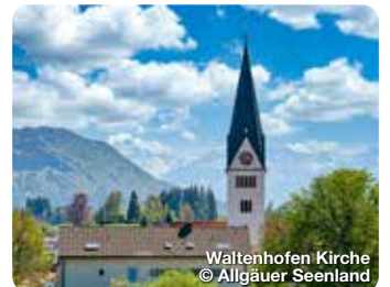
Waltenhofen Kirche