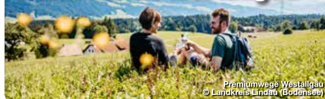
Premiumwege Westallgäu

Das Westallgäu ist eine wunderschöne Voralpenlandschaft, die zum Wandern und Erkunden einlädt. Die Region bietet auf ihren zertifizierten aussichtsreich Premiumwanderwegen über 65 Wanderkilometer, die vorbei an rauschenden Gewässern, zu weiten Ausichten und durch die Kühle des Waldes führen. Hinter jeder Kurve der Wander- und Spazierwege entdeckt man ein neues Naturerlebnis. Eine Besonderheit, die auch das Deutsche Wanderinstitut davon überzeugt hat, die sieben Wandertouren für ihre hohe Erlebnisqualität auszuzeichnen. Jeder der 3 Premium-Wanderwege und 4 Premium-Spazierwanderwege im Westallgäu hat