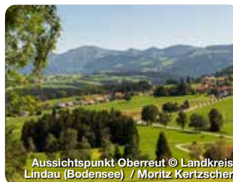
Aussichtspunkt Oberreit