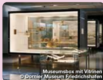
Museumbox mit Vitrinen