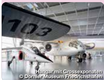
Hangar mit Grossexponaten

Der Traum vom Fliegen wird wahr – auf einer Reise durch 100 Jahre Geschichte der Luft- und Raumfahrt! Riesige Flugboote, nostalgische Passagiermaschinen und spannende Exponate aus der Raumfahrt lassen den Besuch im Dornier Museum Friedrichshafen am Bodensee zu einem einmaligen Erlebnis werden. In direkter Nachbarschaft zum Bodensee-Airport präsentiert das Museum eine Erlebniswelt auf über 6.000 m². Neben den rund 400 Ausstellungsstücken lassen zahlreiche Originalflugzeuge und Nachbauten wie der Dornier Wal und die Dornier Merkur den Pioniergeist des vergangenen Jahrhunderts lebendig werden. Unzählige Weltrekorde, Patente und technische Höchstleistungen dokumentieren die eindrucksvolle Geschichte des Unternehmens Dornier. Claude-Dornier-Platz 1, Friedrichshafen