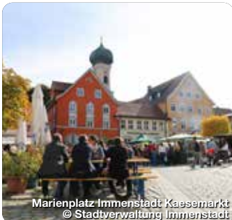
Marienplatz Immenstadt Kaesemarkt

Die Burgruine Sulzberg gilt als größte Burgruine des Oberallgäus. Von Anfang Mai bis Ende Oktober ist das Burgmuseum mit Funden aus sechs Jahrhunderten an Sonn- und Feiertagen von 13.30 bis 16.30 Uhr bei guter Witterung geöffnet. Sulzberg