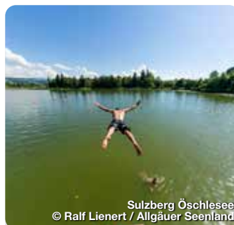
Sulzberg Öschlesee