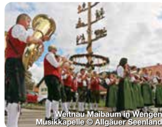
Weitnau Maibaum in Wengen Musikkapelle

Kempten hat eine spannende Entwicklung erlebt, von Römerstadt Cambodunum über die zweigeteilte Reichs- und Stiftsstadt Kempten bis hin zur vereinigten Stadt, was sich vielerorts erkunden lässt: TreffpunktDeutschland.de/kempten