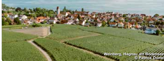
Weinberg, Hagnau am Bodensee

Zwischen Weinbergen und See ist das Leben schön. Die Hagnauer wissen das. Und sie teilen dieses besondere Lebensgefühl mit ihren Gästen. Die freundliche Seegemeinde ist ein außergewöhnliches Urlaubsziel. Das zeigt sich auf einem Streifzug durch den alten Ortskern genauso wie beim Spaziergang am Bodenseeufer, bei einer Tour durch die das Dorf umgebenden Weinberge oder bei einer Stippvisite in den Kellergewölbden der Winzergenossenschaft. Die Weinberge und das Umland sind von Rad- und Wanderwegen durchzogen und von Aussichtspunkten gekrönt. Den sensationellen Blick über den See auf die Schweizer Berge schätzt man hier sehr und trifft sich im Weinberg oder beim Sundowner am Ufer des Sees. In vielen gemütlichen Gaststätten kommen frische Bodenseespezialitäten auf den Tisch und werden stilecht mit einem der fein-fruchtigen Erzeugnisse der Hagnauer Winzerfamilien genossen. TreffpunktDeutschland.de/hagnau-am-bodensee