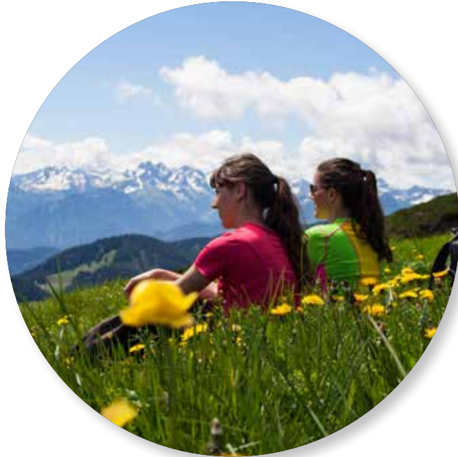
Wandern Naturpark Immenstadt