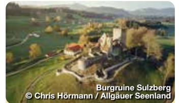
Burgruine Sulzberg