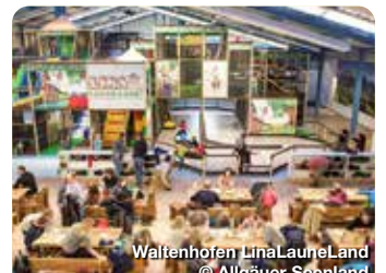
Waltenhofen Lina-Laune-Land

Der Stammsitz der ehemaligen Herren von Trauchburg ist als Burganlage seit dem 12. Jahrhundert bekannt und heute noch ein beliebter Platz. Altrauchburg 1, Weitnau