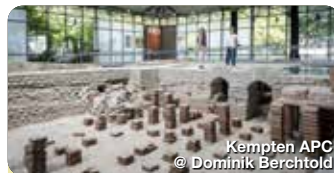
Kempten APC

Der 1.451 hohe Mittagberg bietet einen herrlichen Panoramablick in die Oberstdorfer Berge und ins Alpenvorland. Eine historische Doppelsesselbahn führt direkt von Immenstadt aus in zwei Abschnitten zum Gipfel. Mittagstraße 30, Immenstadt