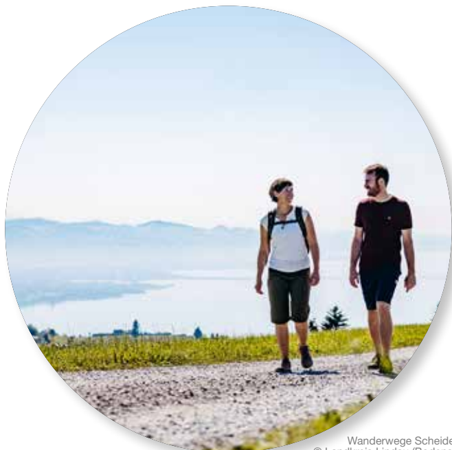
Wanderwege Scheidegg