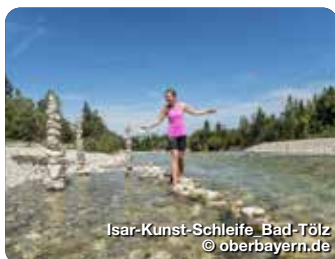
Isar-Kunst-Schleife Bad-Tölz

Prinzregentenstr. 89, 81675 München, Tel.: 089 638958790, info@oberbayern.de, www.oberbayern.de