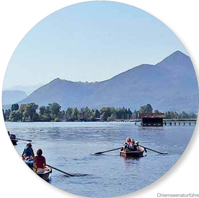
Chiemseenaturführer © Prien Marketing GmbH / Chiemsee-Naturführer