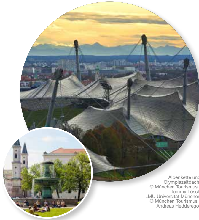
Alpenkette und Olympiastadion LMU Universität München