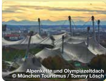
Alpenkette und Olympiazeltdach

Der Olympiapark München ist ein beeindruckendes Zeugnis moderner Architektur und sportlicher Geschichte. Er wurde für die Olympischen Spiele 1972 errichtet und bietet heute eine Vielzahl an Freizeitmöglichkeiten. Die markanten Zelte des Olympiastadions, das hoch aufragende Olympiaturm und die weiten Grünflächen laden zum Entdecken und Entspannen ein. Besucher können den atemberaubenden Blick vom Turm genießen oder eine Führung durch das Stadion unternehmen. Der Park beherbergt zudem das Sea Life Aquarium und das Olympische Dorf. Mit regelmäßig stattfindenden Konzerten und Festivals ist der Olympiapark ein lebendiger Treffpunkt für Kultur- und Sportbegeisterte. Spiridon-Louis-Ring 21, München