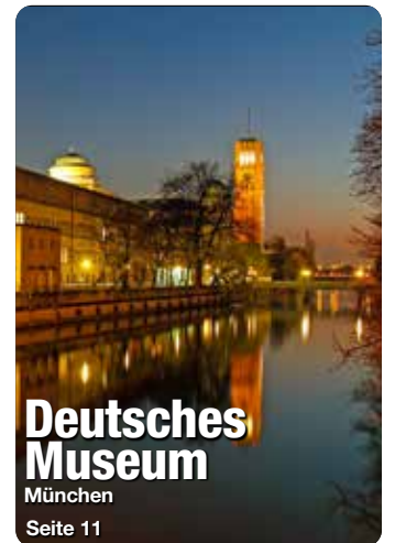
Deutsches Museum München Seite 11