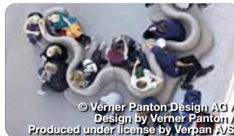
© Verner Panton Design AG / Design by Verner Panton / Produced under license by Verpan AVS