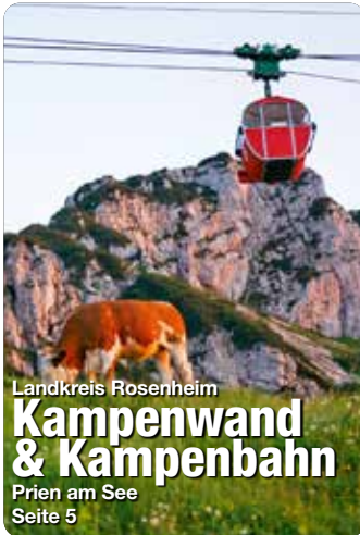
Landkreis Rosenheim Kampenwand & Kampenbahn Prien am See Seite 5

Auf diese Frage versuchen wir Ihnen in diesem Reisemagazin WILLKOMMEN IN DER REGION Rosenheim eine Antwort zu geben. Zuerst stellen wir Ihnen den Landkreis Rosenheim vor. Danach folgen die angrenzenden Landkreise mit ihren Orten, Sehenswürdigkeiten und Event-Highlights. Abschließend gibt es noch Tipps für Ihren nächsten Urlaub.