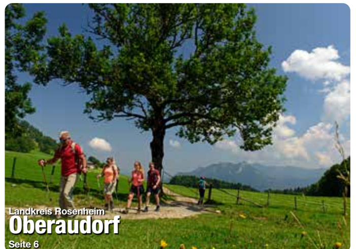
Landkreis Rosenheim Oberaudorf Seite 6

Jetzt QR-Code scannen, ePaper herunterladen und noch mehr Seiten als hier online entdecken!