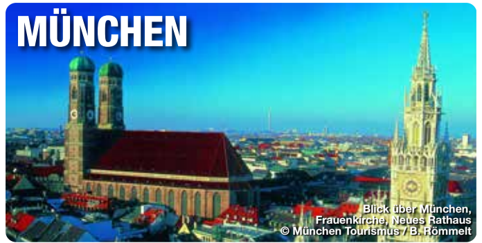
Blick über München, Frauenkirche, Neues Rathaus

Es ist die unvergleichliche Mischung aus Weltoffenheit und Tradition, aus Hightech und Bodenständigkeit, aus Innovation und charmanter Gelassenheit, die München für Touristen aus aller Welt so anziehend macht. Die bayerische Landeshauptstadt mit ihren 1,54 Millionen Einwohnern bietet alles, was sich der Gast für seinen perfekten Aufenthalt erträumt: Eine weitgefächerte Kunst- und Kulturszene, unbegrenzte Sport- und Shoppingmöglichkeiten, ein lebendiges Bar- und Nachtleben, eine vielseitige Gastronomie und ein exzellentes öffentliches Verkehrsnetz. Ihren hohen Freizeit- und Naherholungswert verdankt die Stadt den zahlreichen grünen Oasen wie dem Englischen Garten, den Isarauenden Parkanlagen der Schlösser sowie der Nähe zu den Alpen und den oberbayerischen Seen.