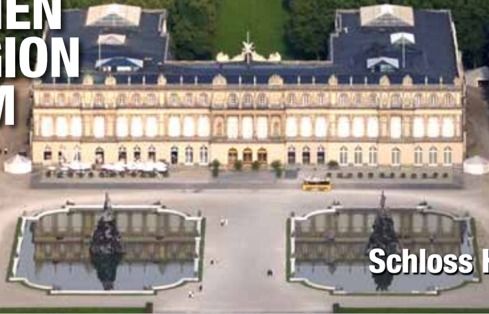
Landkreis Rosenheim Schloss Herrenchiemsee