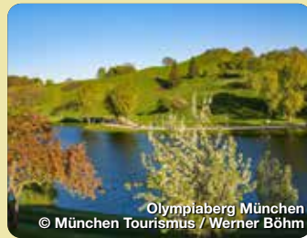
Olympiaberg München