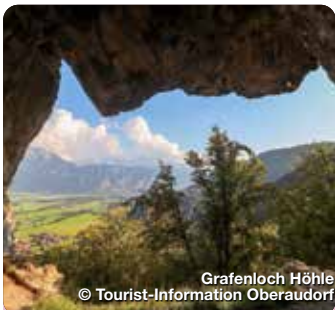
Grafenloch Höhle