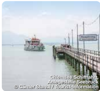
Chiemsee Schifffahrt, Anlegestelle Seebruck