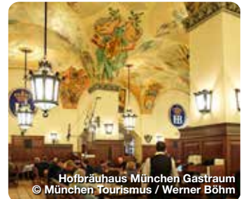
Hofbräuhaus München Gastraum

Referat für Arbeit und Wirtschaft München Tourismus Verkehrsverein Nürnberg e.V. 80331 München Telefon: 089 233 96500 tourismus@muenchen.de, www.muenchen.travel