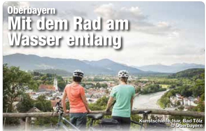
Kunstschleife-Isar, Bad Tölz

Die Seen und Flüsse Oberbayerns als stetige Begleiter, erstrecken sich die Wasser-Radlwege auf über 1.200 Kilometer und verbinden durch das ausgeklügelte Radwegenetz charmante Orte mit malerischen Landschaften sowie vielfältigen Kultur- und Freizeitangeboten. Drei Hauptschleifen widmen sich jeweils einem charakteristischen Thema der Region – dem Hopfen im Norden, dem Salz im Südosten und der Kunst im Südwesten. Zentraler Dreh- und Angelpunkt ist dabei stets die Landeshauptstadt München.