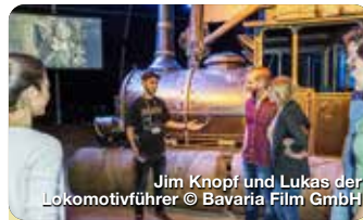
Jim Knopf und Lukas der Lokomotivführer © Bavaria Film GmbH