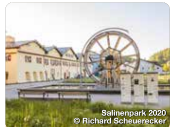
Salinenpark 2020

Binnen weniger Minuten schwebt die Rauschberg Großkabinenseilbahn auf 1.670 m und eröffnet das Tor zu einem atemberaubenden Bergpanorama, der höchsten Kunstmeile der bayerischen Alpen. Knogel 12, Ruhpolding