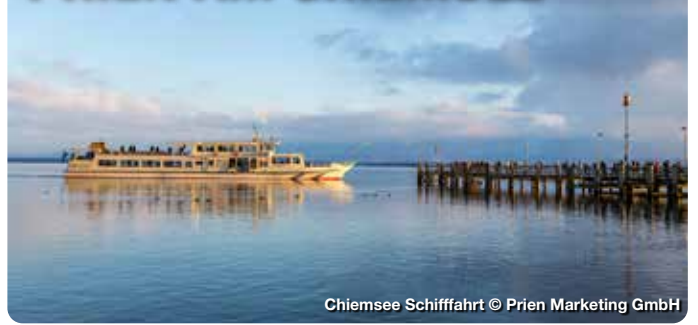
Chiemsee Schifffahrt

Urlaub am bayerischen Meer. Mit einem breiten Kultur- und Freizeitangebot lockt die historische Seegemeinde Jung und Alt an den Chiemsee. So folgen Besucher etwa via Schiff den Spuren König Ludwigs II. zum prunkvollen Schloss auf Herrenchiemsee. Mit dem mittelalterlichen Münster und dem großen Obst- und Kräutergarten lohnt sich auch ein Ausflug auf die benachbarte Fraueninsel. Bei den Priener Direktvermarkter sammeln Aktive auf unterschiedlichen Radl-, E-Bike- und Wanderrouten regionale Schmankerl für ihr individuelles „Do-it-yourself“-Picknick. Beste Aussichten für Wanderer versprechen verschiedene Themenwege wie beispielsweise der „Priener Postkartenweg“. TreffpunktDeutschland.de/prien-am-chiemsee