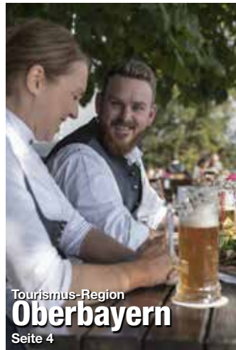
Tourismus-Region Oberbayern Seite 4