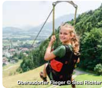
Oberaudorfer Flieger © Sissi Richter