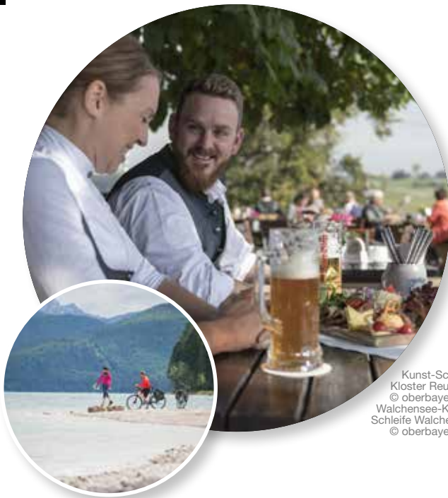
Kunst-Schleife Kloster Reutberg © oberbayern.de Walchensee-Kunst- Schleife Walchensee © oberbayern.de

Im Südosten des Freistaats Bayern gelegen, begrenzt von den imposanten Alpen im Süden und der Donau im Norden, zählt Oberbayern mit seinen rund 17.500 Quadratkilometern Fläche und rund 4,4 Millionen Einwohnern seit jeher zu den bedeutendsten nationalen und internationalen Urlaubsdestinationen. Hier liegt die Weltstadt München mit ihrem kulturellen Reichtum; mit Top-Museen, großer Oper, beeindruckender Architektur und großzügigen Parks – inklusive gemütlicher Biergärten. In Oberbayern haben Adelsgeschlechter wie die Wittelsbacher ihre Spuren hinterlassen, mit weltbekanntesten Schlössern und eindrucksvollen Burganlagen.