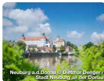
Neuburg a.d. Donau