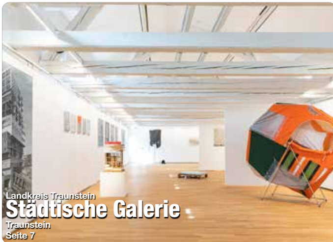
Landkreis Traunstein Städtische Galerie Traunstein Seite 7