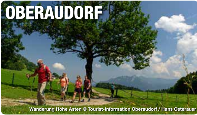
Wanderung Hohe Asten

Im bayerischen Inntal, eingebettet zwischen dem Wendelsteingebirge, dem Inn und dem bekannten Kaisergebirge, nahe dem Chiemgau und der bayerischen Landeshauptstadt München, liegt die idyllische Urlaubsdestination Oberaudorf. Hier findet sich alles, was man für naturnahe Erholung braucht – und das in allen vier Jahreszeiten: sanfte Hügel, abwechslungsreiche Bergwelten, traumhafte Seen, vielzählige Wander- und Fahrradwege, Ski- und Rodelpisten, Langlaufloipen und ein besonderes Highlight für Familien – der Erlebnisberg Oberaudorf-Hoheck. Mit guter Infrastruktur und einem breiten Erholungs-, Freizeit- und Kulturangebot, bietet die Destination darüber hinaus zahlreiche Möglichkeiten zur Urlaubsgestaltung. TreffpunktDeutschland.de/oberaudorf