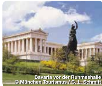
Bavaria vor der Ruhmeshalle