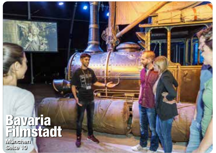
Bavaria Filmstadt München Seite 10