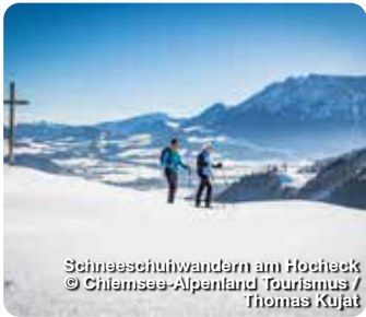
Schneeschuhwandern am Hoheck

Im bayerischen Inntal, eingebettet zwischen dem Wendelsteingebirge, dem Inn und dem bekannten Kaisergebirge, nahe dem Chiemgau und der bayerischen Landeshauptstadt München, liegt die idyllische Urlaubsdestination Oberaudorf. Hier findet sich alles, was man für naturnahe Erholung braucht – und das in allen vier Jahreszeiten: sanfte Hügel, abwechslungsreiche Bergwelten, traumhafte Seen, vielzählige Wander- und Fahrradwege, Ski- und Rodelpisten, Langlaufloipen und ein besonderes Highlight für Familien – der Erlebnisberg Oberaudorf-Hoheck. Mit guter Infrastruktur und einem breiten Erholungs-, Freizeit- und Kulturangebot, bietet die Destination darüber hinaus zahlreiche Möglichkeiten zur Urlaubsgestaltung. TreffpunktDeutschland.de/oberaudorf