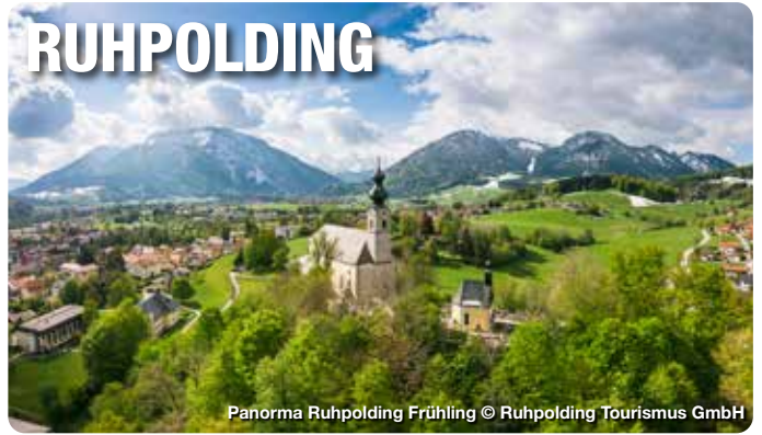
Panorama Ruhpolding Frühling

Ruhpolding im südöstlichen Feriendreieck Deutschlands ist ein besonderes Stück Bayern. Zwischen Chiemsee, Alpenvorland und Chiemgauer Alpen breitet die Natur ihre ganze Vielfalt aus. Die ursprüngliche, bayerische Volkskultur gibt den Gästen ein echtes Heimatgefühl. Im Norden der Chiemsee, ringsum die Gipfel der Chiemgauer Alpen – dazwischen das Miesenbacher Tal, durch welche die weiße Traun plätschert, und das Drei-Seen-Naturschutzgebiet „Klein-Kanada“. Mitten drin in dieser Idylle liegt das 7.000-Seelen-Dorf Ruhpolding mit der mächtigen barocken Kirche und Lüftmalerei an den schmucken Bürgerhäusern. Ruhpolding ist ein bekannter Tourismusort – und ein Genuss-Tipp für alle Jahreszeiten. TreffpunktDeutschland.de/ruhpolding