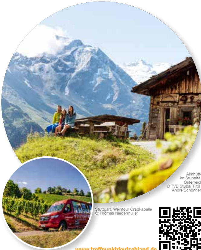
Almhütte im Stubaital, Österreich