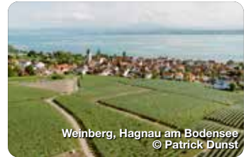
Weinberg, Hagnau am Bodensee