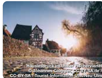
Häuslesbrück im Ulmer Fischerviertel

Das Flair einer ehemals Freien Reichsstadt erspüren, aufregende zeitgenössische Architektur erleben – in Ulm kein Widerspruch. Rund um das gotische Münster mit dem größten Kirchturm der Welt entfaltet sich eine pulsierende Mischung aus Tradition und Aufbruch. Als kleine Großstadt ist Ulm zusammen mit seiner jungen Schwesterstadt Neu-Ulm auf der bayerischen Donauseite ein Reiseziel für Entdeckungen vielsagender/angenehmer Kontraste. 768 Wendeltreppenstufen himmelwärts! Bei gutem Wetter reicht der Blick hier oben bis zu den Alpen. Draußen, beim Schlendern durch die gemütlichen Gassen ringsumher, bildet der 161,53 Meter hohe Westurm des 1377 begonnen Münsters eine feste Wegmarke – als Mittelpunkt der Stadt/stiller Beobachter des Stadtgeschehens und Symbol ihrer mittelalterlichen Macht. TreffpunktDeutschland.de/ulm