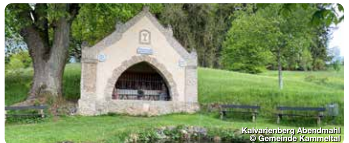
Kalvarienberg Abendmahl