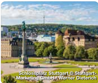
Schlossplatz Stuttgart