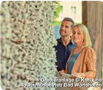
Gradieranlage

Mit zahlreichen Freizeitmöglichkeiten und herzlicher Gastlichkeit empfängt das Kneipp-Original Bad Wörishofen im Allgäu, rund 70 Kilometer westlich von München gelegen, seine Gäste. Viel Bewegung und frische Luft weitab vom Alltagsstress gibt es im 163.000 Quadratmeter großen Kurpark mit Rosen- und Heilkräuter-, Duft- und Aromagärten im Herzen des Kurortes. Der etwa fünf Kilometer lange Glücksweg als Teil der Allgäuer Wandertrilogie erzählt die Geschichte mystischer und heilender Orte mit Anekdoten und Gedichten rund um das Leben von Pfarrer Sebastian Kneipp. Eine Tour auf den 250 Kilometern Rad- und Wanderwegen rund um Bad Wörishofen oder eine Runde Golf auf dem 18-Loch-Platz des Golf Club Bad Wörishofens runden den sportlichen Urlaub ab. TreffpunktDeutschland.de/bad-woerishofen