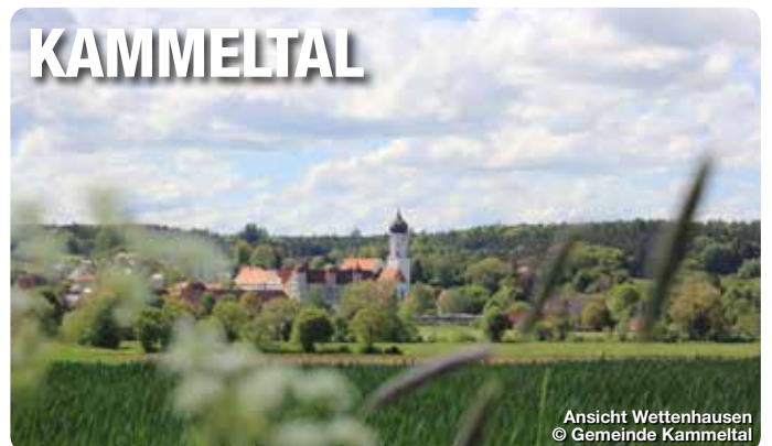
Ansicht Wettenhausen

Die Markgrafenstadt Burgau liegt im schönen Freistaat Bayern in Bayerisch-Schwaben, eingebettet zwischen den Flüssen Mindel und Kammel. Sie ist eine „Perle“ in der Familien- und Kinderregion Landkreis Günzburg, 15 km vom LEGOLAND® in Günzburg entfernt und liegt zentral an der A8 und an der Bahnstrecke Stuttgart – München. Burgau ist geeignet für Tagesausflüge sowie für längere Urlaubsaufenthalte und bietet im und um den historischen Stadtkern herum historische und kulturelle Sehenswürdigkeiten. Dazu bietet Burgau einen gut gefüllten Veranstaltungskalender sowie ein breites Spektrum an hervorragenden Freizeitangeboten wie Radwanderwege, Nordic-Walking-Touren, Freibad, Eissporthalle und vieles mehr. TreffpunktDeutschland.de/burgau