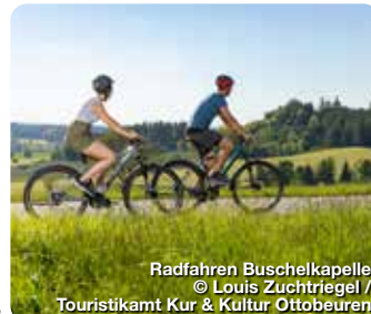
Radfahren Buschelkapelle

Der Urlaubsort Ottobeuren liegt im malerischen Allgäuer Alpenvorland. Den Ortskern prägt die im 8. Jahrhundert gegründete Benediktinerabtei, eine der größten barocken Klosteranlagen der Welt. Unterhalb des Klosters liegt der schicke Marktplatz mit zahlreichen Cafés und Restaurants. Zusammen mit dem angrenzenden Kneipp-Aktiv-Park bilden sie den einladenden Ortskern der Unterallgäuer Gemeinde. Weithin sichtbar erheben sich die 82 Meter hohen Zwillingstürme der im Jahr 1766 fertig gestellten Basilika, die zu den schönsten Barockkirchen in Deutschland zählt. Ottobeuren ist zudem ein hervorragender Ausgangspunkt, um die erholsame Natur und geschichtsträchtige Stätten im Allgäuer Alpenvorland zu entdecken. TreffpunktDeutschland.de/ottobeuren