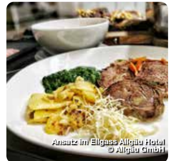
Ansatz im Ellgass Allgäu Hotel

Das Tier von der Nase mit zum Schwanz ganzheitlich verwerten – dieser Gedanke steckt hinter dem Ansatz „from nose to tail“, dem man mittlerweile immer häufiger begegnet. Hin zu einem verantwortungsbewussten und nachhaltigen Konsum, weg von Massenkonsum und Wegwerfgesellschaft – ein Ziel, das sich viele aktuell setzen.