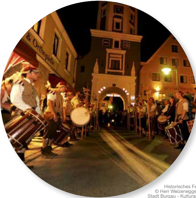
Historisches Fest