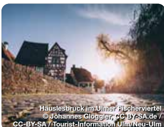
Häuslesbrück im Ulmer Fischerviertel

Die Zentralbibliothek in Ulm ist ein herausragendes kulturelles und intellektuelles Zentrum in der Stadt. Sie ist nicht nur ein Ort des Lesens, sondern auch ein Ort der Bildung, Forschung und Begegnung. Die moderne Architektur des Gebäudes spiegelt die Werte von Fortschritt und Wissen wider, die in dieser Bibliothek gepflegt werden. Mit einer beeindruckenden Sammlung von Büchern, Zeitschriften, digitalen Ressourcen und vielen anderen Medien bietet die Bibliothek ihren Besuchern einen umfassenden Zugang zu Informationen und Wissen in verschiedensten Fachgebieten. Vestgasse 1, Ulm