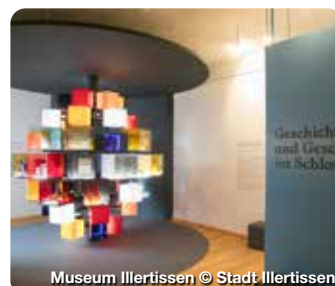
Museum Illertissen