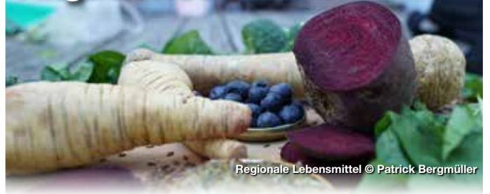
Regionale Lebensmittel

„Superfood“ und „from nose to tail“ sind mittlerweile feste Begriffe in der bunten Welt der Foodtrends. Ob Acai, Goji oder Chia – exotische Beeren oder Samen bevölkern heute jeden gut sortierten Kühlschrank. Besonders super an ihnen: Der hohe Gesundheitswert, daher auch der Name. Besonders nicht super: Sie werden meistens aus fernen Ländern importiert, was ihnen einen besonders großen ökologischen Fußabdruck beschert.