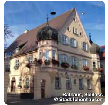
Rathaus, Schloss

Die 1789 neu erbaute Pfarrkirche im Übergangsstil vom Rokoko zum Klassizismus birgt in einem lichten, stimmungsvollen Raum äußerst seltene Fresken von Enderle und Huber. Kirchplatz 8, Burgau