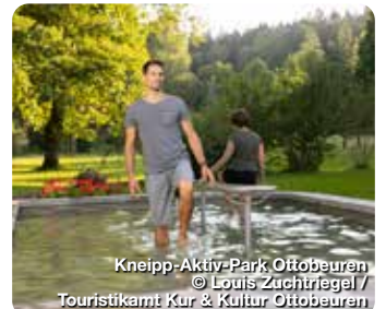
Kneipp-Aktiv-Park Ottobeuren