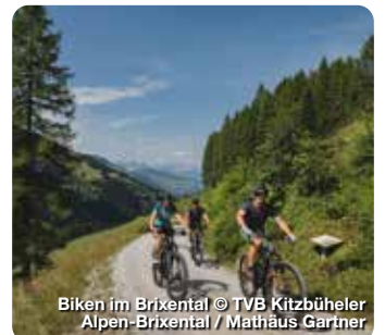
Biken im Brixental

Malerisch eingebettet zwischen Meran und Bozen im Etschtal liegt die Region Lana – Südtirols größte und älteste Apfelanbaugemeinde. Es ist die Fülle an Produkten, die Lana einzigartig machen: Der Duft gerösteter Kastanien, geschmacksintensive Weine aus biodynamischem Anbau oder die vielen Geschäfte und Handwerksbetriebe mit ihrem individuellen Sortiment. Alpin-mediterranes Flair sowie Bewegung auf drei Ebenen beim Wandern und Biken komplettieren das ganzheitliche Urlaubsvergnügen. Ursprüngliche Natur erleben die Gäste auf dem Hausberg Vigiljoch oder beim Spazieren auf den Waalwegen. Kulturell verbindet die Region Historisches wie Castel Lebenberg oder den Schnatterpeck-Altar mit modern interpretierten Orten wie dem Ansitz Kränzelhof, welcher achtenswertes Erlebnis mit Genuss verbindet. Treffpunktitalien.de