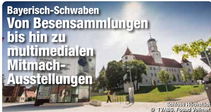
Schloss Höchstädt © TVABS, Fouad Vollmer.

Interessante Geschichte, außergewöhnliche Sammlerstücke und beeindruckende Naturwunder – in Bayerisch-Schwaben spiegelt sich die Vielfalt der Region im Angebot abwechslungsreicher, interaktiver und besonderer Museen wider. So erfahren Besucher Wissenswertes und Erstaunliches über Land und Leute aus vergangenen Zeiten und der Gegenwart. Die kuriose Besenwelt in Günzburg zeigt etwa eine außergewöhnliche Privatsammlung mit über 400 handgemachten Besen in verschiedensten Formen, Farben und Materialien aus aller Welt. Im einzigen Ballonmuseum Europas in Gersthofen erfahren Interessierte auf drei Ebenen an interaktiven Stationen die Geschichte der Ballonfahrt und bekommen im begehbaren Korb schon einmal ein Gefühl für dieses besondere Fortbewegungsmittel. Im RieskraterMuseum in Nördlingen gehen Gäste auf multimediale Weise dem Meteoriteneinschlag vor 14,5 Millionen Jahren auf den Grund und besichtigen ein echtes Stück Mondgestein. Das Edwin Scharff Kindermuseum in Neu-Ulm hingegen begeistert Groß & Klein mit jährlich wechselnden Themen zu unterschiedlichen Wissensgebieten vom Thema „Körper“ bis hin zur Globalisierung. Verschiedene Themenwelten wie beispielsweise das Fugger und Welsler Erlebnismuseum oder das Staatliche Textil- und Industriemuseum Augsburg (tim) nehmen Interessierte mit in die spannende Geschichte der Region. TreffpunktDeutschland.de/bayerisch-schwaben