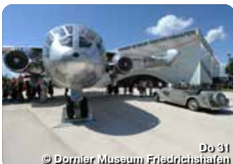
Do 31

Ein gemütliches Weihnachtsmarkt-Hüttendorf mit Bodensee-Panorama und Alpensicht erwartet die Besucher der Bodensee-Weihnacht. Besonderheiten sind der große geschmückte Weihnachtsbaum mitten im Hüttendorf, die lebensgroße Krippe sowie die große Glühwein-Weihnachtspyramide.