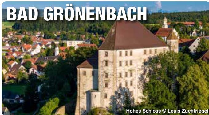
Hohes Schloss

In Bad Grönenbach genießen Gäste das klassische Naturheilverfahren nach Sebastian Kneipp in einer persönlichen Atmosphäre. Hier können Sie gezielt und ganz natürlich etwas für Ihre Gesundheit tun. Bad Grönenbach liegt im Südwesten Bayerns rund 20 km nördlich von Kempten. Die Bad Grönenbacher Stiftskirche und das Hohe Schloss grüßen den Besucher schon von weitem. Die Reize des Ortes und der Umgebung sowie das gehaltvolle Angebot in medizinischer, gastronomischer und kultureller Hinsicht bilden eine Verbindung, deren Charme man gerne erliegt. Kurzweil für einen vergnüglichen Tagesausflug ist ebenso garantiert wie Ruhe, Erholung und Regeneration für den Gast, dem seine Gesundheit am Herzen liegt.