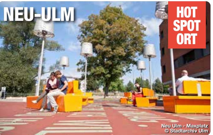
Neu-Ulm - Maxplatz

www.treffpunktdeutschland.de/neu-ulm-region