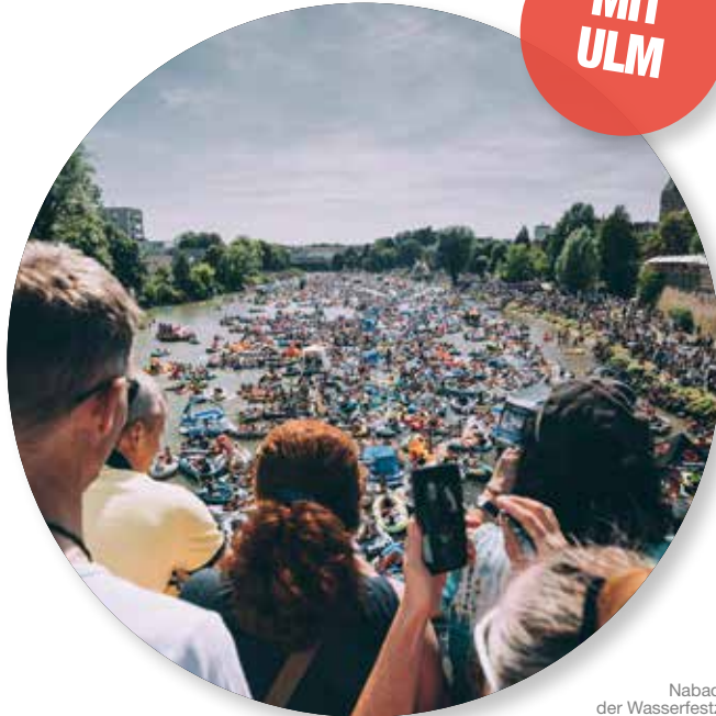
Nabada - der Wasserfestzug am Schwormontag