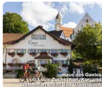
Haus des Gastes