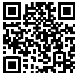
Stuttgart, Weintour Grabkapelle