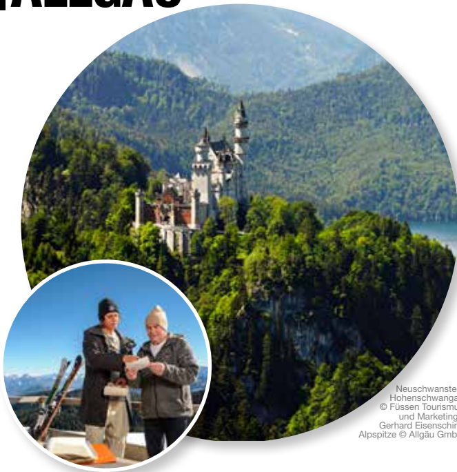
Neuschwanstein Hohenschwangau Alpspitze