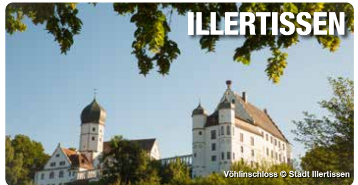
Vöhlenschloss