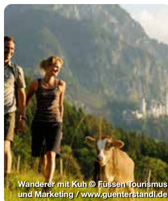
Wanderer mit Kuh